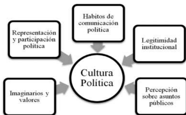
Ilustración 1. Dimensiones de estudio de la cultura política

Representación y participación política; hábitos de comunicación política; Legitimidad Institucional; percepción sobre los asuntos públicos e imaginarios y valores: