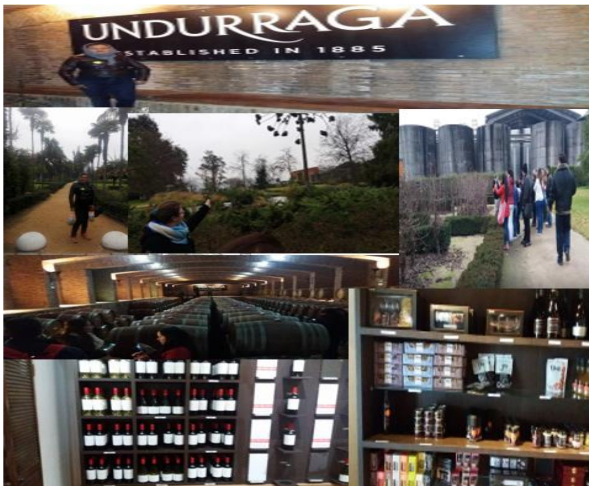
Viñedo Undurraga en Santiago de Chile