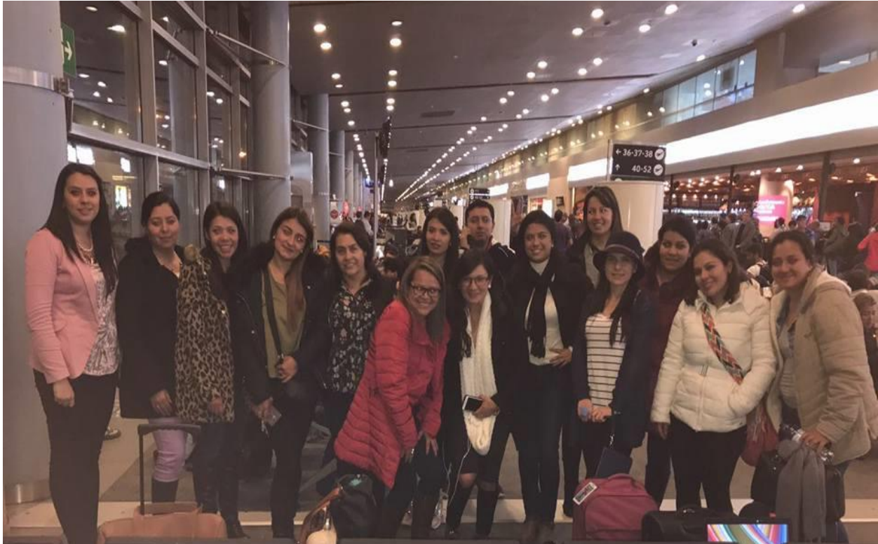
Figura 3: participantes de la primera misión académica cono sur