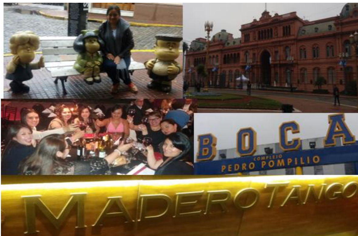
Figura 10: recorrido en Argentina y tango.