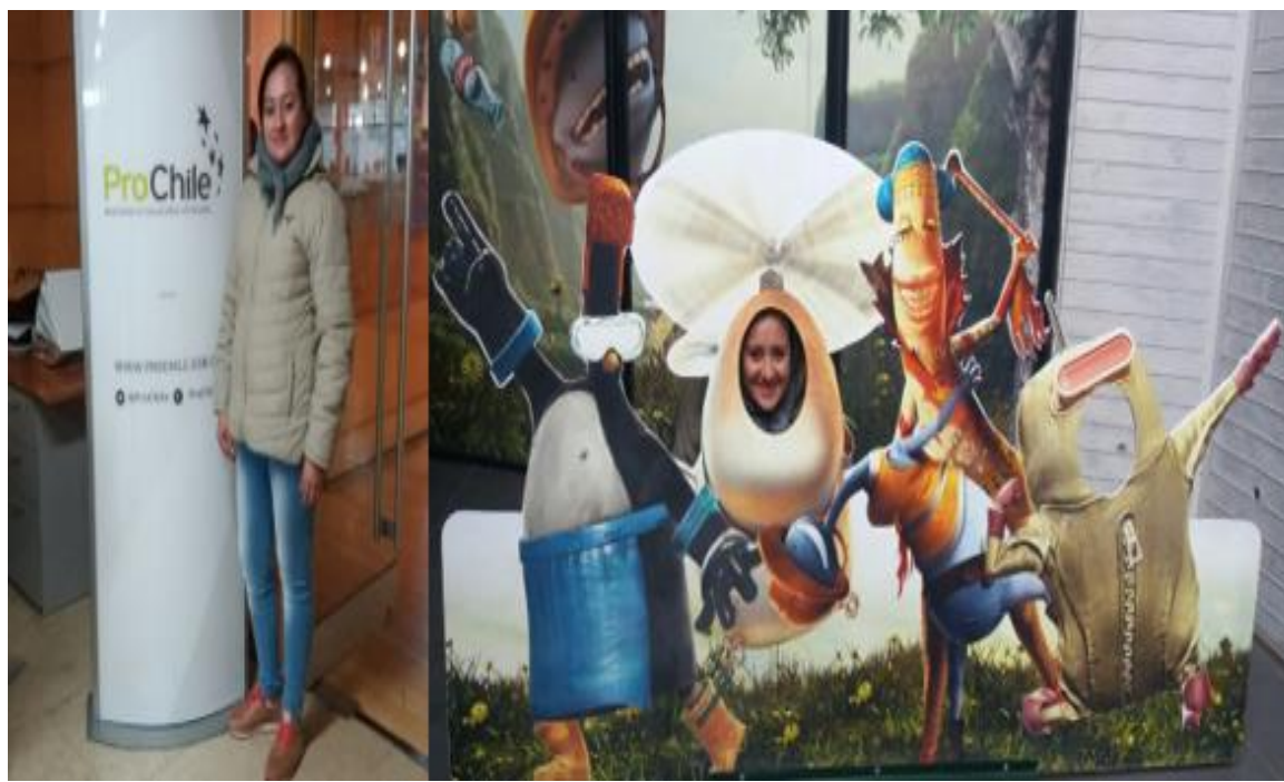
Figura 6: visita a la embotelladora Coca-cola y ProChile

Este día fue llamado el día de la felicidad ya que visitamos la planta embotelladora de Coca-Cola o más llamada la fábrica de la felicidad, en este recorrido vimos mucha tecnología y como los robots ha venido remplazando la mano de obra humana beneficiando la fábrica ya que hay ahorro de dinero y de tiempo ya que los robots trabajan más eficientemente, pero lamentablemente negativo para el índice de empleo del país, en esta visita nos sentimos como niños jugamos, cantamos y nos divertimos mucho sin dejar atrás las muchas cosas que aprendimos, saliendo de este lugar nos dirigimos a un lugar un poco mas formal las oficinas de PROCHILE donde recibimos una explicación breve de lo que es la institución, ProChile es una entidad gubernamental que se dedica a conectar los productos Chilenos con el mercado internacional, saliendo de este lugar nos dirigimos al aeropuerto para despedirnos de este país