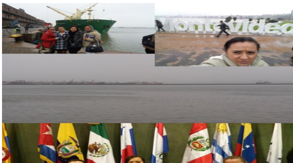
Figura 9: visita a Uruguay puerto marítimo y ALADI

Este día se viajó a Montevideo Uruguay navegando por el río más ancho del mundo el