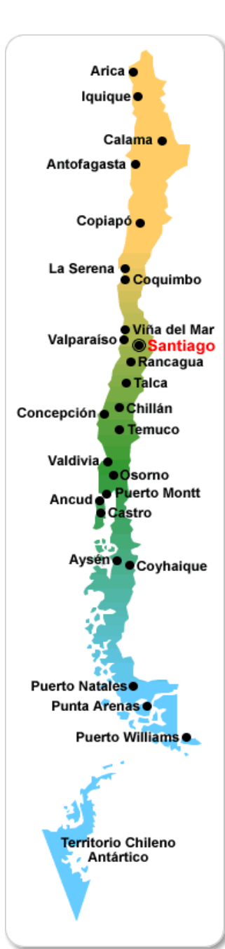
Figura 1: mapa y bandera de Chile

País de extremos único en el planeta tricontinental siendo parte de América, Oceanía y Antártica. poseedor de las ciudades más australes del mundo( punta arenas, puerto natales) el país más largo del mundo con 4.329 km de longitud y también el más angosto con 180 km de anchura, en este país se puede encontrar casi la totalidad de climas existentes en el planeta se exceptúa el clima tropical, también posee el desierto de atacama el más árido del mundo, en este país podemos encontrar la isla de Pascua o Rapa Nui denominada el ombligo del mundo además hace parte del último lugar del mundo la Antártica.