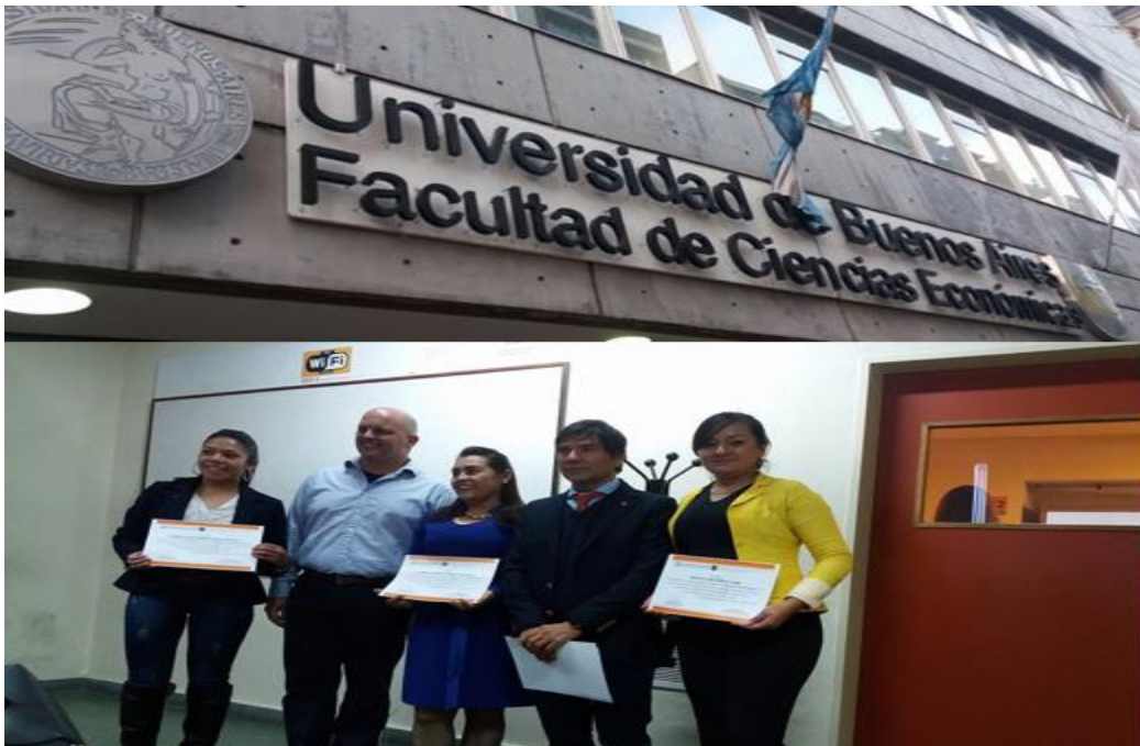
Figura 7: entrega de certificados por la UBA.

Ya en Argentina este día fue uno de los más provechosos profesionalmente ya que se participó en el seminario de innovación y emprendimiento certificado por la universidad de Buenos Aires, este seminario fue muy motivador y generó muchas ideas para proyectos