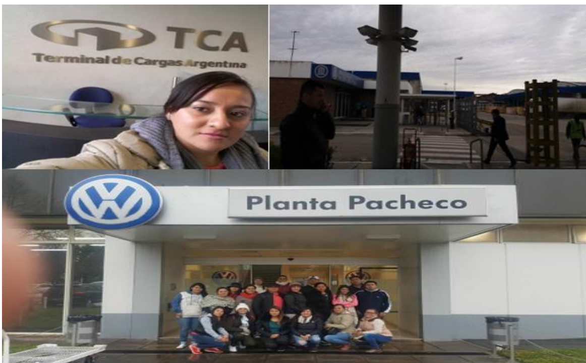
Figura 8: visita a TCA y ensambladora VOLKSWAGEN.