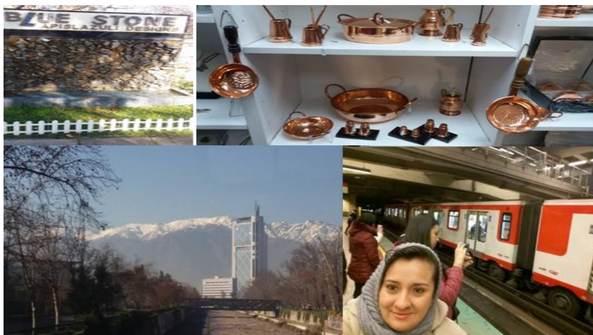
Figura 4: lugares interesantes de Santiago de Chile

Para el primer día de esta maravillosa experiencia el cronograma cambio un poco debido a que llegamos en día electoral en el país de Chile por lo tanto nos dedicamos a hacer un recorrido cultural por la ciudad, donde visitamos algunos parques, almacenes, miradores y lugares