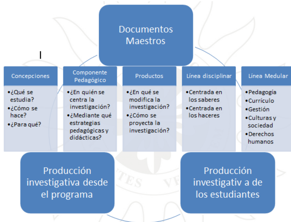
Ilustración 2: Categorías de Análisis. Construcción propia.