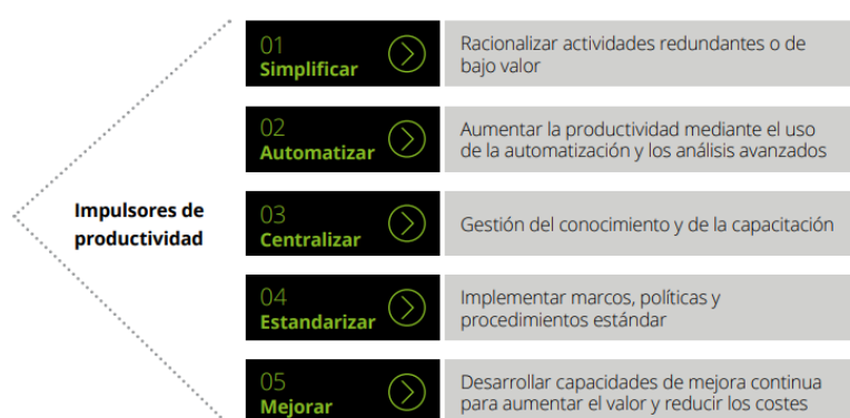
Figura 3 Descripción de los impulsores de productividad, Equipo de Asesoría en Riesgos de Delloite, 202.

Otra de las recomendaciones más importantes se centra en promover la transparencia en la divulgación de información financiera y no financiera. Esto implica mantener registros claros, proporcionar informes periódicos a los accionistas y demás interesados, para garantizar una comunicación clara sobre el desempeño de la empresa, sus riesgos y oportunidades.