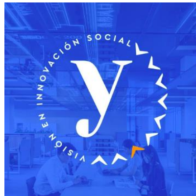
Figura 1. Logo empresarial

Nota: Logo de la empresa Yiwilp https://www.facebook.com/yiwilp