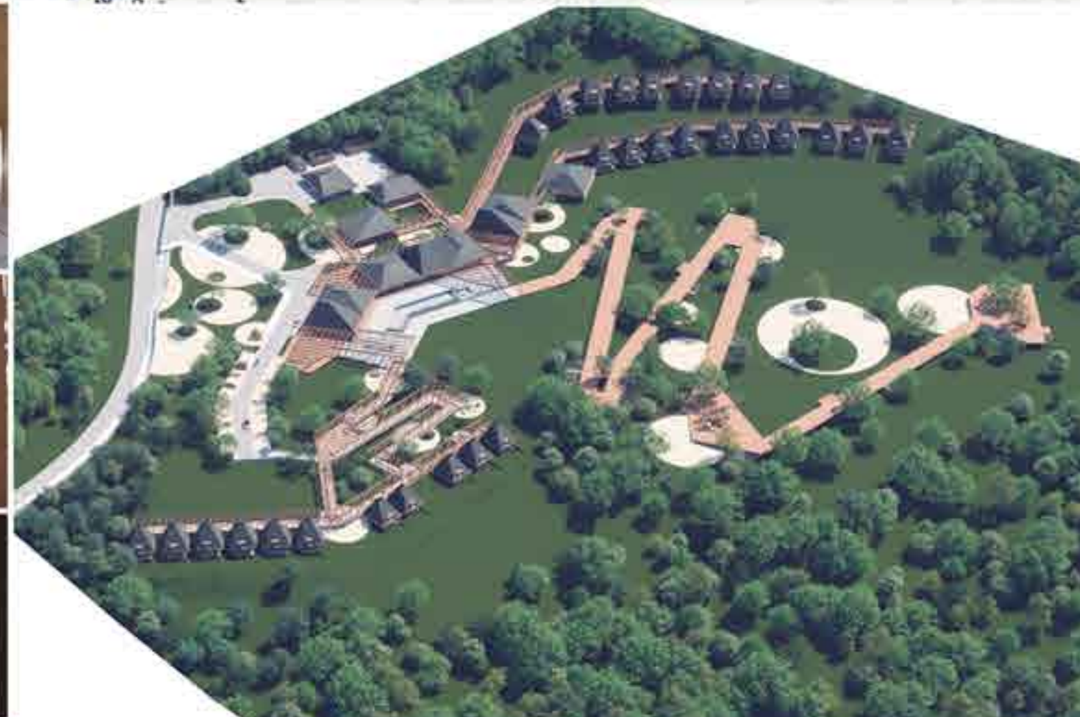
Las formas facetadas del hotel se inspiran en piedras moldeadas por el viento y el tiempo, integrándose de manera natural en el paisaje.