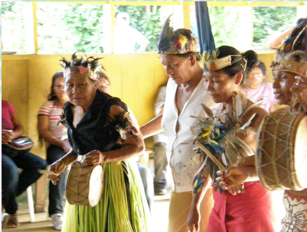
Ilustración 7. Baile típico, comunidad indígena de Mocagua.

Las lenguas y otras formas de comunicación: El lenguaje oral es una de las expresiones culturales desde la cual se construyen y desarrollan los saberes, los conocimientos y el pensamiento mismo; se establecen relacionamientos entre los miembros de una comunidad, son fuentes de identidad y el mejor medio para los aprendizajes, enseñanzas y demás intereses de las culturas. En las lenguas se encuentra la visión cósmica de la vida y reflejan una concepción de vida. La educación propia vivencia las lenguas indígenas y otras formas de lenguaje que mantienen la identidad y la comunicación entre los pueblos, como las señas, los sueños, el canto de los animales, los sonidos de la naturaleza, la música, la pintura facial, las manifestaciones artesanales, la arquitectura, entre otros. (CONTCEPI 2012. Pág. 23).