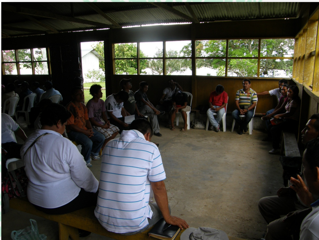
Ilustración 5. Mocagua, Amazonas. Minga de pensamiento indígena.

escuchados por entidades gubernamentales y dar su opinión frente a cómo debía entenderse el desarrollo en su territorio, significó la relevancia en espacios de discusión pública.