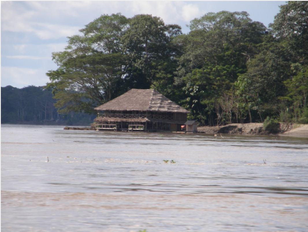
Ilustración 6. Río Amazonas.

La espiritualidad indígena: Que constituye la energía que da vida a las culturas, a través de la cual se relacionan y convergen los elementos del universo, genera equilibrio y armonía de tal forma que exista la reciprocidad en el universo, vista como la relación genuina entre el hombre y la naturaleza.