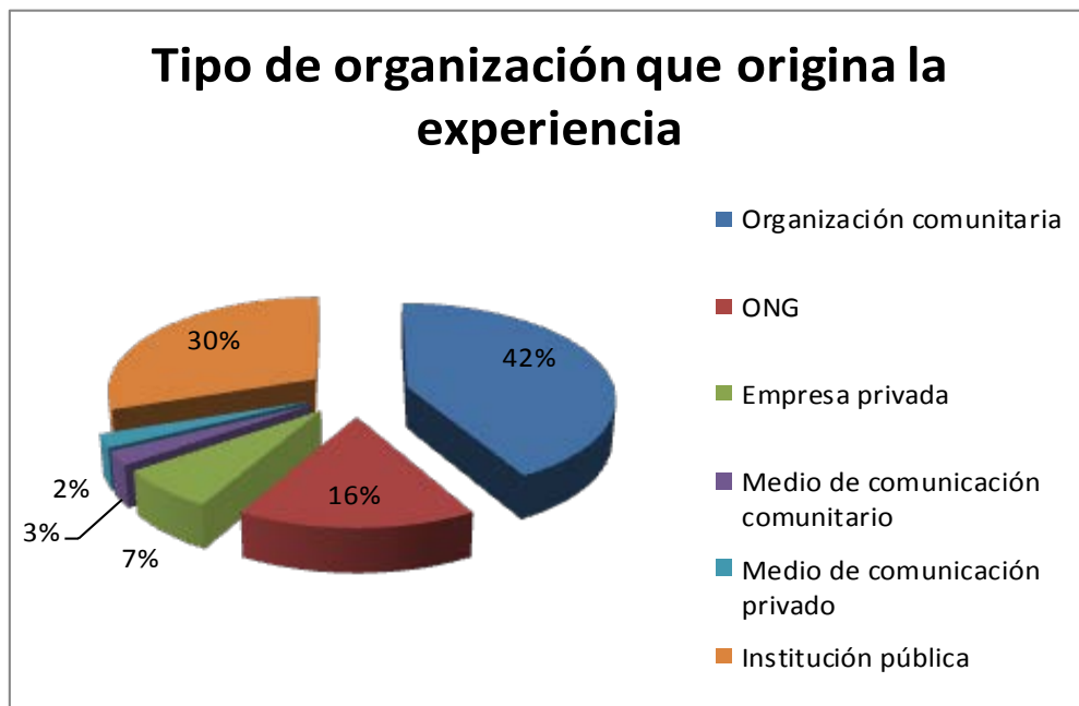
Ilustración 2. Tipo de organización que origina experiencias en pro del medio ambiente en la región amazónica