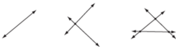
Figura 2. Ejemplo tarea propuesta en el espacio académico didáctica del álgebra a través de la modelización de problemas geométricos.

Ejercicio 6. Si dibuja 35 líneas en un pedazo de papel de modo que no haya dos líneas paralelas entre sí y no haya tres líneas secantes, ¿cuántas veces se cruzarán?