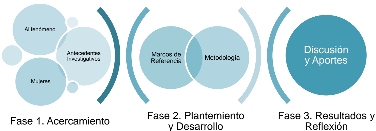
Figura 2. Trayectoria del Proceso Investigativo

El proceso investigativo se realizó en tres fases principales, la primera consistió en el acercamiento al fenómeno y a los antecedentes del mismo por medio de la elaboración de Resúmenes Analíticos Investigativos (RAIs) con el propósito de elaborar una valoración de la situación investigativa del fenómeno, de éste proceso surge la elaboración del planteamiento del problema y justificación. Posteriormente en ésta misma fase se realizó un acercamiento a mujeres víctimas de violencia sexual en el marco del conflicto armado, éste se hizo por medio de un encuentro con la Secretaría Distrital de la Mujer en el que se pudo compartir la propuesta investigativa y se hizo el contacto con las mujeres que se interesaron en ella.