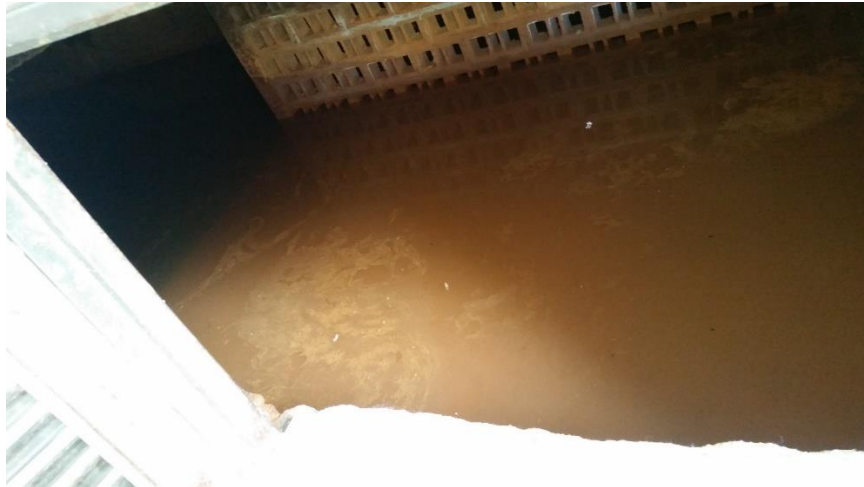
Figura 1. Tanque de almacenamiento de infiltración de agua subterránea.