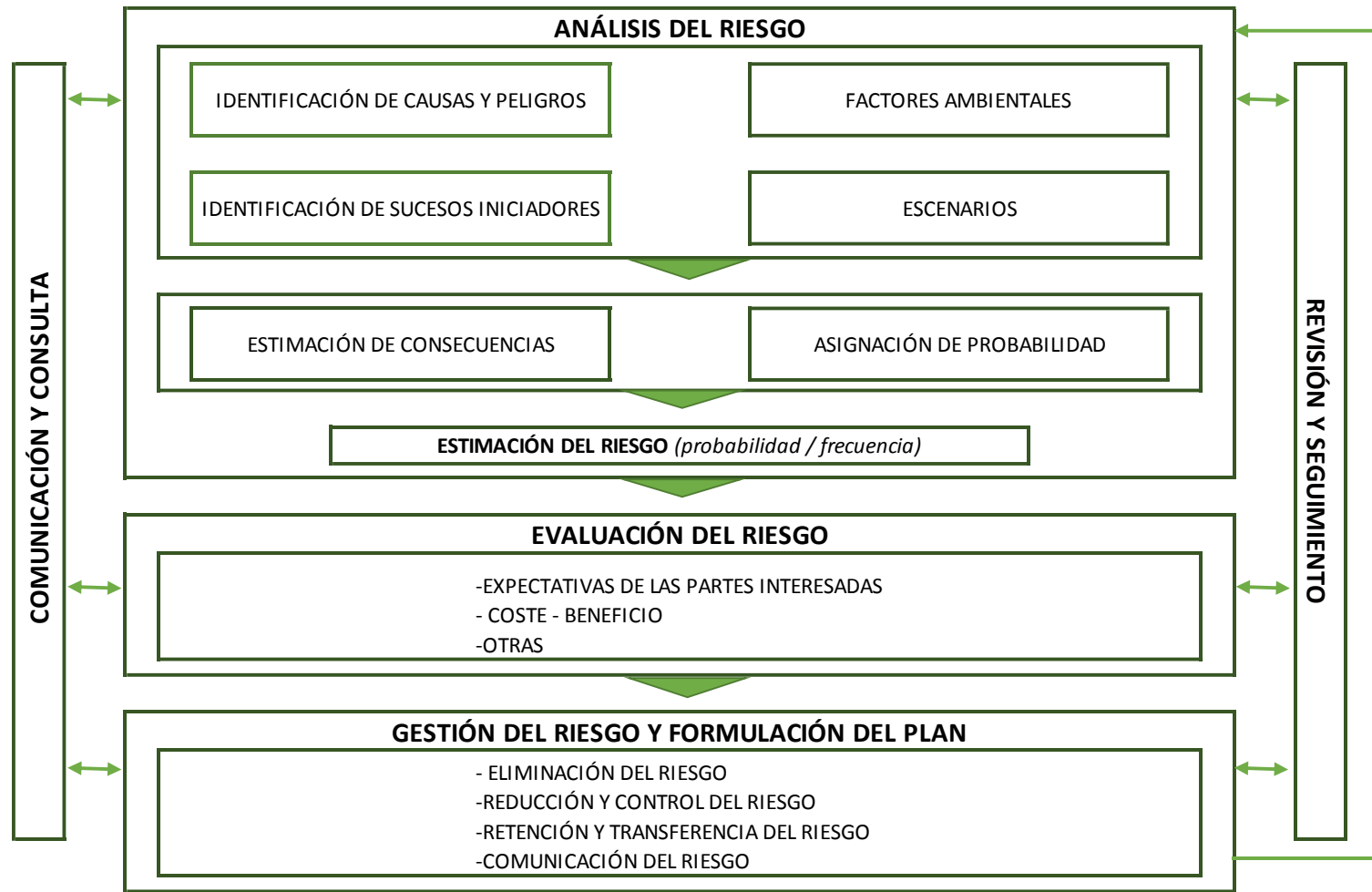
Figura 5. Diagrama general de evaluación del riesgo