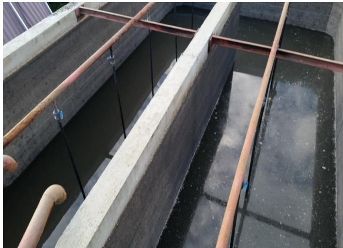
Figura 2. EDAR clausurada Campus San Alberto Magno

Debido a la acumulación de aguas residuales generadas, producto de las actividades de uso de baños, aseo, funcionamiento de cafeterías y laboratorios, estas eran previamente sometidas a un pretratamiento en una estación depuradora de aguas residuales (EDAR), la cual constaba de un proceso de coagulación química y floculación mediante agitadores (figura 2). Dicha estación fue clausurada y parte de los vertimientos permanecían en el lugar de dicha instalación al momento de la inspección. Sin embargo, a raíz de la clausura de dicho sistema se genera un riesgo con respecto al desborde del agua contenida allí, ya que la ubicación del campus San Alberto Magno, genera características climáticas húmedas y de precipitaciones continuas, aumentando así la probabilidad de ocurrencia de un desborde, aún más por la presencia de lluvias torrenciales (figura 3).