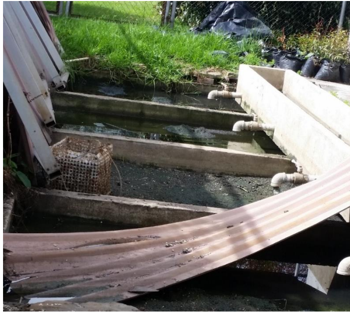
Figura 3. Retención de aguas en EDAR clausurada.