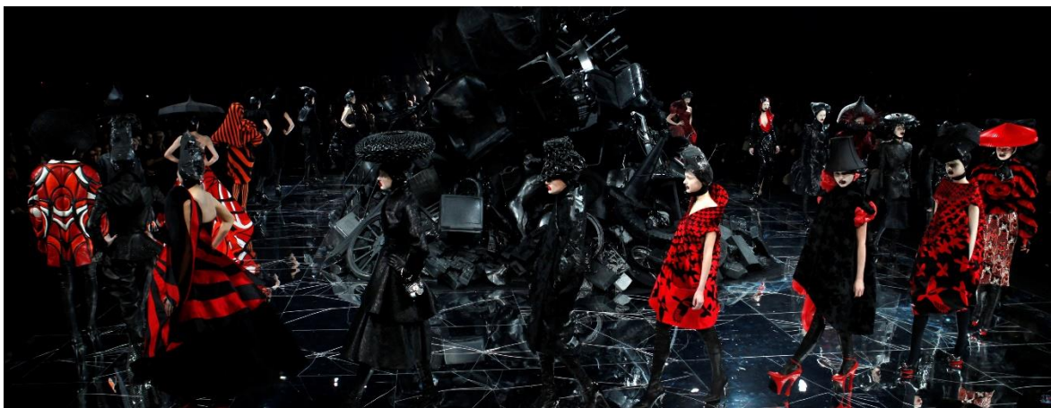
Figura 3-4: Pasarela de la colección The horn of plenty, Otoño/Invierno 2009/2010