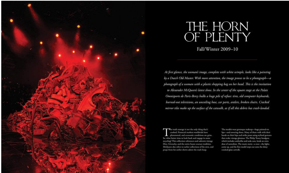
Figura 3-3: Invitación oficial a la exhibición de la colección The horn of plenty, Otoño/Invierno 2009/2010