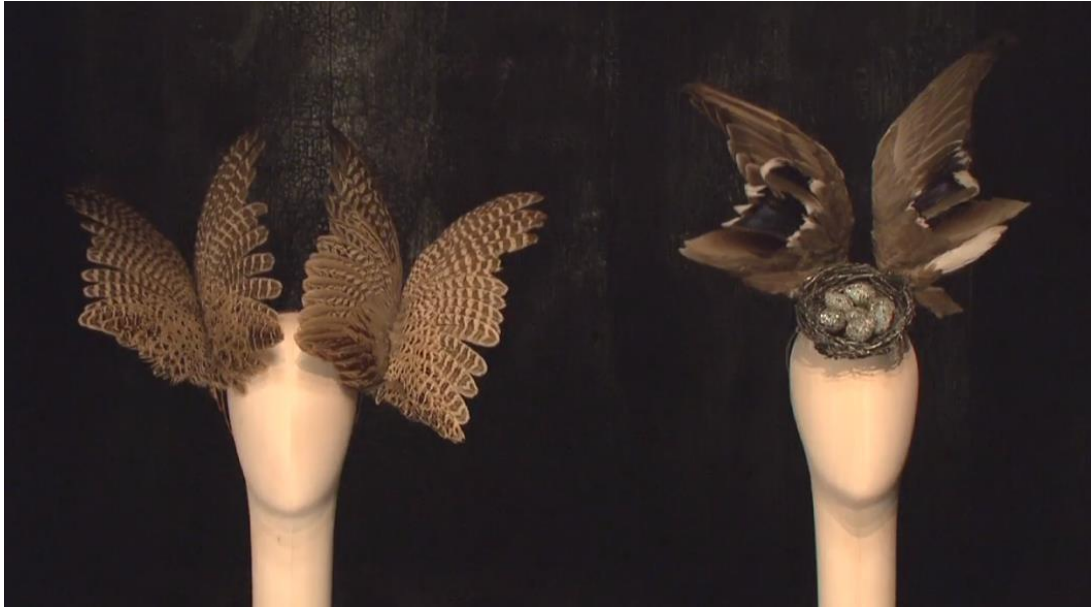
Figura 2-12: El gabinete de Curiosidades de la exposición Savage Beauty del Met 2011.