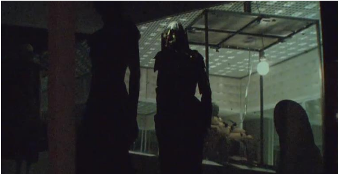
Figura 2-18: Performance final de la colección Voss Primavera/Verano 2000

Tomado de: https://www.metmuseum.org/metmedia/video/collections/ci/mcqueen-savage-beauty . 25 de febrero de 2019.