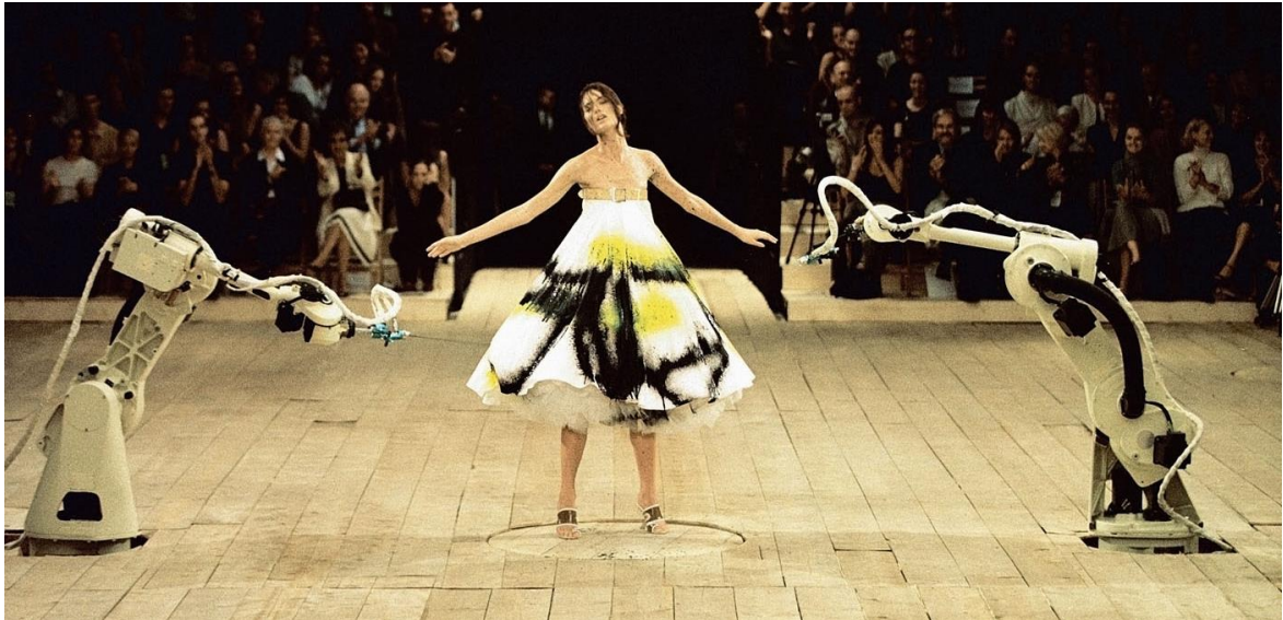
Figura 1-2: Performance de la colección Primavera/Verano 1999.