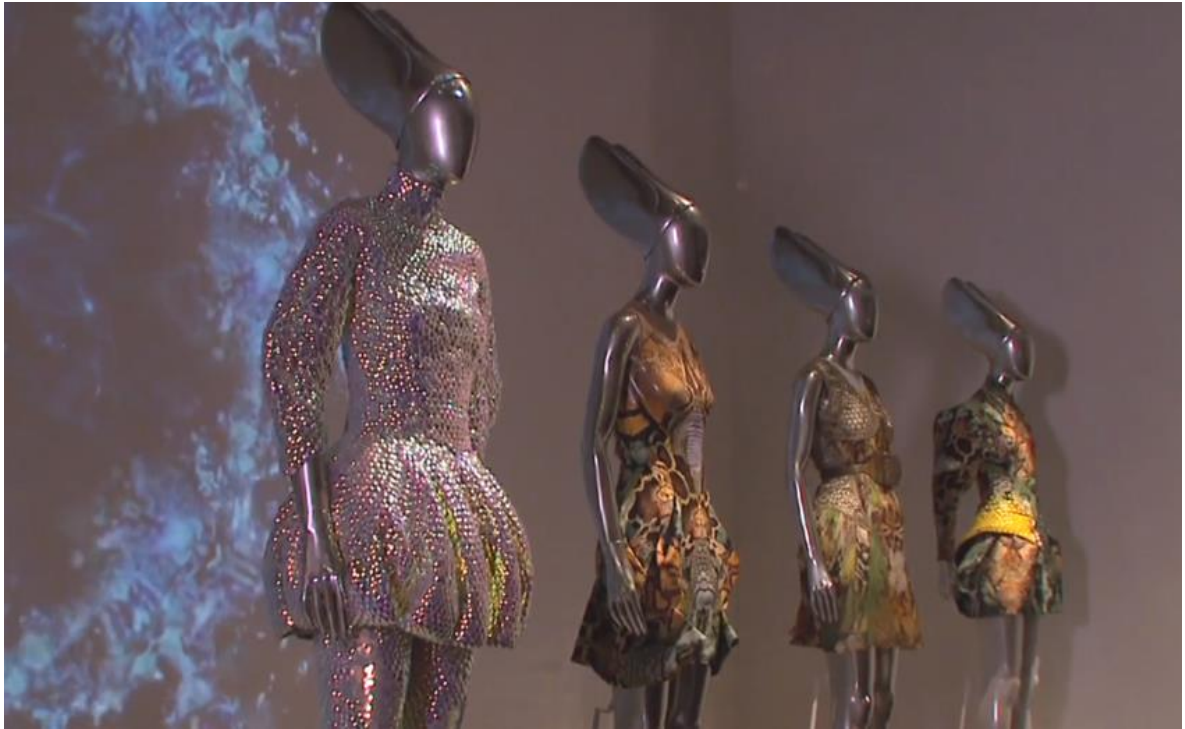
Figura 2-31: Sala Plato's Atlantis de la exposición Savage Beauty del Met 2011

Tomado de: https://www.metmuseum.org/metmedia/video/collections/ci/mcqueen-savage-beauty . 25 de febrero de 2019.