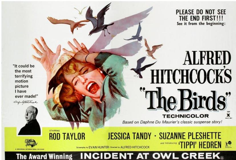
Figura 3-12: Afiche publicitario de la película The Birds de Alfred Hichcock de 1963.