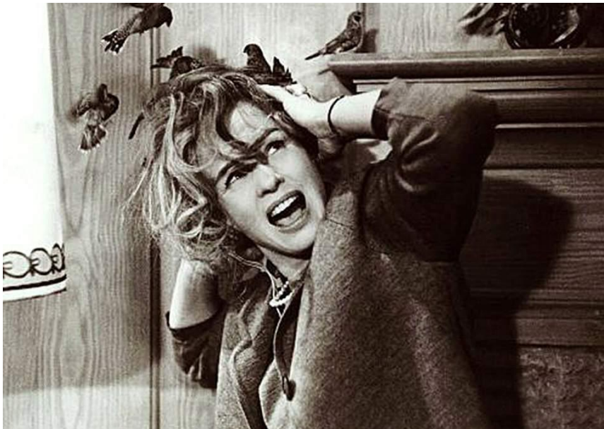
Figura 3-13: Imagen de la la película The Birds de Alfred Hichcock de 1963.