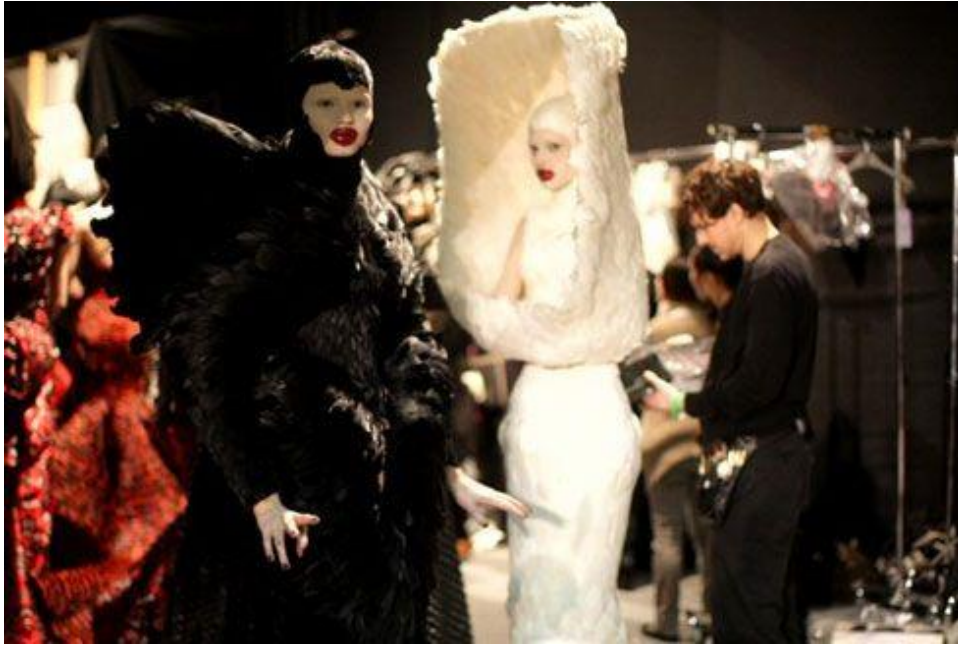
Figura 3-5: Detrás de cámaras del desfile de la colección The horn of plenty, Otoño/Invierno 2009/2010