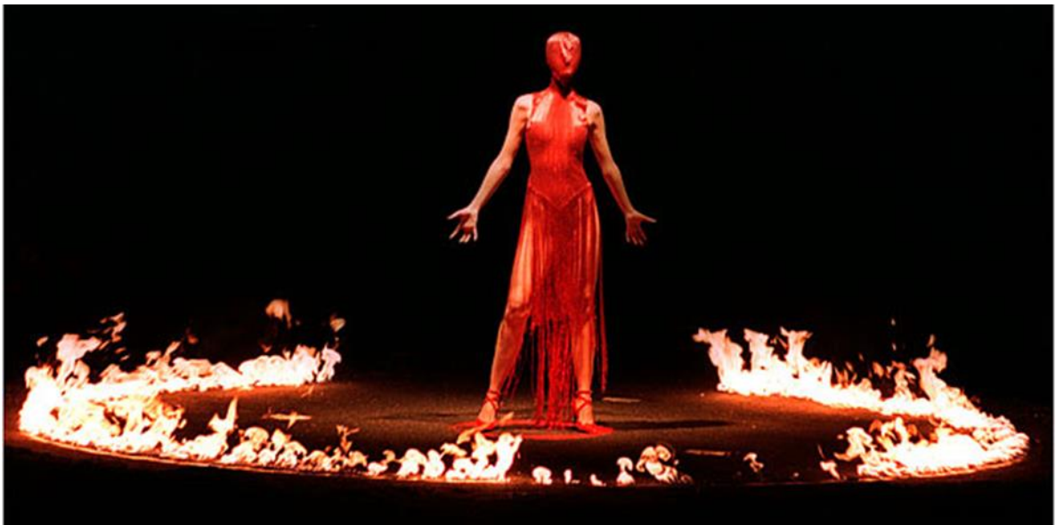
Figura 1-3: Performance de la colección Extravaganza Otoño/Invierno 1998