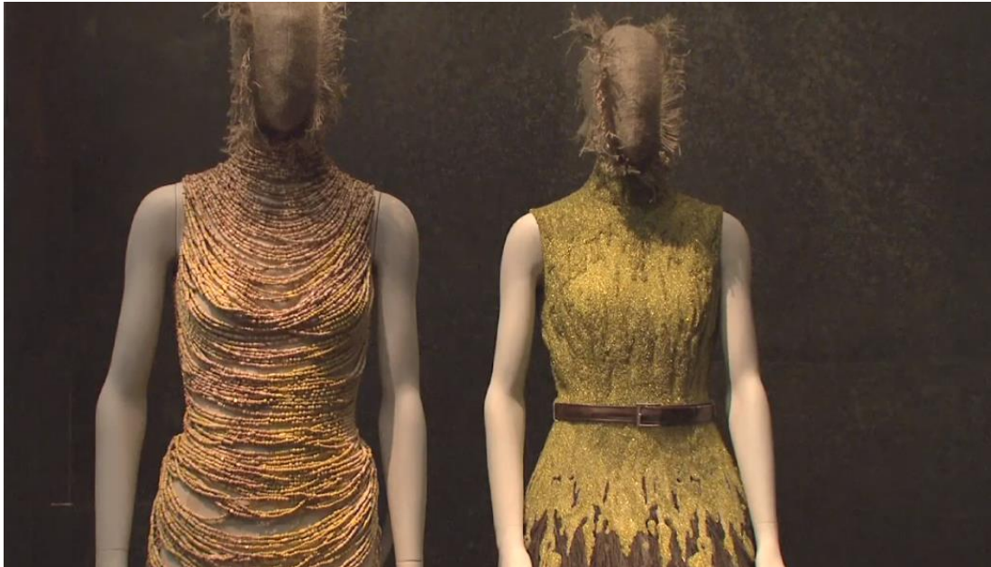
Figura 2-23: Sala primitivismo romántico de la exposición Savage Beauty en el Met 2011