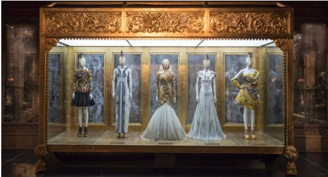
Figura 2-5: Vitrina de la sala del Museo V&A de Londres.