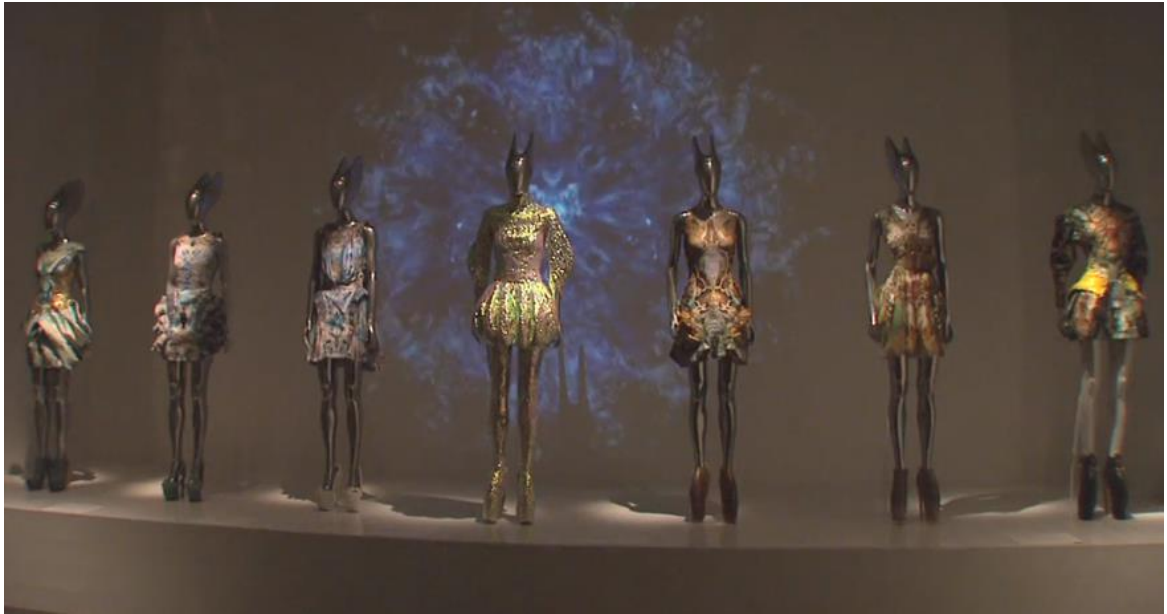
Figura 2-29: Sala Plato's Atlantis de la exposición Savage Beauty del Met 2011