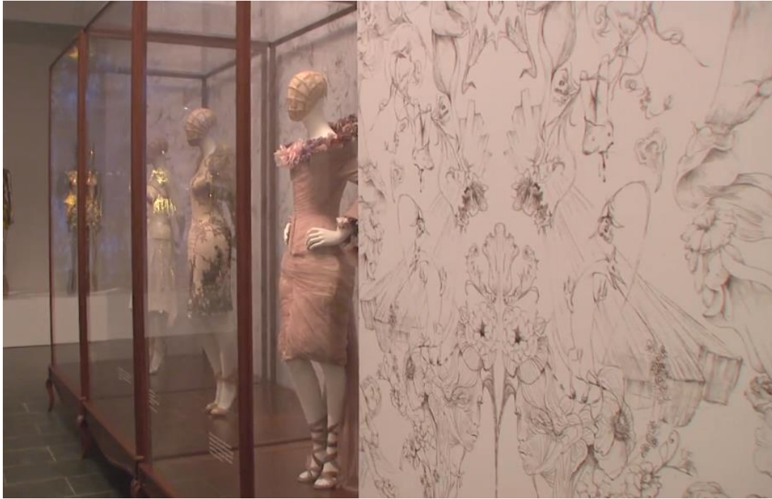
Figura 2-28: Vitrina de la sala Naturalismo romántico de la exposición Savage Beauty del Met 2011