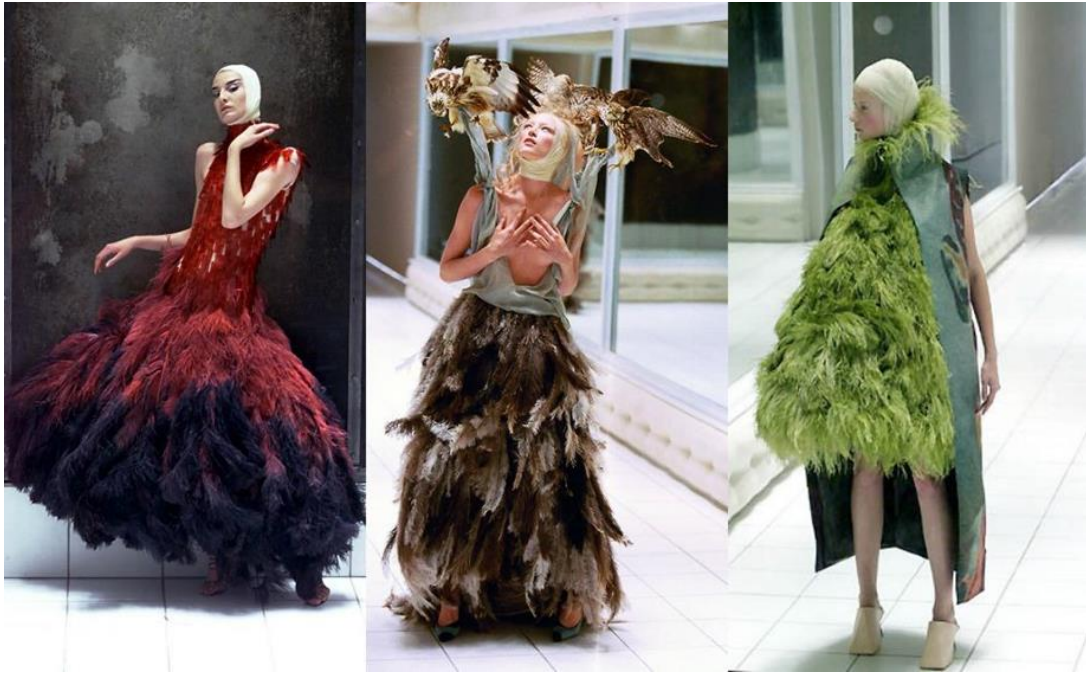
Figura 3-9: Trajes de la colección Voss, Primavera/Verano, 2001

Diciembre 9 de 2018