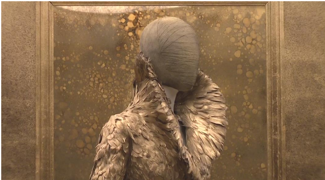
Figura 2-6: Traje de ensamble de la colección Otoño/Invierno 2010