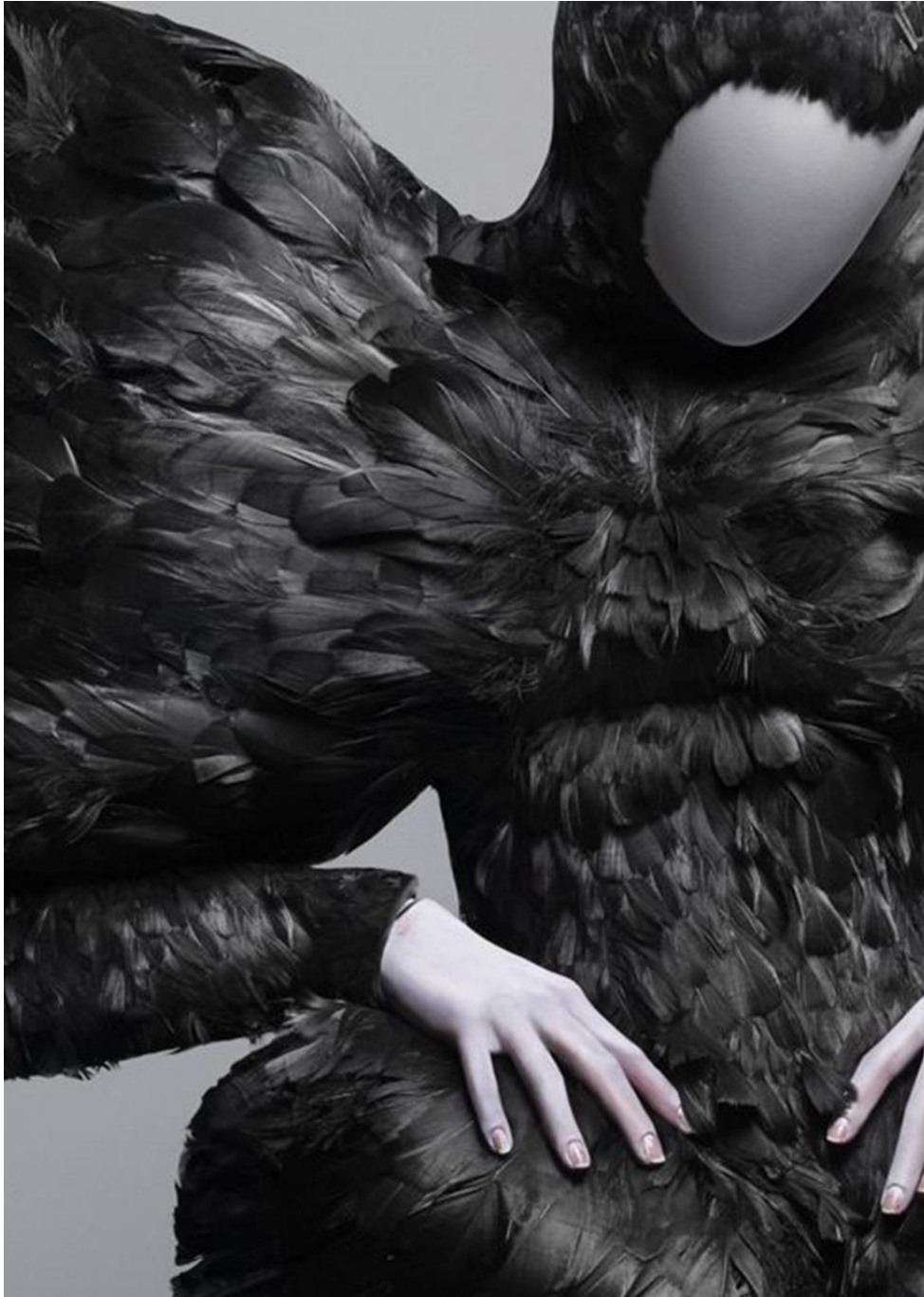
Figura 3-2: Traje Black duck feathers de la colección The horn of plenty, Otoño/Invierno 2009/2010