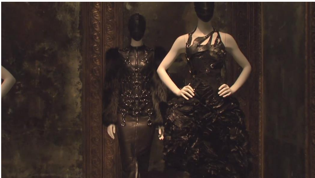
Figura 2-4: Trajes de la colección Otoño/Invierno 2002, expuestos en el Museo V&A de Londres.

Tomado de: https://www.metmuseum.org/metmedia/video/collections/ci/mcqueen-savage-beauty . 25 de febrero de 2019.