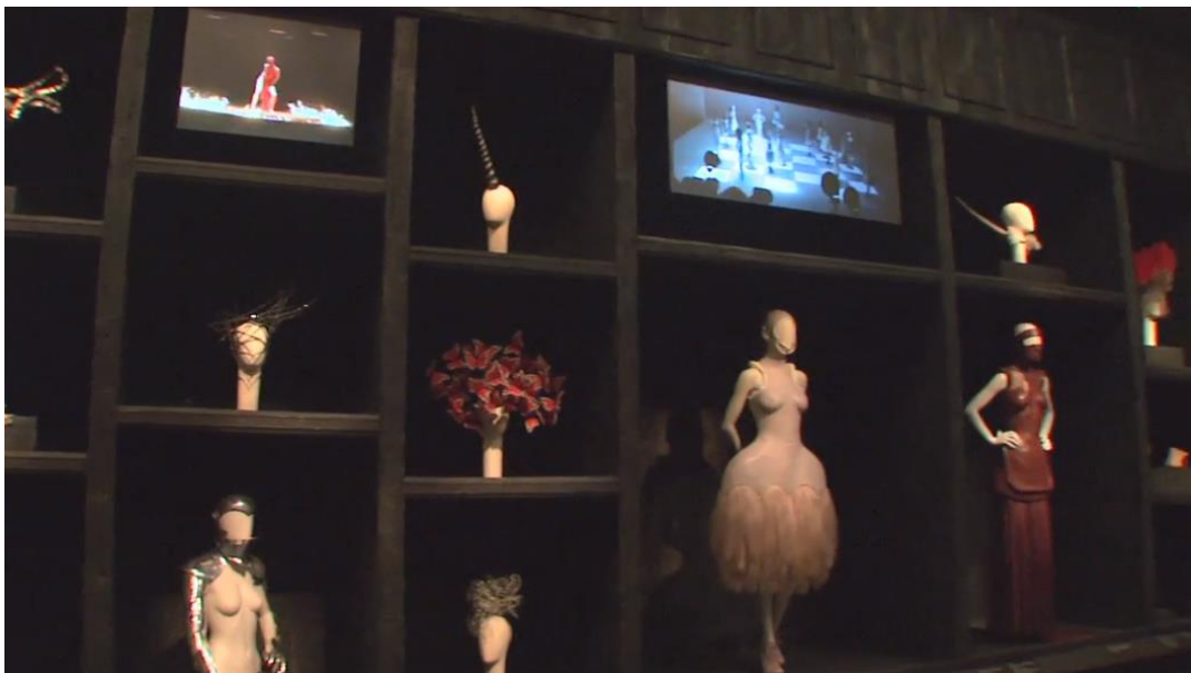
Figura 2-9: El gabinete de Curiosidades de la exposición Savage Beauty del Met 2011.