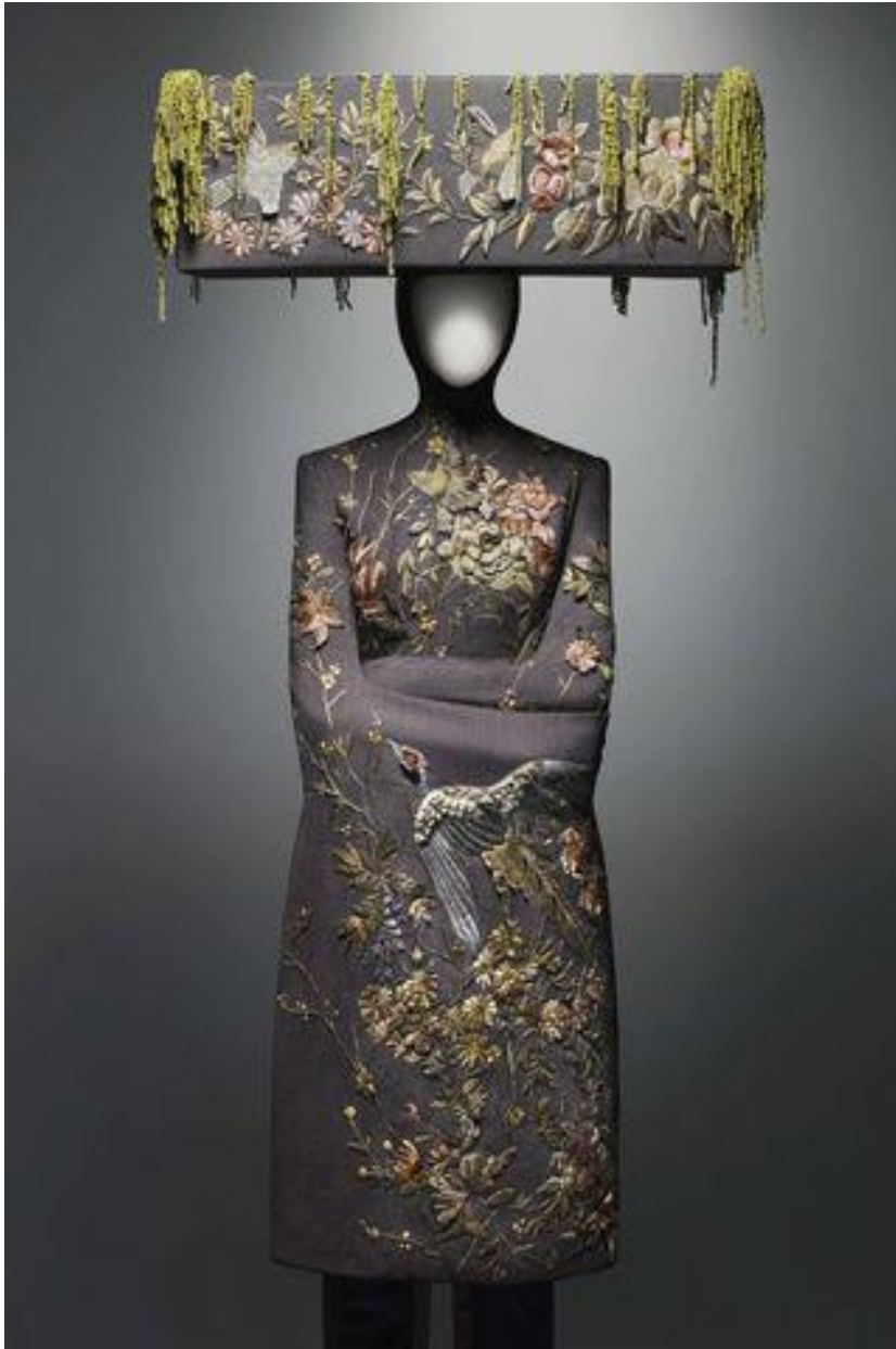
Figura 3-15: Vestido: Ensemble. Chaqueta de ojo de ave rosa y gris bordada con hilo de seda; Pantalón de pajarita rosa y gris; Sombrero de ave rosa y gris bordado con hilo de seda y decorado con amaranto) Colección: Voss, spring/summer 2001 (Voss, primavera/verano 2001) Serie: Romantic Exoticism (Romántico Exótico)

Tomado de: Alexander McQueen: Savage Beauty, p. 131. Noviembre de 2018