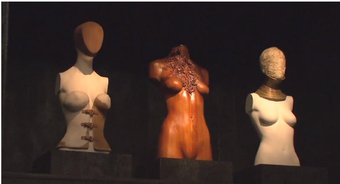
Figura 2-13: El gabinete de Curiosidades de la exposición Savage Beauty del Met 2011.

Tomado de: https://www.metmuseum.org/metmedia/video/collections/ci/mcqueen-savage-beauty . 25 de febrero de 2019.