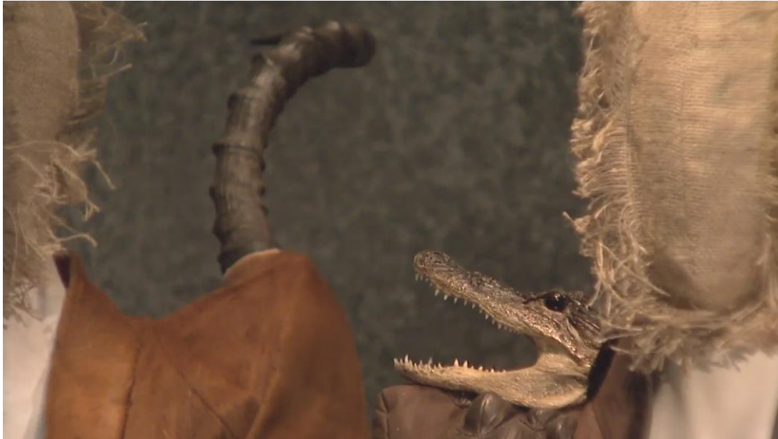
Figura 2-25: Trajes de la sala Primitivismo Romántico de la exposición Savage Beauty del Met 2011