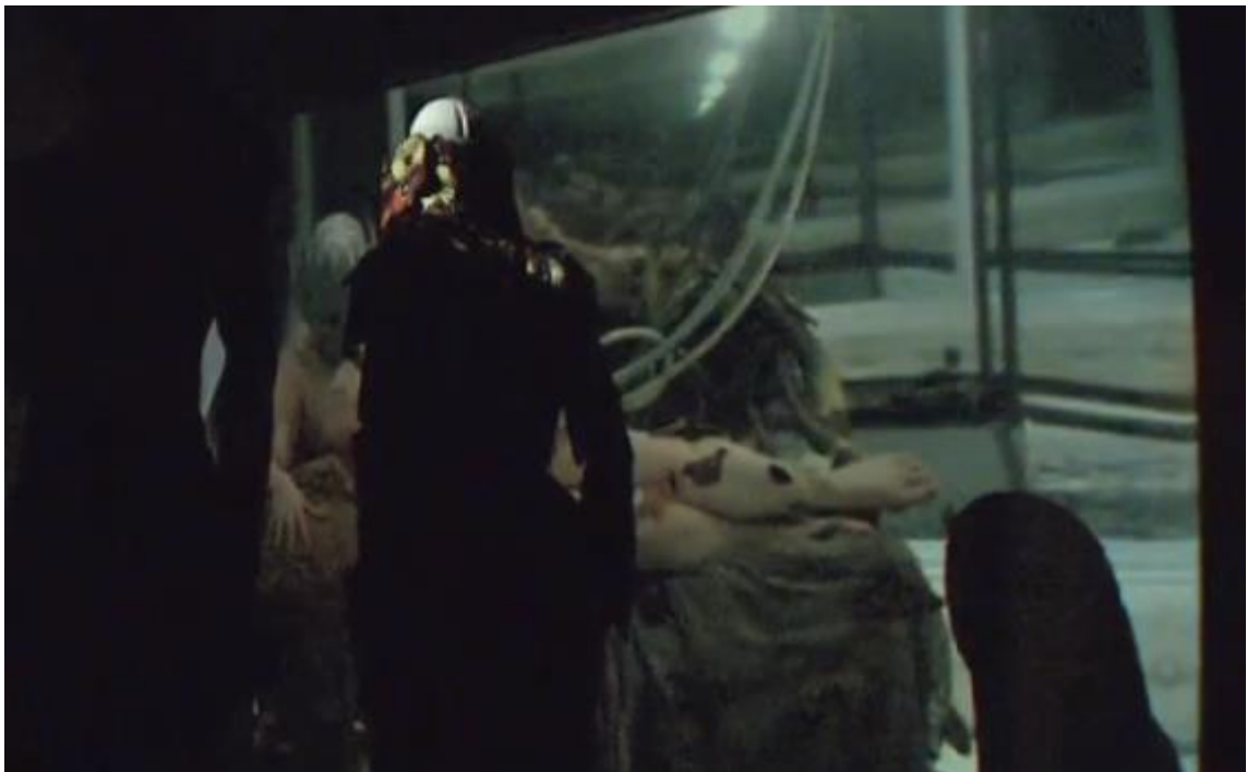
Figura 2-19: Performance final de la colección Voss Primavera/Verano 2000