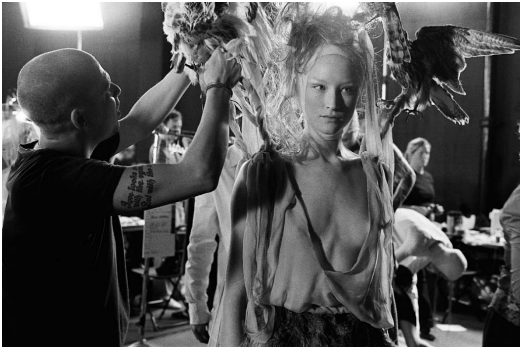
Figura 3-10: Detrás de cámaras de la colección Voss, Primavera/Verano, 2001

Tomado de la página web: https://vibenye.wordpress.com/2014/10/20/alexander-mcqueen-voss/ . Diciembre 9 de 2018