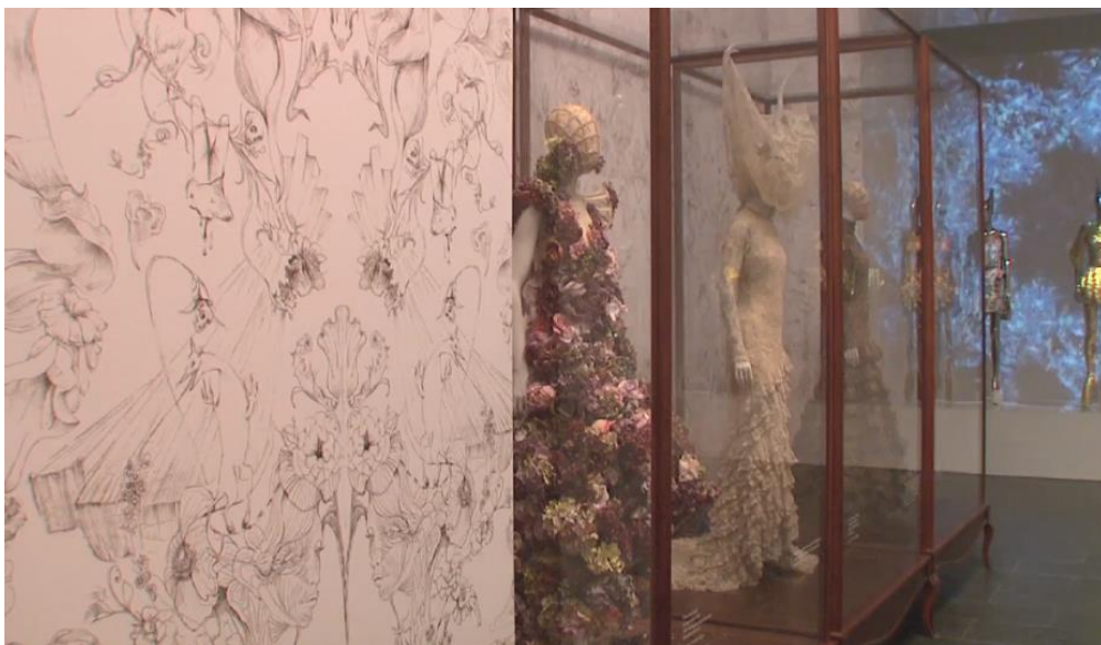
Figura 2-27: Vitrina de la sala Naturalismo romántico de la exposición Savage Beauty del Met 2011

Tomado de: https://www.metmuseum.org/metmedia/video/collections/ci/mcqueen-savage-beauty . 25 de febrero de 2019.