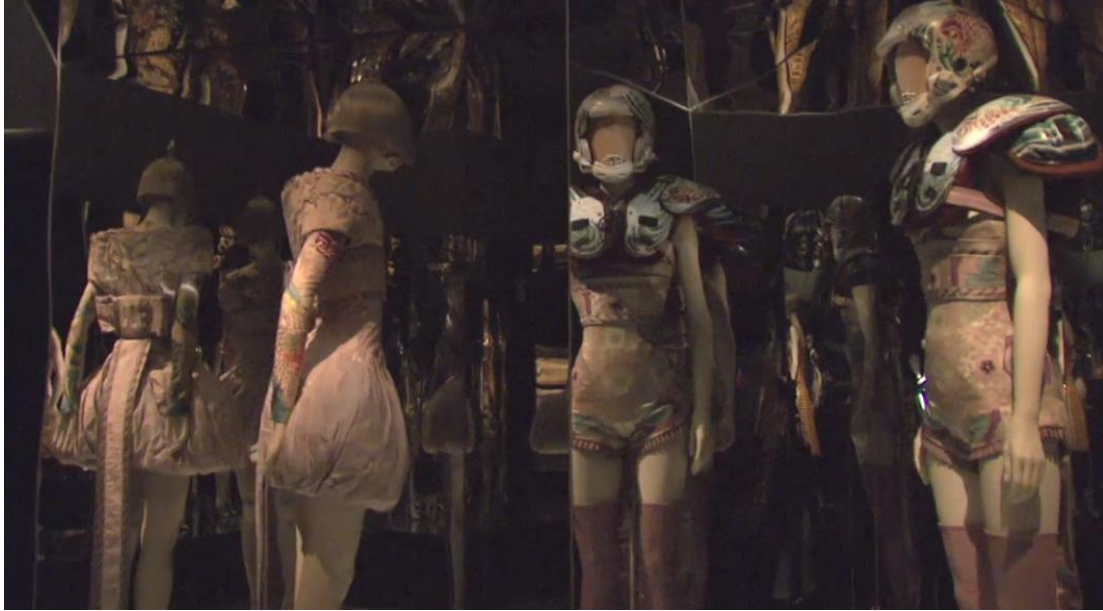
Figura 2-20: Trajes de la colección: Es sólo un juego, Primavera/Verano 2005, expuestos en la sala Exotismo Romántico de la exposición Savage Beauty del Met 2011