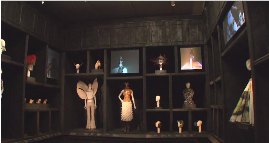
Figura 2-10: El gabinete de Curiosidades de la exposición Savage Beauty del Met 2011.

Tomado de: https://www.metmuseum.org/metmedia/video/collections/ci/mcqueen-savage-beauty . 25 de febrero de 2019.