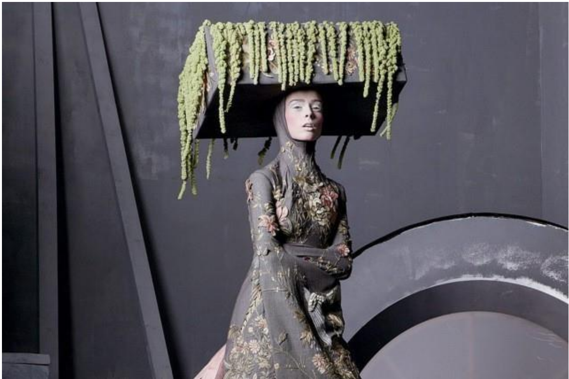
Figura 3-19: Fotografía para Revista Vogue 2011