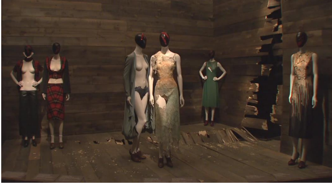
Figura 2-17: Sala La violación de las Tierras Altas de la exposición Savage Beauty del Met 2011

Tomado de: https://www.metmuseum.org/metmedia/video/collections/ci/mcqueen-savage-beauty . 25 de febrero de 2019.