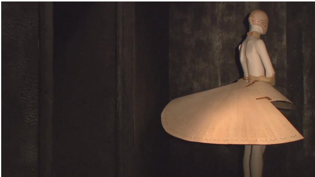
Figura 2-11: Traje de ensamble N° 13, colección Primavera/Verano 19999.

25 de febrero de 2019.