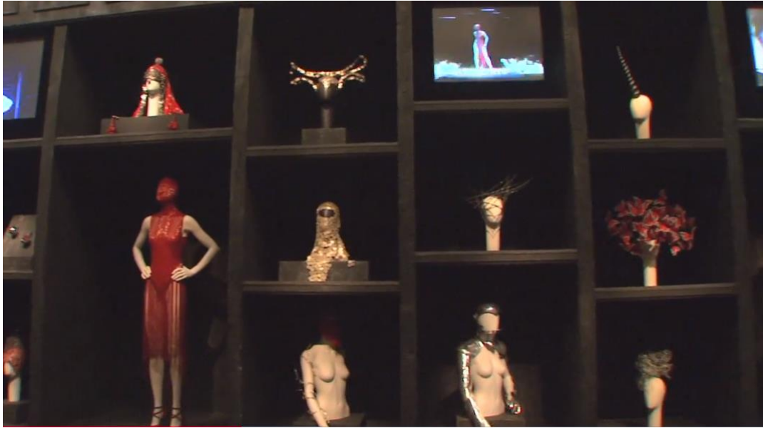
Figura 2-8: El gabinete de Curiosidades de la exposición Savage Beauty del Met 2011.

Tomado de: https://www.metmuseum.org/metmedia/video/collections/ci/mcqueen-savage-beauty . 25 de febrero de 2019.