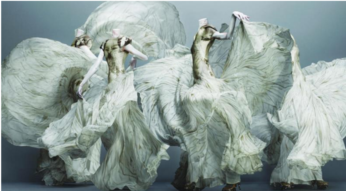
Figura 1-1: Trajes en seda de la colección Otoño/Invierno 2010.