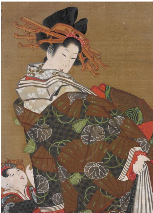
Figura 3-18: Pintura tradicional japonesa.

Tomado de: https://www.elattelier.com/prendas-con-historia-kimono/ 30 de marzo de 2019