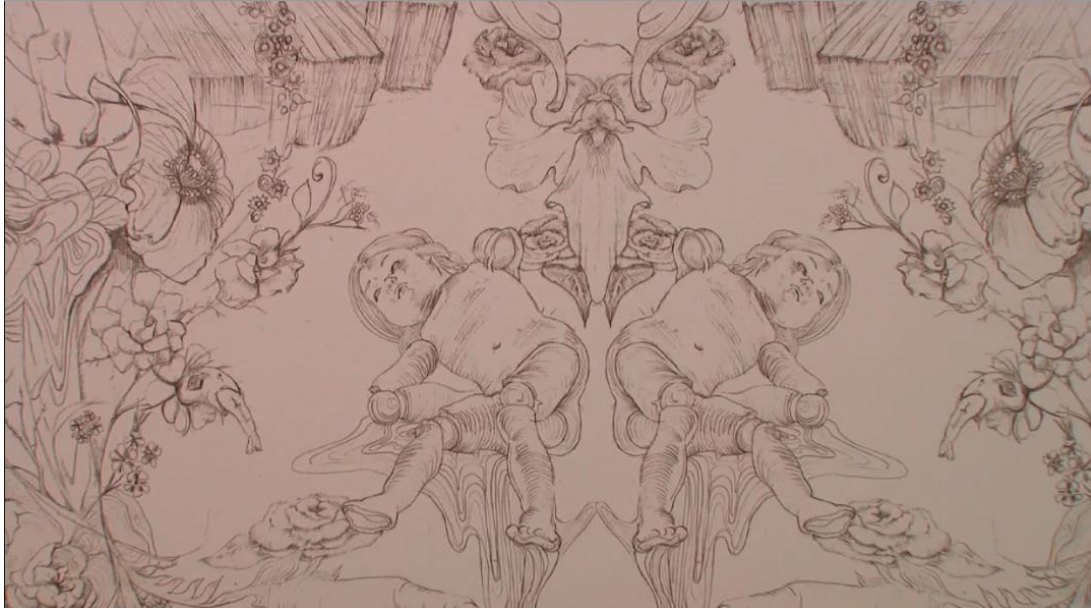
Figura 2-26: Ilustración del papel de colgadura diseñado por Alexander McQueen para la sala Naturalismo romántico de la exposición Savage Beauty del Met 2011

Tomado de: https://www.metmuseum.org/metmedia/video/collections/ci/mcqueen-savage-beauty . 25 de febrero de 2019.