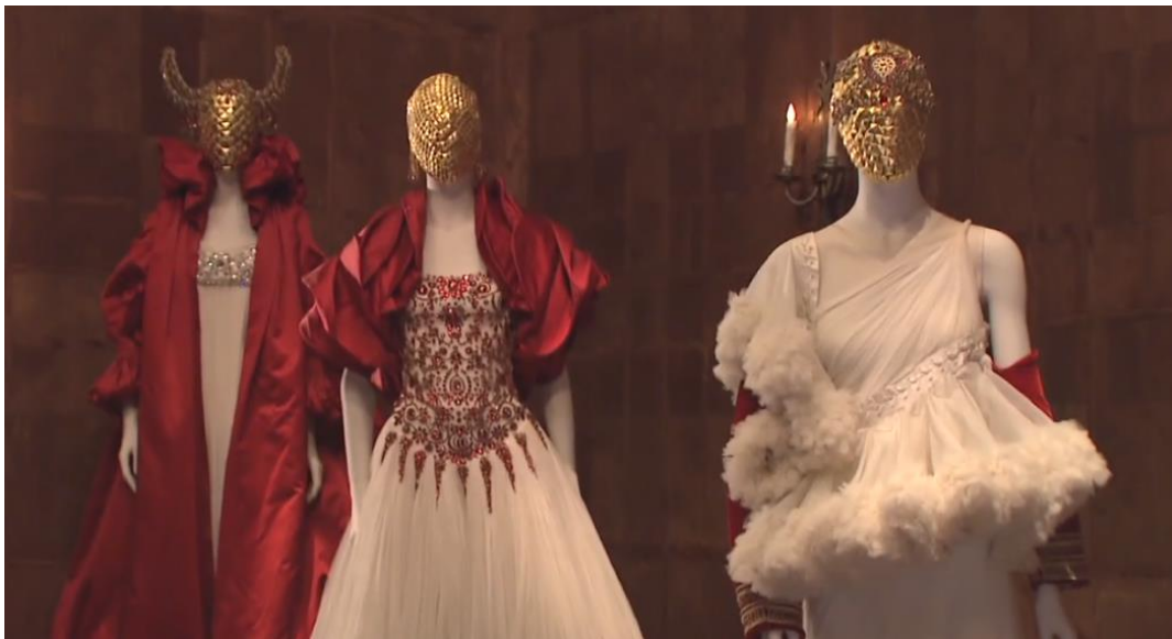
Figura 2-16: Sala Nacionalismo Romántico de la exposición Savage Beauty del Met 2011