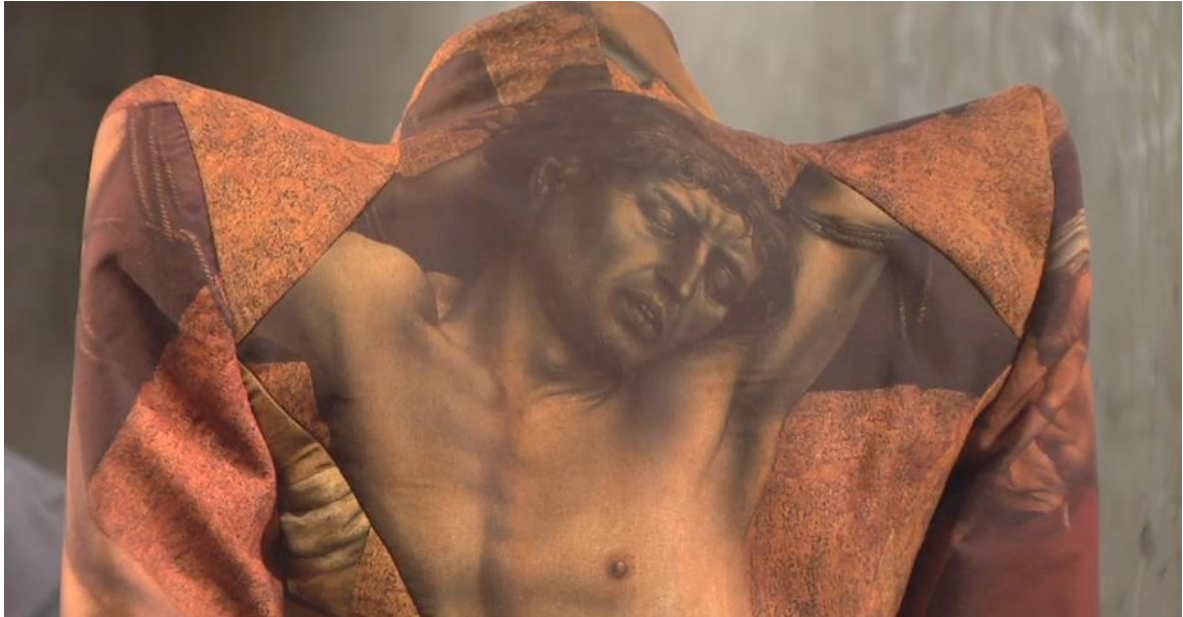
Figura 2-2: Chaqueta en seda con impresión de la obra: El ladrón a la izquierda de Cristo de Robert Campin, para la colección: Es una jungla allí afuera, Otoño/Invierno. 1998

Tomado de: https://www.metmuseum.org/metmedia/video/collections/ci/mcqueen-savage-beauty . 25 de febrero de 2019.