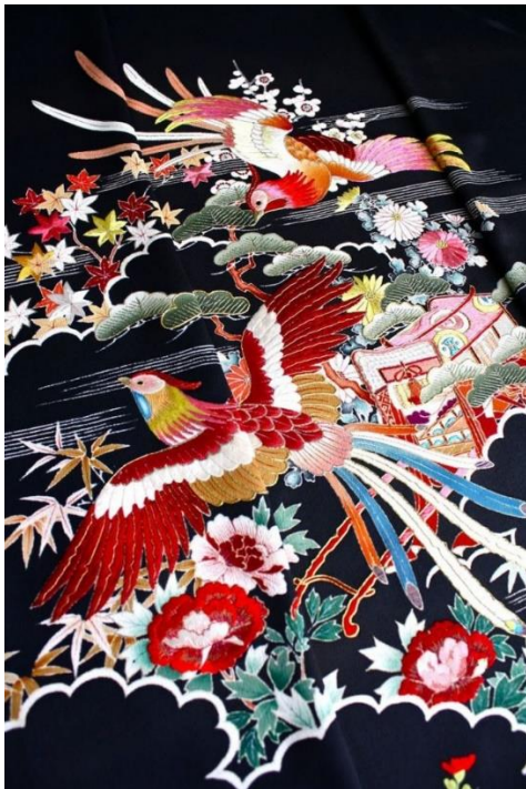
Figura 3-17: Fotografía de un bordado tradicional japonés.

Tomado de: https://www.elattelier.com/prendas-con-historia-kimono/ 30 de marzo de 2019