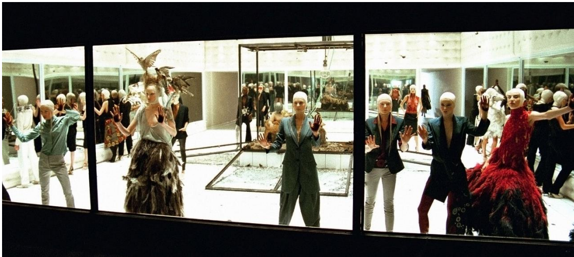
Figura 3-8: Desfile de la colección Voss, Primavera/Verano, 2001

Tomado de: https://www.metmuseum.org/metmedia/video/collections/ci/mcqueen-savage-beauty . 25 de febrero de 2019.