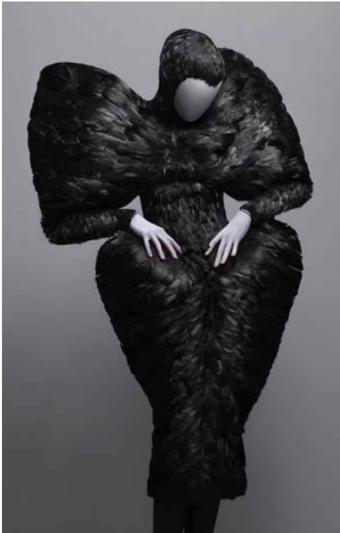
Figura 3-1: Traje Black duck feathers de la colección The horn of plenty (El cuerno de la abundancia), Otoño/Invierno 2009/2010. Serie: Romantic Gothic (Romántico Gótico).