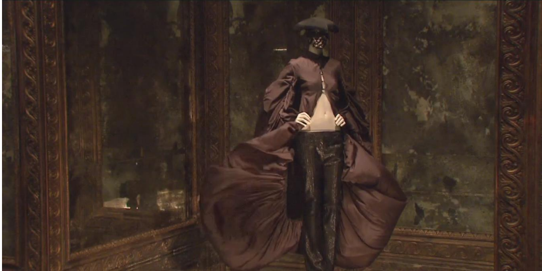
Figura 2-3: Traje de ensamble Supercalifragilisticexpialidocious, Otoño/Invierno 2002, expuesto en el Museo V&A de Londres.