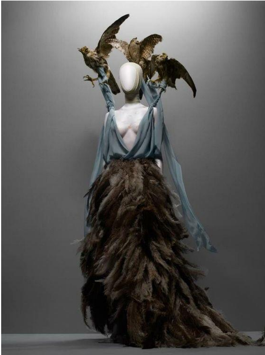
Figura 3-6: Vestido: Taxidermy Hawks. Shirt of light blue silk, skirt of ostrich feathers, taxidermy hawks. (Camisa de seda azul claro, falda de plumas de avestruz, taxidermia halcones.) Colección: Voss, spring/summer 2001 (Voss, primavera/verano 2001) Serie: Romantic Exoticism (Romántico Exótico)

Tomado de: Alexander McQueen: Savage Beauty, p. 143. Noviembre de 2018