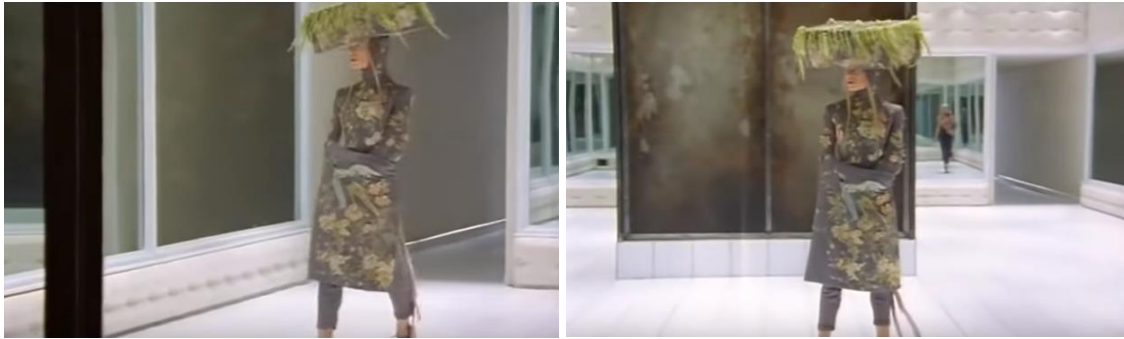
Figura 3-20: Imágenes del desfile de la colección Voss, Primavera/Verano 2001