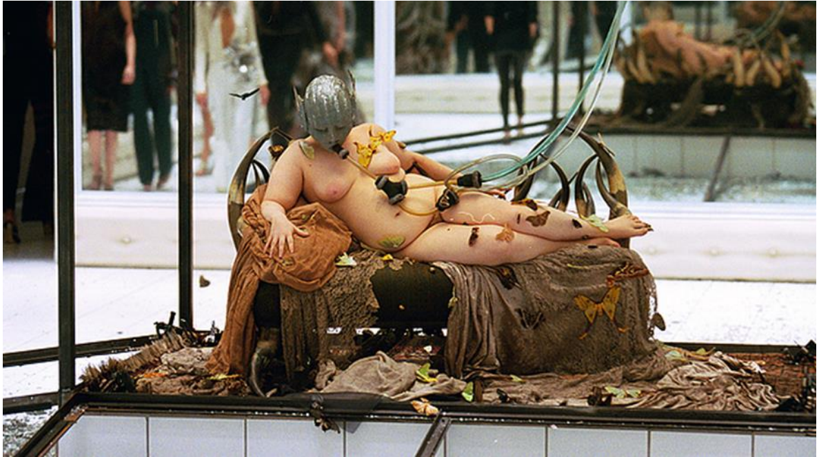
Figura 3-7: Performance de cierre de la colección Voss, Primavera/Verano, 2001, toma como referencia la fotografía: “Sanatorium” de Joel Peter Witkin.

Tomado de la página web: https://vibenye.wordpress.com/2014/10/20/alexander-mcqueen-voss/ . Diciembre 9 de 2018