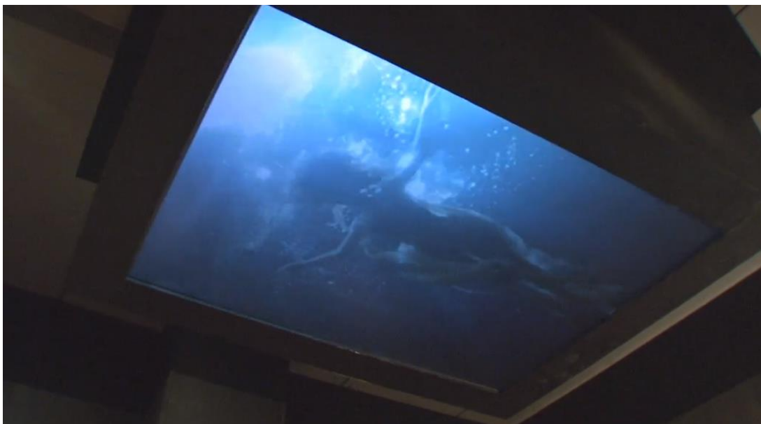
Figura 2-24: Instalación de video en sala primitivismo romántico de la exposición Savage Beauty en el Met 2011