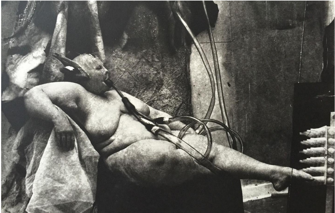
Figura 3-11: Fotografía “Sanatorium” de Joel Peter Witkin, 1983.