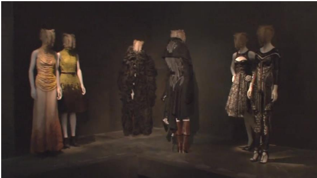
Figura 2-22: Sala primitivismo romántico de la exposición Savage Beauty en el Met 2011