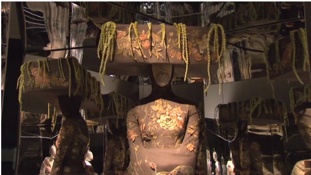
Figura 2-21: Traje de la colección Voss, Primavera/Verano 2001, expuesto en la sala Exotismo Romántico de la exposición Savage Beauty del Met 2011