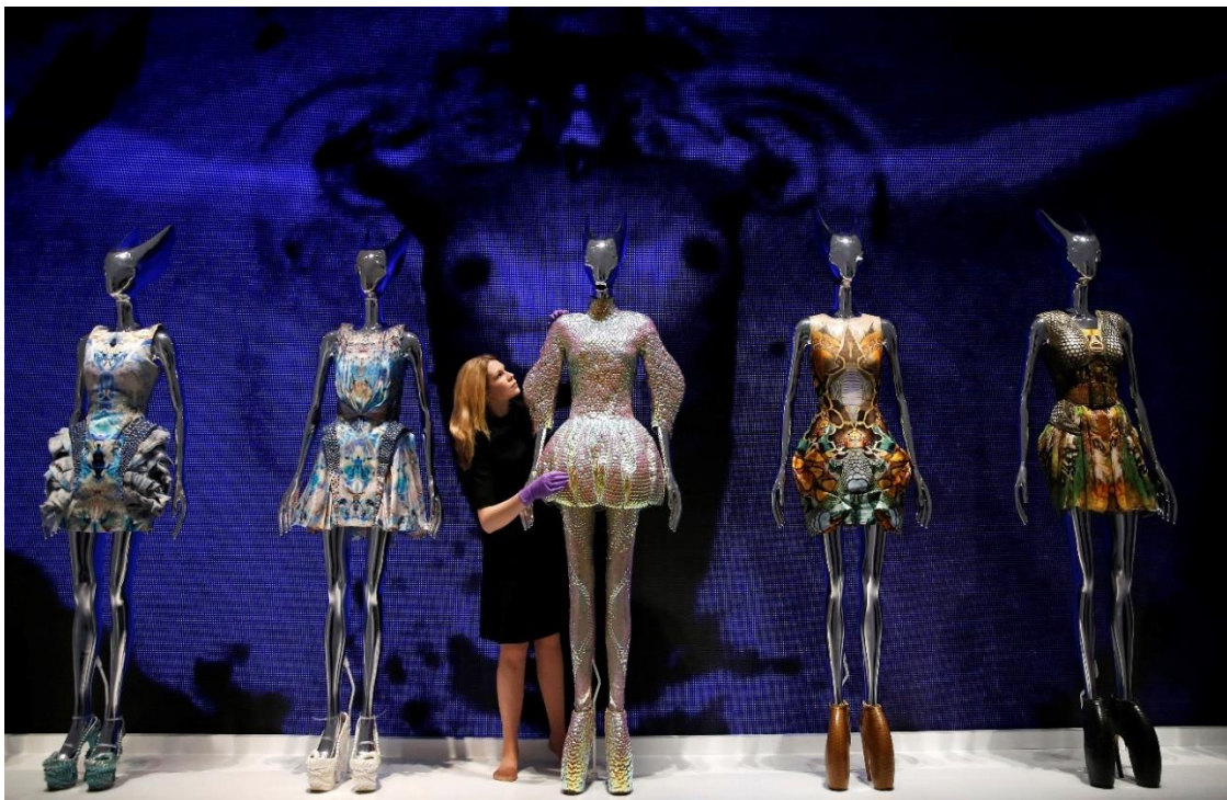
Figura 2-30: Sala Plato's Atlantis de la exposición Savage Beauty del Met 2011