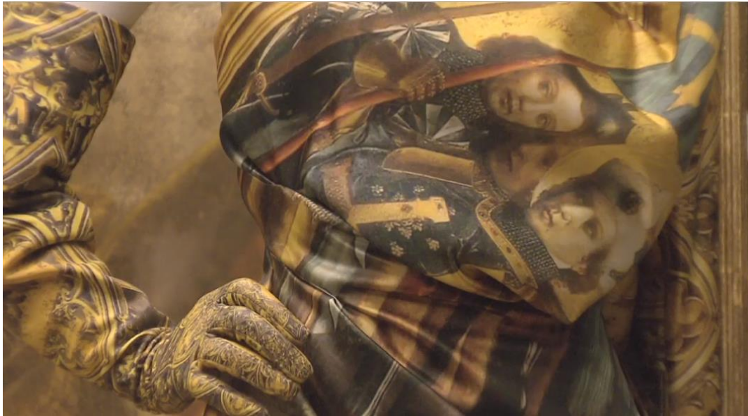
Figura 2-7: Traje de ensamble de la colección Otoño/Invierno 2010