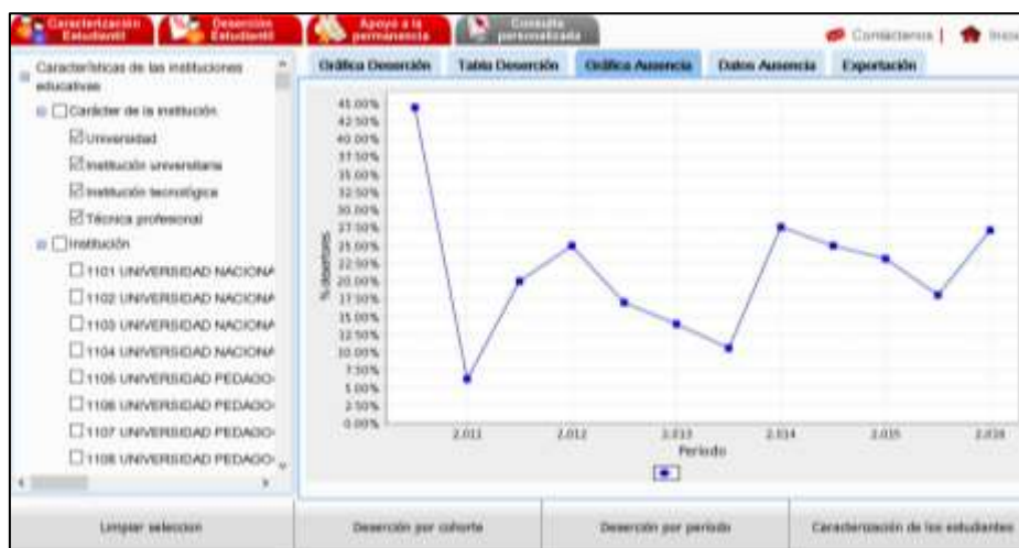
Figura 2. Ausencia del Programa Licenciatura en Artes Plásticas y Visuales

mediados de 2014 donde repunta desde el 8% hasta un 27,50% para 2016, este comportamiento es similar al que se mostro en la figura 1: