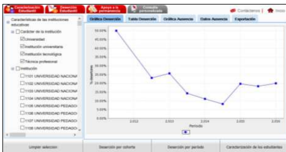
Figura N° 1. Gráfica de deserción del programa Licenciatura en Artes Plásticas y Visuales

La figura 1 muestra un comportamiento a la baja de la deserción en el programa, por lo menos hasta mediados del año 2014 momento en el cual se ubica por debajo del 10%, para posteriormente repuntar a cifras que promedian el 20% en los años 2015 y 2016.