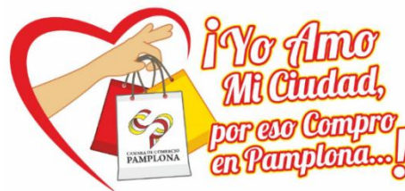
Figura. 3 Diseño Yo amo mi ciudad por eso compro en pamplona

Planear, coordinar, ejecutar y controlar todas las actividades tendientes al desarrollo de actividades que propendan por la Promoción y Fortalecimiento del Sector Empresarial, con el fin de fomentar y fortalecer las compras locales se toma la iniciativa de emprender una nueva campaña la cual da identidad al sentido de pertenencia de los compradores con su ciudad a la hora de elegir en donde comprar y complacer sus necesidades en las diferentes temporadas altas, esta intención es lograr captar la atención de los transeúntes con la imagen que se desarrolló para el impulso de la misma, se realizó la visita a los establecimientos afiliados y matriculados en la CCP con el fin de hacerles entrega y darle ubicación al aviso promocional, seguido de la ubicación en los establecimiento se continuo con la ubicación de pasacalles en las vías principales de la ciudad para lograr tener mayor impacto en la ciudadanía, como recomendación los establecimiento tienen el compromiso de tener visible siempre el aviso en sus locales en temporadas altas o durante el transcurso del año.