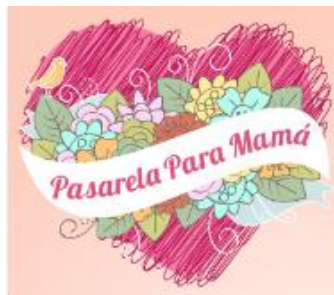
Figura. 2 Diseño Pasarela para Mamá

Aplicación y tabulación de encuestas de los eventos realizados por el departamento de Promoción y desarrollo de la Cámara de Comercio de Pamplona, pasada la actividad nos encargamos de visitar a los establecimientos de los participantes y solicitar el diligenciamiento de las mismas posteriormente se tabulo y el resultado nos cuenta que el evento tuvo gran aceptación por los participantes ya que fue un impulso publicitario para su establecimiento, como recomendación solicitaron el cambio de localidad y fechas para próximas realizaciones.