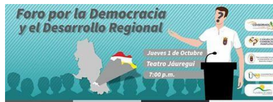
Figura 15. Diseño Foro por la democracia y el desarrollo regional.

Llegado el día del evento se realizó el adecua miento del teatro para llevar a cabo la actividad, ubicación de las mesas de los candidatos a la alcaldía, y mesas de registro en la entrada del establecimiento, con el apoyo de estudiante de la Universidad de Pamplona se realizó el registro de todos los asistentes y encargados de la ubicación de las personas procedieron a dar paso a que cada partido político tomara asiento, se dio inicio a las 6:30pm y dio clausura a las 10:00pm con gran participación de las avanzadas políticas y de la ciudadanía interesada en conocer sobre los candidatos.