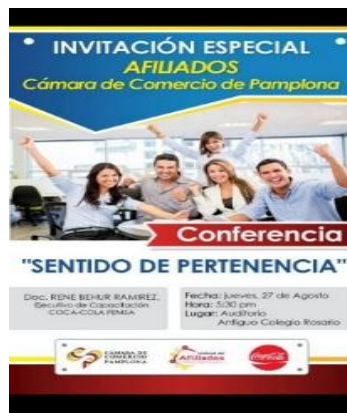
Figura 11. Diseño Conferencia Sentido de pertenencia.

Registro de participantes asistentes a las actividades realizadas, yo junto con un auxiliar realizamos el registro de los asistentes, dando así el ingreso y ubicación a la actividad la cual dio inicio a las 6:30 y se dio clausura a las 9:30, obteniendo resultados satisfactorios con los asistentes y sus equipos de trabajo se contó con gran afluencia de personas, cerrado como un evento exitoso y fructífero.