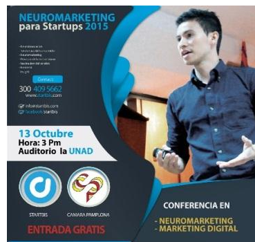
Figura 16. Diseño Conferencia Neuromarketing.

Se convocaron los inscritos en el programa de alianzas para la innovación para darle paso a la socialización del inicio del programa de alianzas para la innovación, se tomó la decisión de llevar invitados que les hablaran a los participantes acerca de dos temáticas las cuales pueden nutrir sus negocios por medio del buen uso de la tecnología son estudiantes de la Universidad de Pamplona los cuales cuentan con una empresa dedicada al desarrollo de emprendimiento digital, se logró el contacto con ellos y contando ya con la participación se procedió a solicitar el préstamo del auditorio de la institución UNAD para realizar la reunión, con un mes de anterioridad se llevó a cabo la organización y se confirmó la participación de los asistentes, el día del evento se realizó la ubicación de la mesa de registro para lograr tener un control de las personas las cuales iban a continuar con todo el proceso del programa, la actividad se realizó de 2:00pm y dio clausura a las 5:00pm, el cual inició con la presentación de los dos jóvenes conferencistas, se tomó un receso y unas onces brindadas por la CCP seguido se dio la continuidad de la programación estipulada.