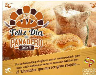
Figura 6. Diseño Día del panadero

entregado a las panaderías que serían visitadas, posteriormente se redactaron las cartas de felicitación por la labor realizada con tanta tradición, durante dos días fueron entregados los reconocimientos a los diferentes establecimientos, se solicitó la autorización para tener acceso a las áreas de trabajo y tener tomas fotográficas con el objetivo de impulsar y promocionar las panaderías en la página web y grupo de Facebook de la CCP.