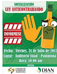
Figura 8. Diseño Socialización Ley anti contrabando

con la participación de todo comerciante interesado en ampliar y resolver dudas sobre la Ley, se solicitó la autorización para el prestamos del auditorio de la UNAD contando así con el espacio para el desarrollo de la misma, se realizó registro de los asistentes a la socialización.