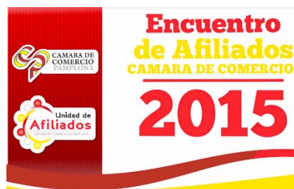
Figura 5. Diseño Encuentro de afiliados Cámara de comercio

Apoyo en ambientación de escenarios utilizados para los programas, eventos, capacitaciones, ferias empresariales y reuniones requeridas, se realizó la adecuación del lugar el evento en el Hostal 1549 colonial, durante el evento nos acompañó una agrupación local de Jazz, con la presencia de los medios de la ciudad, durante el desarrollo del evento se dieron reconocimientos anuales como es de costumbre a los empresarios que sobresalen en la trayectoria comercial en la ciudad dándose inicio a las 6:30pm a 10:00pm, manteniendo la unión entre la entidad y los empresarios afiliados.