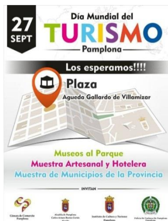
Figura 14. Diseño Día mundial del turismo.

El día del evento la logística empezó actividades a las 6:00am ubicando mesas y sillas y avisos de los diferentes participantes, el apoyo de logística fue el encargado de dirigir y organizar a los empresarios y emprendedores en su llegada, la actividad dio inicio a las 9:30am y dio clausura a las 6:00pm contando con una gran participación de la comunidad y grandes resultados para los expositores, se realizó el diligenciamiento de encuestas a los participantes expositores y los visitantes para poder lograr un mejor análisis del evento, se realizó la tabulación y se presentó el informe a presidencia ejecutiva.