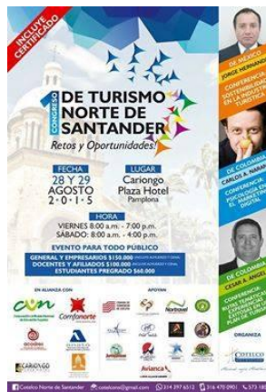
Figura 12. Diseño Congreso de turismo Norte de Santander.

La CCP como apoyo a la actividad estuvo encargada de la mesa de registro de los asistentes y del diseño de las escarapelas y diplomas de certificación a los asistentes, por lo cual se contactó a la empresa de diseño para plantear el diseño, con un mes de anterioridad se logró la entrega de la solicitud, el equipo de promoción y desarrollo estuvo a la cabeza de la mesa de registro dando así la bienvenida a los participantes, tomando registro inicial durante los 2 días de ejecución del congreso.