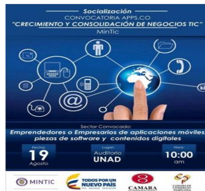
Figura 9. Diseño Socialización Apps.co

Programar las capacitaciones y seminarios para empresarios y comunidad en los temas que se requiera, con el fin de impulsar las nuevas iniciativas tecnológicas de la población interesada en la ciudad de Pamplona, se realizó la socialización con el apoyo de la Cámara de Comercio de Bucaramanga y el Ministerio TIC, se inició con el filtro de la base de datos empresas registradas y que su actividad económica sea el impulso de las herramientas tecnológicas o nuevas ideas que quieran ser desarrolladas por medios de proyectos de impulso como este, se realizaron las llamadas y la difusión por medios virtuales durante una semana.