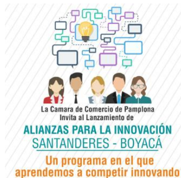
Figura. 4 Diseño Alianzas para la innovación

Registro de participantes asistentes al ingreso de la actividad en formato de asistencia de la CCP, seguido se dio paso a la ubicación de los asistentes e inicio del evento, programada una pausa en el itinerario se dirigió a los asistentes a una media mañana organizada por la CCP, la duración del evento fue 8:00am 12:00m.