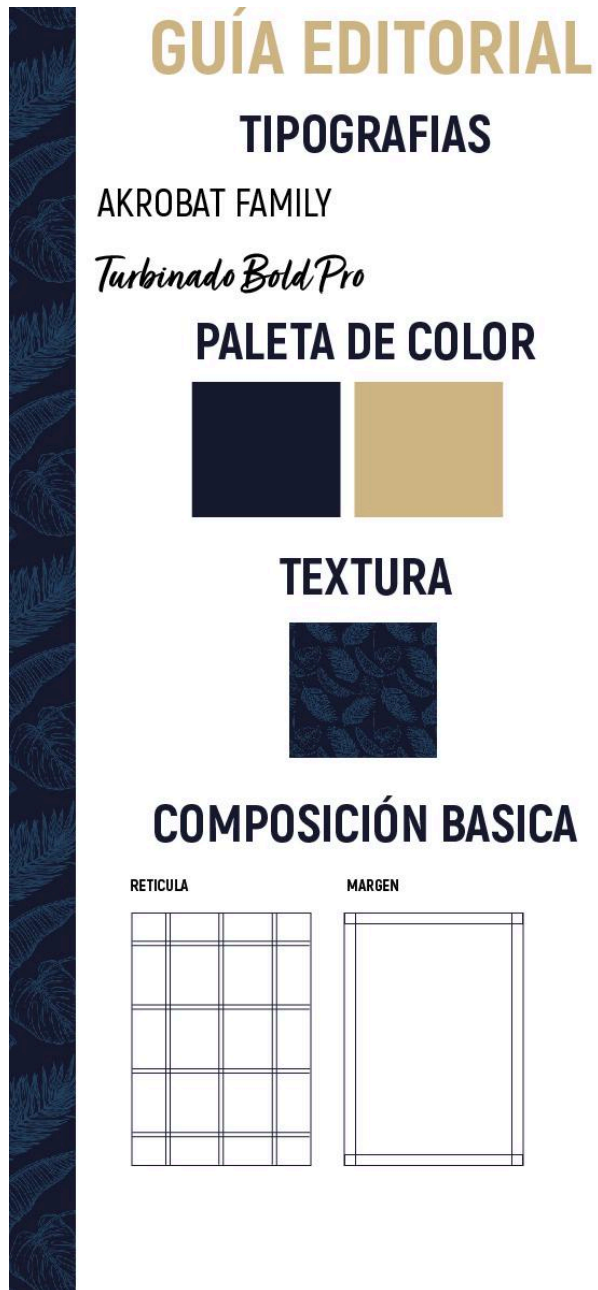
Figura 4: prototipo #1 Multivacaciones