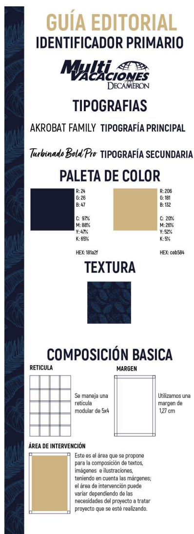
Figura 8: prototipo #2 Multivacaciones