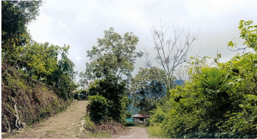
Fuente: Carretera rural San Vicente de Chucuri. Fotografía tomada por el autor, noviembre 2024

Por otro lado, en virtud de la ratificación de la Convención sobre la Eliminación de todas las formas de Discriminación contra la Mujer (CEDAW), por parte de los países latinoamericanos ha surgido la necesidad de generar políticas públicas con perspectiva de género y orientada específicamente a materializar los derechos de las mujeres rurales. A fin de dar cumplimiento en lo pactado en el artículo segundo de la convención países como Bolivia, Brasil, Ecuador y Paraguay han avanzado estableciendo protecciones específicas para los derechos de las mujeres rurales dentro de sus constituciones: