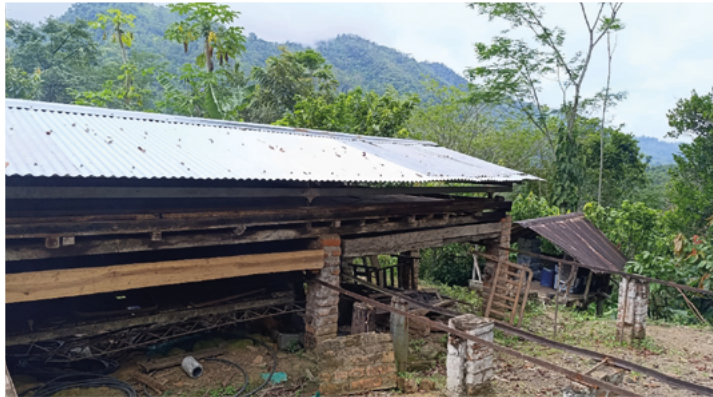
Fuente: Finca con alba con cacao San Vicente de Chucuri. Fotografía tomada por el autor, noviembre 2024

Programa de Acceso Especial para las Mujeres: Programa impulsado por la Unidad de Restitución de Tierras, que nace como una acción afirmativa encauzada a lograr que las mujeres rurales tengan una participación efectiva en los procesos de restitución de tierras de los que ellas hagan parte como víctimas del conflicto armado interno, siguiendo las disposiciones de la Ley 1448 de 2011 (Consejo Directivo Unidad Administrativa Especial de Gestión de Restitución de Tierras Despojadas, 2024).