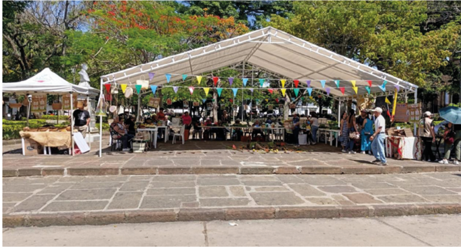
Fuente: Plaza pública de San Gil. Fotografía tomada por el autor, marzo 2025.