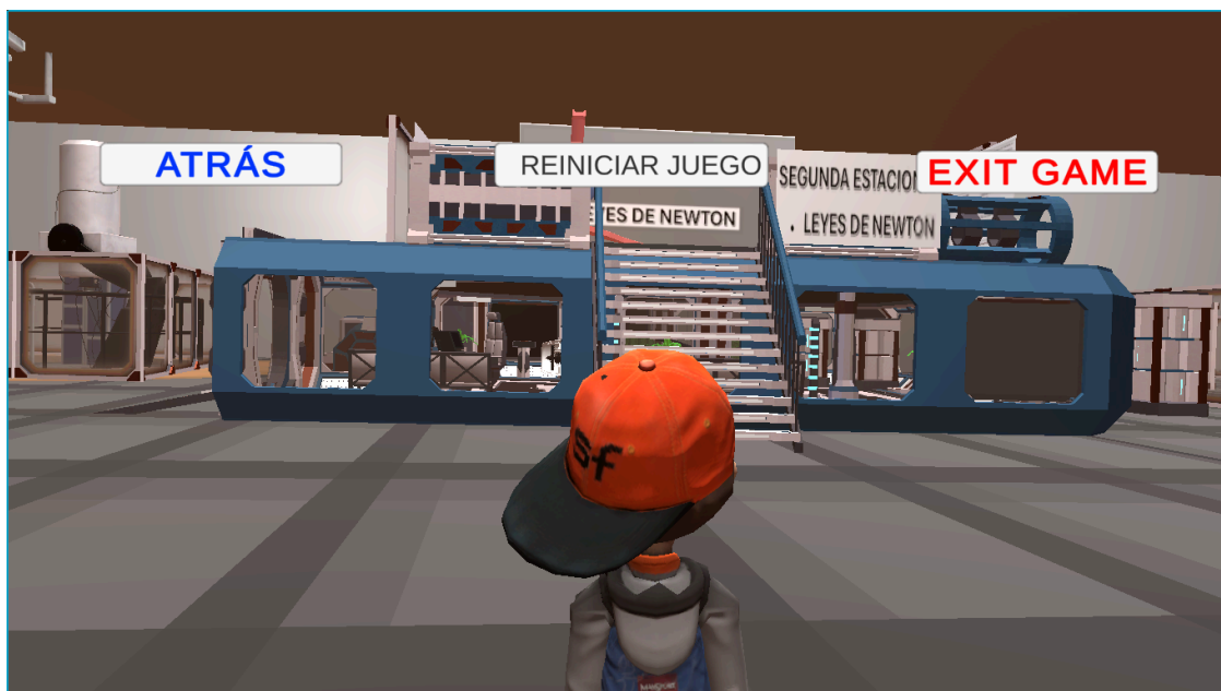
Imagen 3: laboratorio de física para computadores