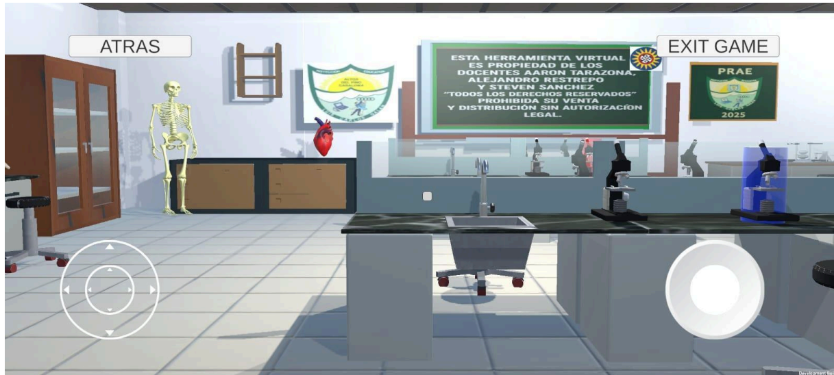
Imagen 2: laboratorio de biología y química para android y dispositivos móviles

Fuente: Steven Sánchez. (2025). laboratorio de ciencias naturales