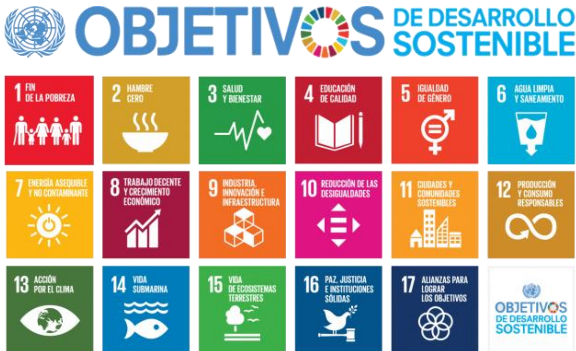
Figura 2. Objetivos de Desarrollo Sostenible. Tomado de las Naciones Unidas.