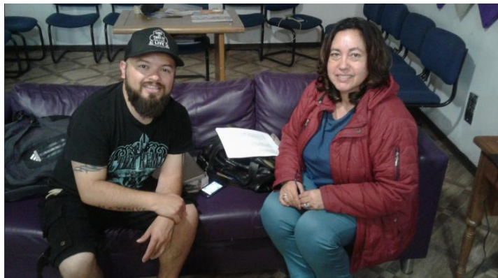
Imagen 5 – Observando la realización del Programa Ondas de la Mañana 12 de julio de 2017