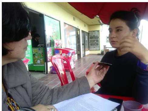
Imagen 9 - Dialogando con practicantes de la emisora Suba al Aire 18 de marzo de 2018