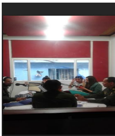
Imagen 6 - Equipo de trabajo de Suba Somos Todos 18 de julio de 2017