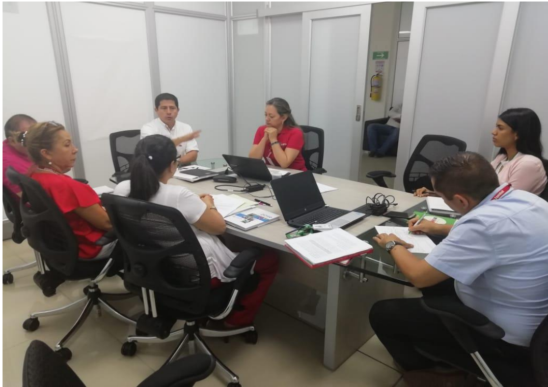
Anexo 1. Socialización Trimestral de avances de las Políticas Públicas.