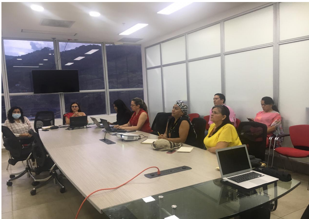
Anexo 2. Mesa DESCA (Derechos económicos, sociales, culturales y ambientales).