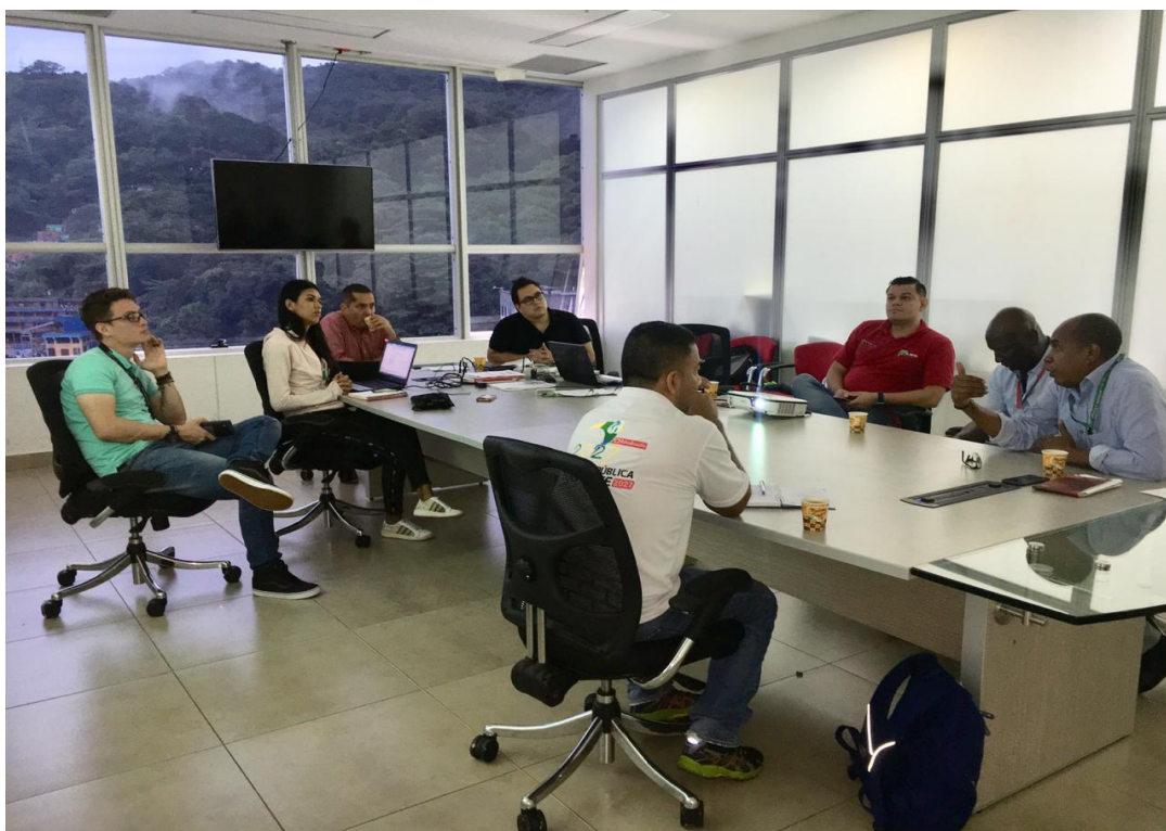
Anexo 3. Mesa mensual de trabajo con la secretaria social e IDERMETA.