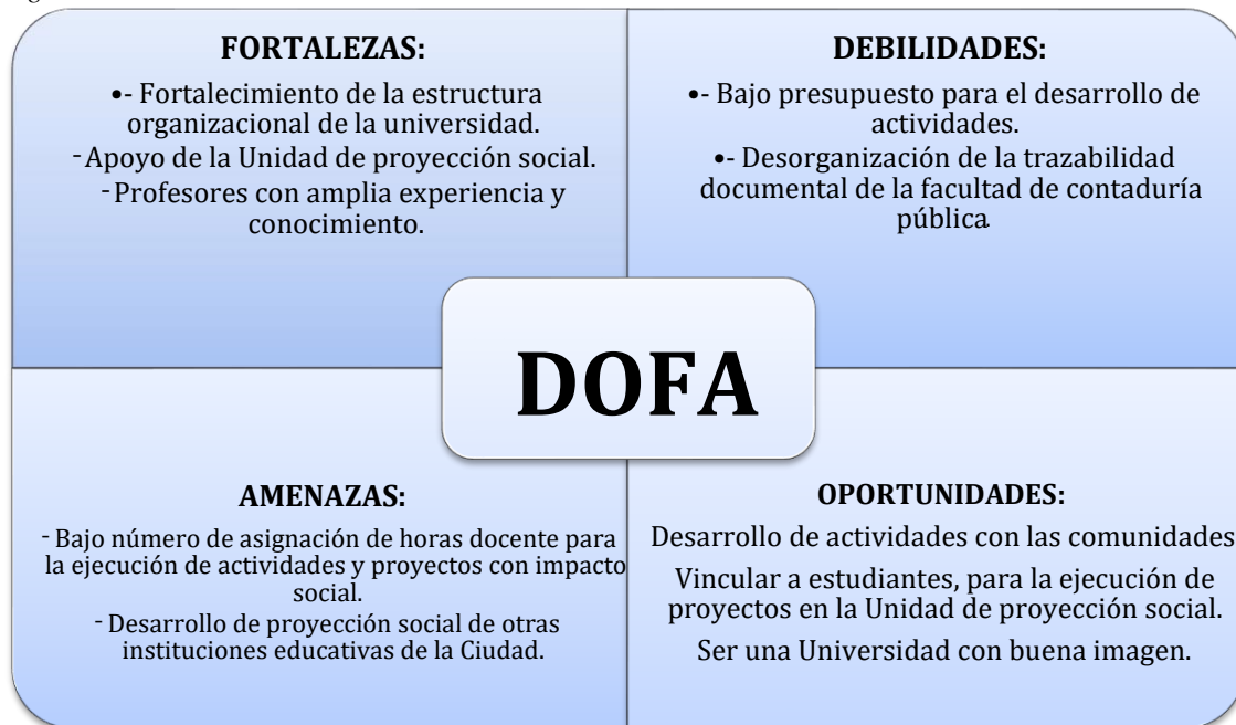
Figura 1. Matriz DOFA.

Análisis DOFA de aprendizajes, logros alcanzados, reflexión de la práctica utilizando la matriz DOFA.