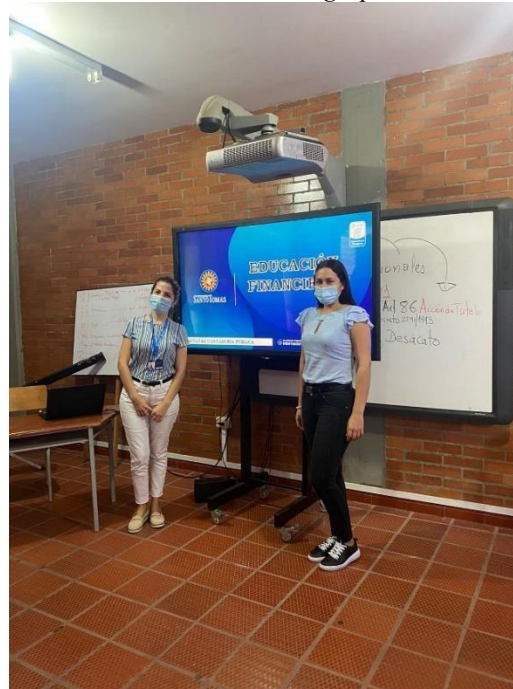
Figura 3. Capacitación “Educación Financiera”, Institución Agropecuaria Guacavía.

Nota: información suministrada al sistema de la unidad de proyección social de la Facultad de Contaduría Pública.