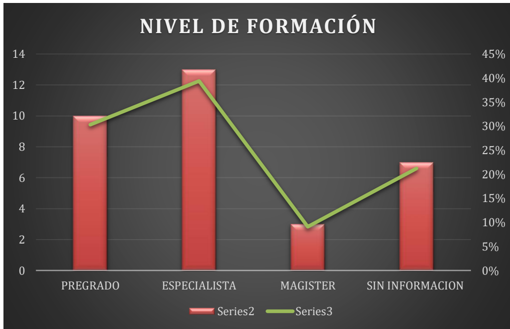
Figura 2. Nivel de formación de los directores Entes deportivos Departamentales EDD

En la figura 2 encontramos los niveles de formación los cuales arrojaron que el 30% tienen título profesional pregrado, el 40% tiene posgrado título especialista y el 10% tiene maestría, el 20% no tienen información de su nivel académico.