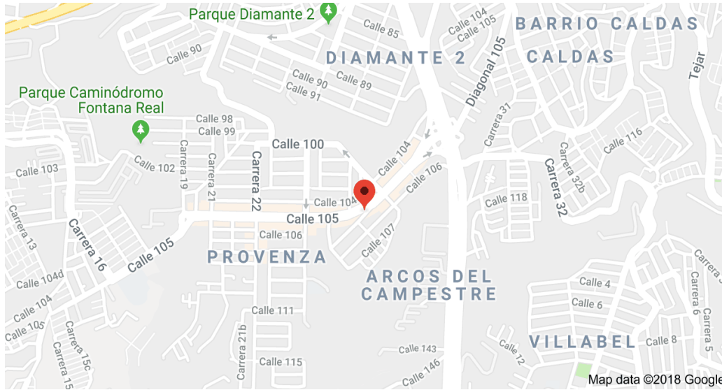
Nota: Figura 1 Ubicación fundación educativa Conciencia.