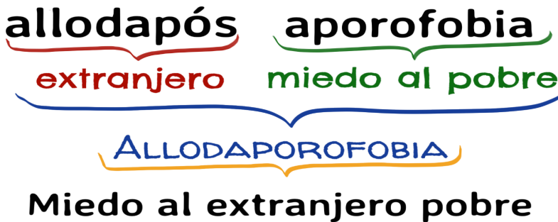
Ideograma 4: realizado por la autora para explicar el origen del neologismo "Allodaporofobia", traducible como 'miedo al extranjero pobre'.

Urge reconocerlo con franqueza: como colombianos le tememos al extranjero, sólo si éste es pobre.