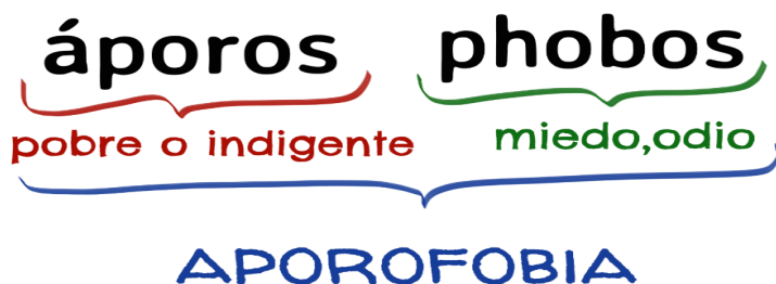
Ideograma 3: realizado por la autora para explicar la construcción del término “aporofobia” acuñado por Adela Cortina.

En clave parresiástica, la aporofobia es un término construido por Adela Cortina (Cortina, 2017, págs. 22-27) para referirse al odio hacia los pobres . El neologismo fue construido así: