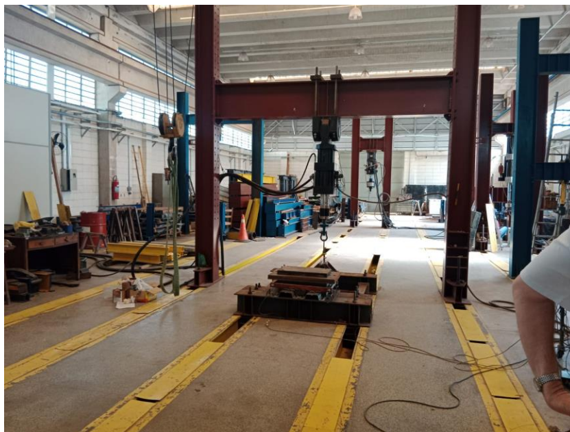
Figura 1. LABORATORIO DE ESTRUCTURAS METALICAS EESC