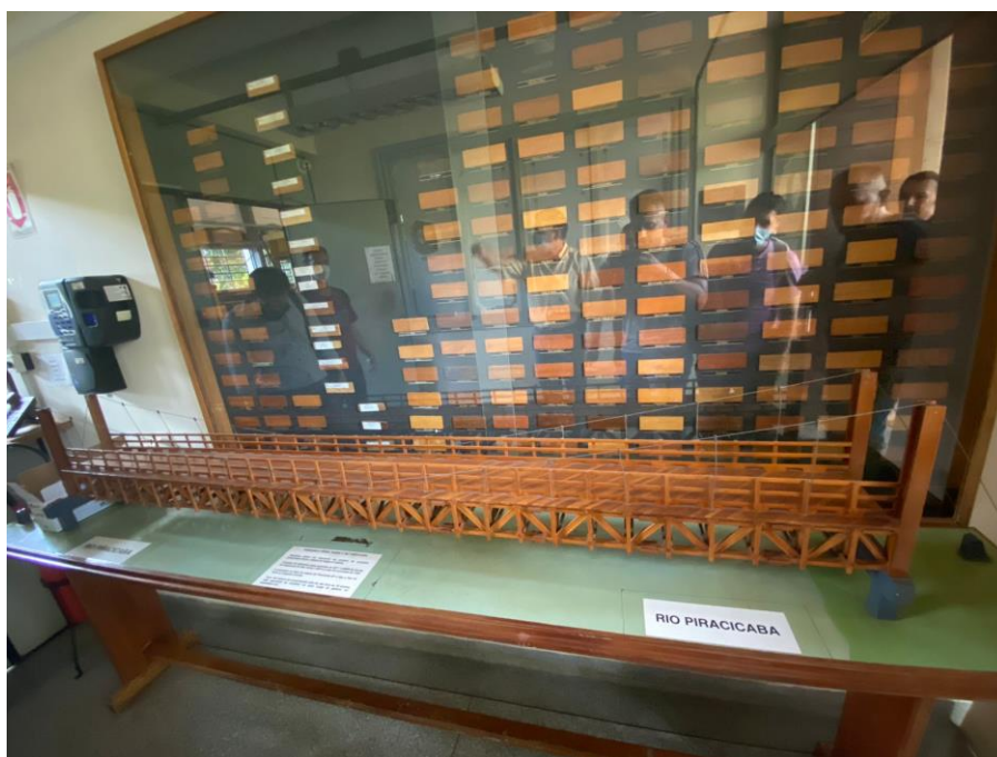
Figura 2. Laboratorio de maderas EESC