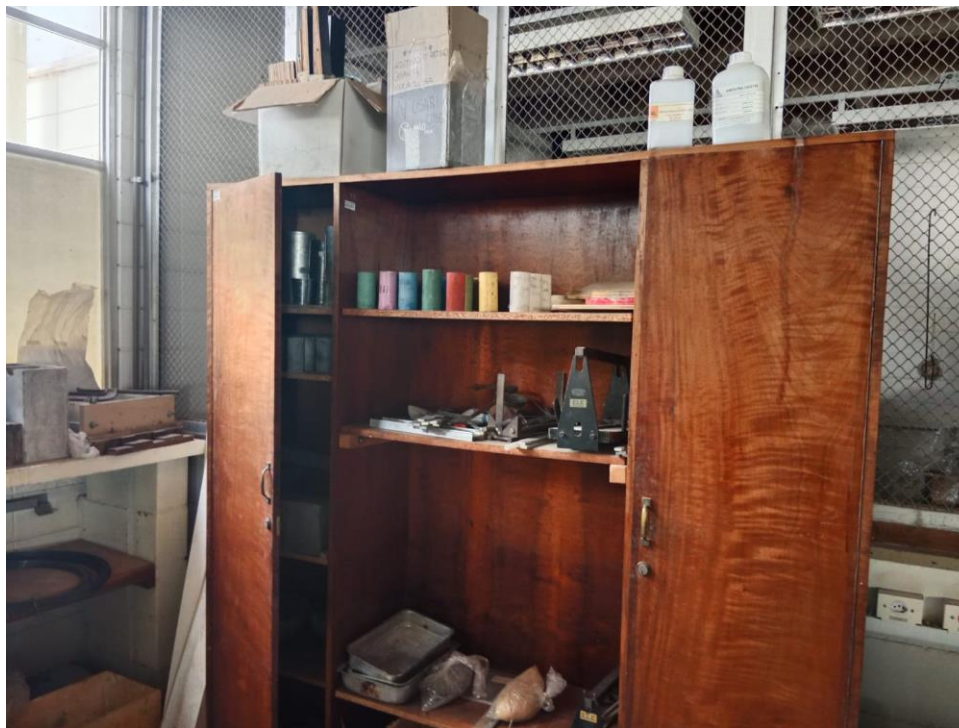
Figura 5. Laboratorio de Materiales