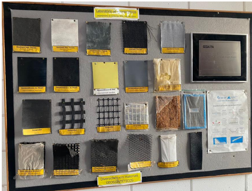
Figura 3. Laboratorio de geosintéticos EESC