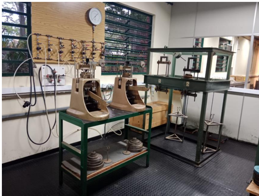
Figura 4 Laboratorio de Geotecnia