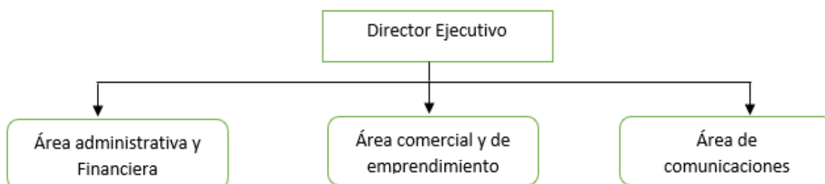
Figura 1: Estructura organizacional