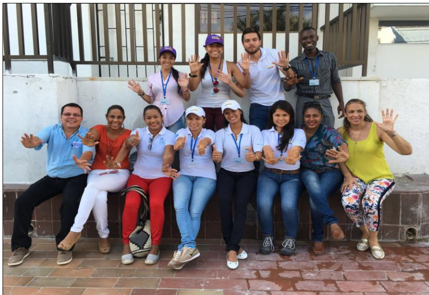
Fotografía 1. Equipo del PNUD y manos a la paz la guajira