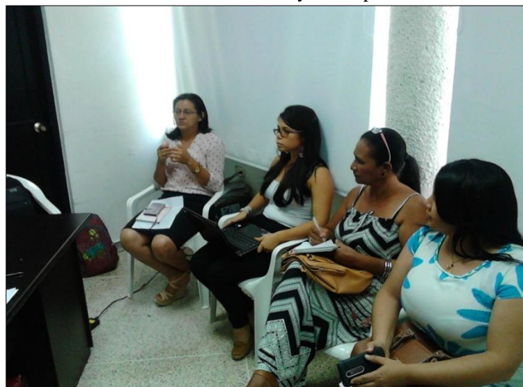
Fotografía 3. Reunión en la Secretaria de Gobierno y sus dependencias

Inicialmente el PDT del municipio de Hatonuevo se encontraba atrasado en el cumplimiento de algunos requerimientos y fechas de entrega del documento. Aspectos como la ausencia de conformación completa del Consejo Territorial de Planeación (CTP), el documento preliminar sin la Parte Estratégica y Plan de Inversiones básica elaborada y un diagnóstico sin una línea base sólida. Frente a ello el pasante brindó un apoyo constante a los consultores y encargados de la construcción del documento del PDT en la búsqueda de índices y datos para la construcción de la línea base, en la evaluación del contenido del documento en sí y dar apreciaciones correctivas. Para que se llevara a cabo éste apoyo el pasante estuvo visitando cada dependencia de la Alcaldía la cuales se componen de la Secretaría de Educación, Gobierno, Salud, Hacienda y Planeación. Las visitas consistían en la solicitud de información que sirviera de línea base para el diagnóstico y construcción de la Parte Estratégica, de igual manera se enfatizaba en la importancia de que todas las dependencias de la Administración se apersonaran y ayudaran a la formulación del PDT puesto que no se contaba con un interés óptimo y apropiado de los mismos hacia el documento.