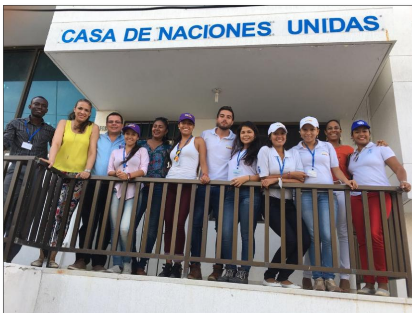
Fotografía 2. Equipo PNUD y manos a la paz la guajira