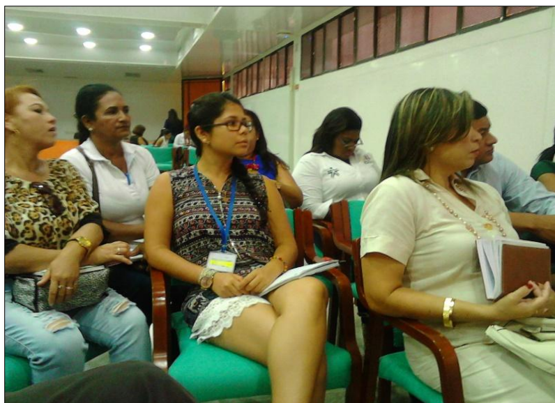
Fotografía 8. Subcomité de Prevención, Protección y Garantías de No Repetición