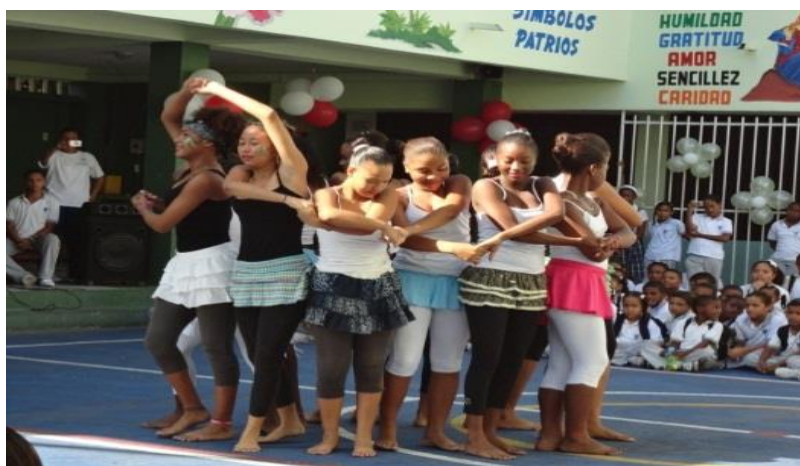
Imagen 2. Estudiantes durante su participación en el día de la afrocolombianidad.

Ante toda la comunidad educativa presente se expusieron diapositivas y carteleras para difundir información de interés relacionada al tema. El grado sexto siguiendo el proyecto de afrocolombianidad expresó en las carteleras la importancia de la etnoeducación. Acto seguido, cada estudiante paseaba por la exhibición de comida típica hecha en casa de algunos niños, niñas y adolescentes y finalmente se presenciaron danzas o bailes, una dramatización sobre la esclavitud y cantos de ritmos típicos.