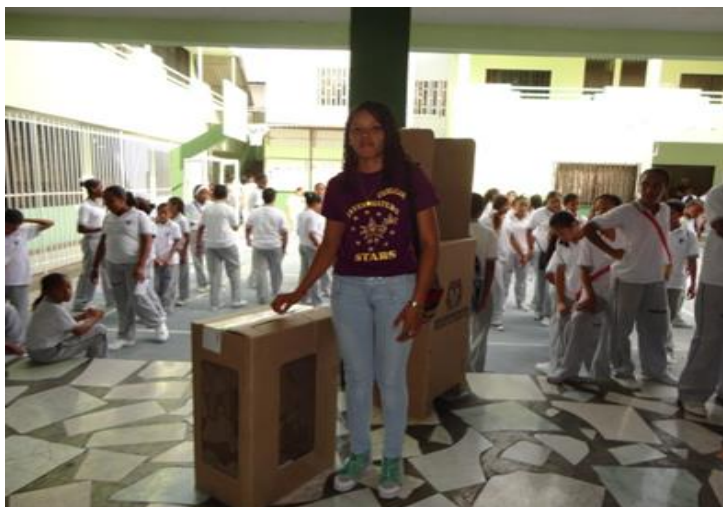
Imagen 1. Una estudiante ejerciendo su derecho al voto