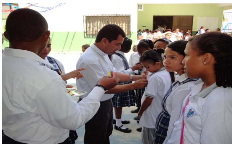
Imagen 3. Sacerdote, miembro de la comunidad, condecorando a los estudiantes destacados.

lectura alusiva a la Independencia, se interpretó una canción llamada “yo me llamo cumbia”, se declamó una poesía alusiva a la bandera, unas chicas bailaron el Chotish (baile típico insular) y finalmente los estudiantes que merecían izar el pabellón nacional recibieron una condecoración por su buen comportamiento y rendimiento académico.