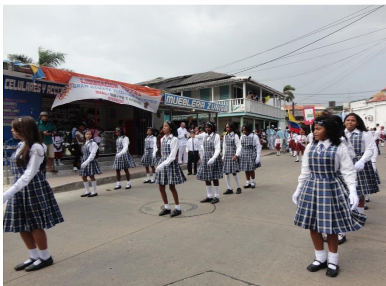
Imagen 4. Estudiantes durante la marcha del día de la independencia 20 de julio.

Cuando llegaron al estadio, la delegación de la institución se presentó ante los espectadores, haciendo los escuadrones y seguidos por la banda de paz de la misma institución. El tiempo aproximado de duración fue de 20 minutos en la presentación ante las autoridades. Al respecto, la profesora Candelaria afirmó que evidenció en los estudiantes un espíritu cívico y patriótico, y actitudes artísticas y creativas. Además, agregó que la mayoría de los educandos por lo general se esfuerzan por participar, para dar lo mejor de sí.