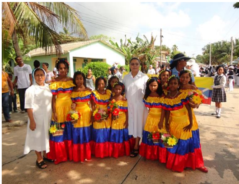
Imagen 5. Hermanas docentes y estudiantes durante el recorrido en San Luis, el 7 de agosto día de la Batalla de Boyacá.

“... el 7 de agosto una costumbre en San Luis, hubo mucha participación y mucha organización, aunque es más corto, o sea el recorrido y salimos más tarde porque allá hay mucho protocolo, pero todo bien”. (Estudiante, ver entrevista en anexo 18)