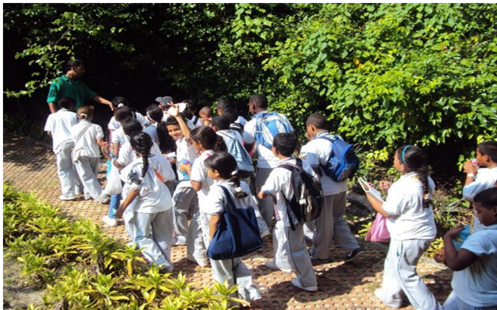
Imagen 6. Durante la visita al jardín Botánico liderados por el guía asignado.

Los estudiantes, durante esta salida pudieron valorar la naturaleza y demostraron que el medio ambiente debe ser respetado para llegar a un equilibrio. Algunos, de ellos expresaron que se debe ayudar a la conservación de la naturaleza. Y unos educandos específicamente se refirieron de la siguiente forma: “Debo cuidar mi entorno: no tirar las cosas al suelo, usar las papeleras” (Anexo 14). Otro fue muy enfático sobre la visita y aseguró que esta salida le dejó como enseñanza: “Querer la naturaleza, a saber tratar los animales. No se deben coger, ni matar las iguanas para que no se acaben en la isla, igual las plantas” (Estudiante, ver entrevista en anexo 18). Esta conciencia medioambiental la corroboran sus padres pues al ser encuestados, todos consideran que sus hijos reconocen que los seres vivos y el medio ambiente son un recurso único e irreplicable que merece respeto y consideración.