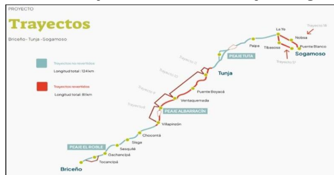
Ilustración 1. Trayectos Briceño – Tunja – Sogamoso

El área donde se ejecutaron las actividades de pasantía corresponde principalmente a los municipios de Tunja, Paipa y Duitama, donde se ubica la base de operación.