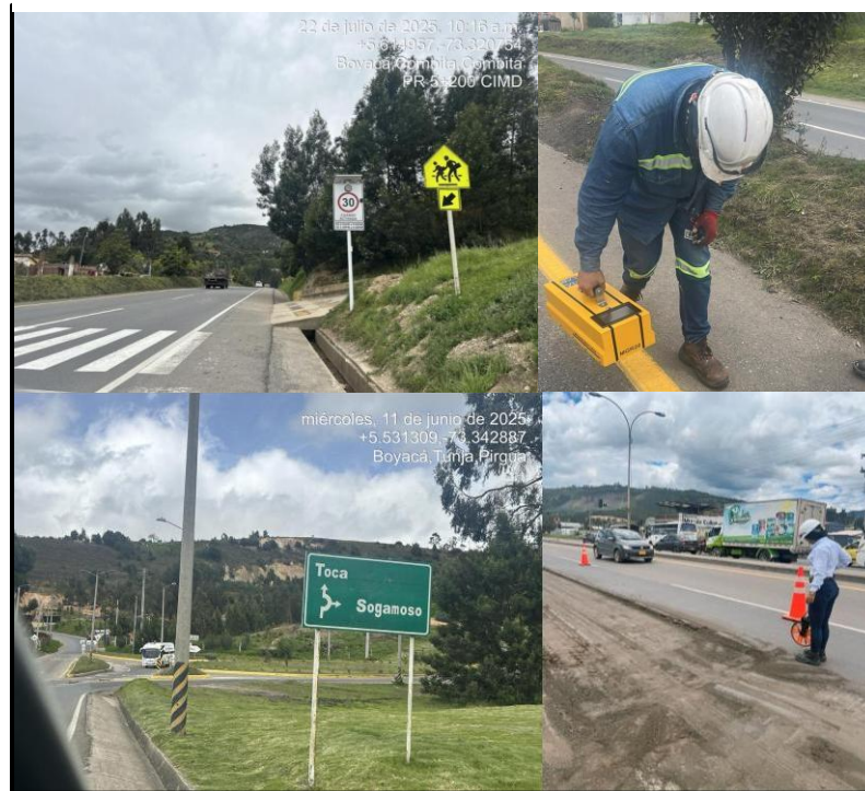
Ilustración 5. Medición de índices de estado

La aplicación de esta metodología contribuyó a fortalecer el control técnico del estado de la vía y a mejorar la capacidad de respuesta del concesionario frente a las necesidades de conservación de la infraestructura, permitiendo una gestión más eficiente de las actividades de mantenimiento.