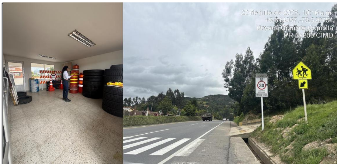
Ilustración 4. Revisión de inventario de herramientas e inventario de señalización vertical.

intervenciones ejecutadas en el corredor vial, facilitando el seguimiento a las actividades de mantenimiento programadas.