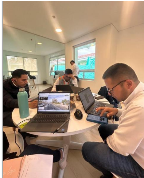
Ilustración 8. Oficina el Roble, equipo de trabajo

La adecuada gestión de estos requerimientos permitió garantizar la atención oportuna de las observaciones emitidas por las entidades de control, contribuyendo al mantenimiento de los niveles de servicio del corredor vial y al cumplimiento de las obligaciones contractuales del concesionario.