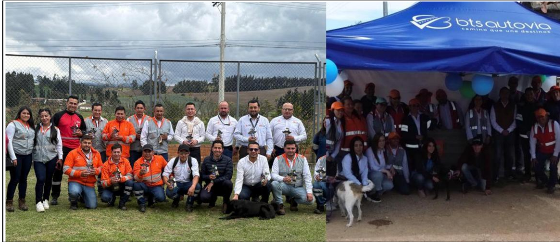
Ilustración 9. Participación en campañas de seguridad vial y acompañamiento grupal.