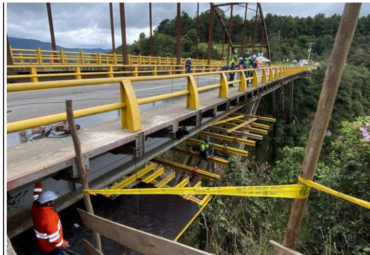
Ilustración 7. Revisión de cumplimiento de obra de mantenimiento

El desarrollo de estas actividades contribuyó al control y seguimiento de las intervenciones de conservación vial, asegurando que las obras de mantenimiento se ejecutaran de manera oportuna y conforme a los criterios técnicos establecidos para la operación del corredor concesionado.