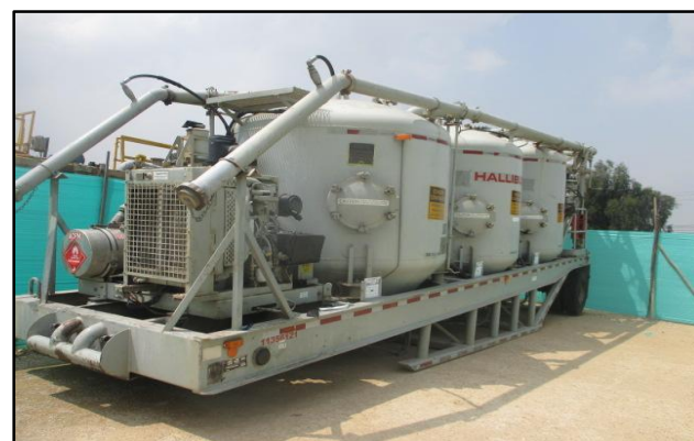
Fotografía 4. Máquina de Cementos, 2018