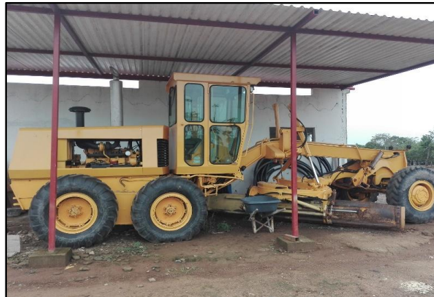
Fotografía 2. Máquina Excavadora, tomada por Angelica Hernández, 2018