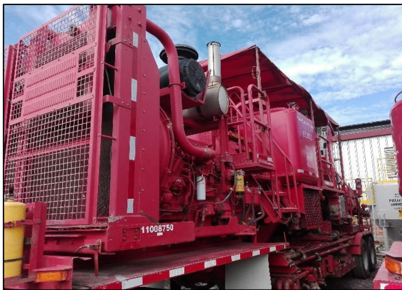
Fotografía 1. Maquina Petrolera, tomada por Angelica Hernández, 2018

A continuación, hay una serie de fotografías de visitas realizadas durante estos 6 meses a bases de Weatherford, empresa internacional que se dedica a prestar servicios de petróleo y gas natural, sus instalaciones están ubicadas en la vía acacias, Halliburton, multinacional enfocada a los productos, servicios y soluciones integradas para la exploración de petróleo y gas, desarrollo y producción, entre otros campos petroleros como chichimene.