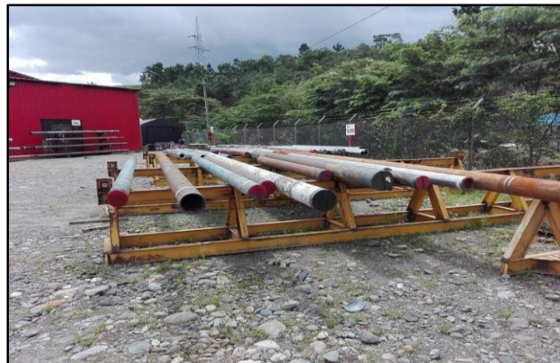
Fotografía 3. Tubos Petroleros, tomada por Angelica Hernández, 2018