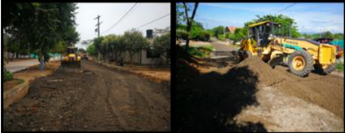
Figura 5 Estructura Granular.

Para esta actividad se tuvo en cuenta controles de operación, ya que se debió controlar la presencia de personas no vinculadas al proyecto.