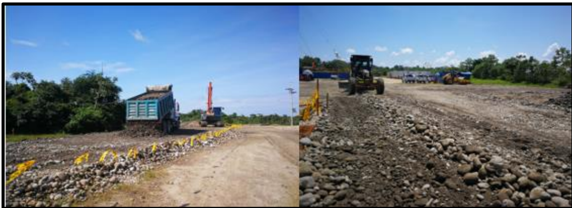
Figura 6 Conformación de estructura granular

La figura 6 nos permitió apreciar el proceso de distribución de material granular por secciones, según las recomendaciones constructivas. Esto se realizó con la finalidad de lograr estimar muestras por capas, garantizando un óptimo cumplimiento de la norma.