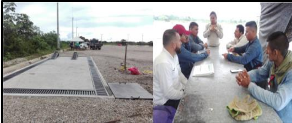
Figura 14 Placa Trasegío

En la figura 14 se evidenció la entrega del proyecto correspondiente a la placa trasegío junto con sus respectivos accesorios.