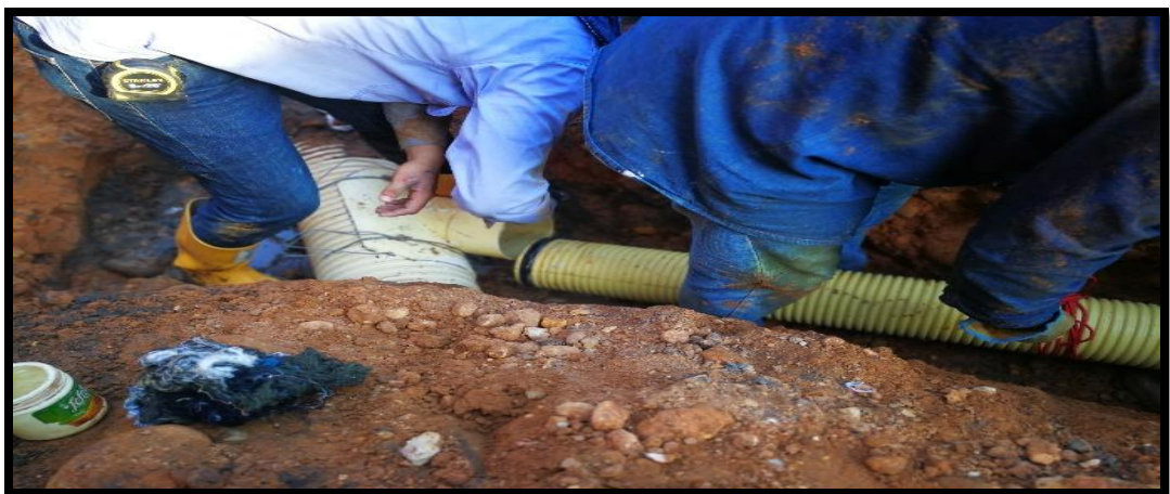
Figura 4 Instalación de Tubería Sanitaria

La figura 4 nos permitió evidenciar el proceso constructivo de instalación de una tubería sanitaria, así como los elementos que se deben usar durante esta etapa (silla yee, tubo novafort, aditivo epóxico). De esta manera se garantizó un óptimo proceso en la ejecución de dicha actividad., generando aceptación por parte de la comunidad.