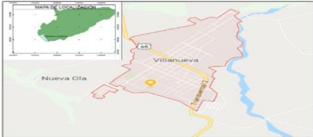
Figura 1 Localización Villanueva, Casanare

Como se aprecia en la figura 1, se indicó la ubicación del municipio respecto del departamento. Como también, una pequeña delimitación del mismo.