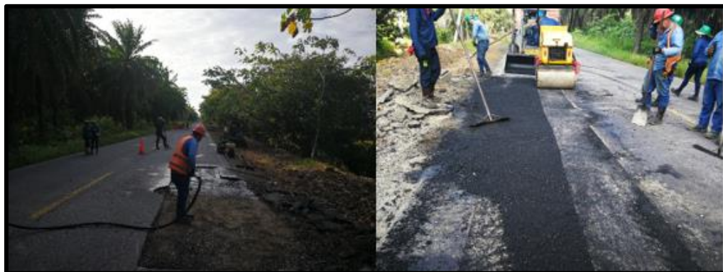
Figura 13 Aplicación de asfalto

En la figura 13, se identificó el proceso de aplicación del asfalto, en donde se realizó el retiro de la capa deteriorada para su reparación. Luego de esto se procedió a retirar impurezas para finalmente suministrar el asfalto.