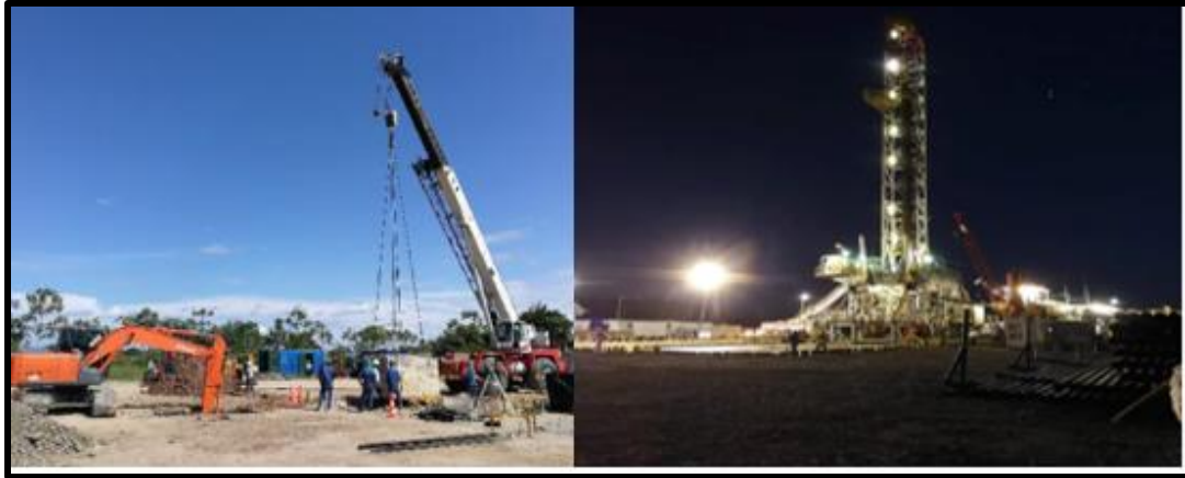
Figura 12 Liberación de plataforma