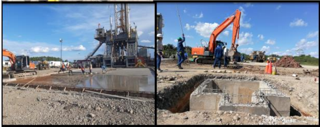
Figura 7 Construcción de estructuras en concreto

Por otro lado, se indica la etapa final de vaciado de concreto de 3000 psi sobre placa correspondiente a ampliación de plataforma akira norte.