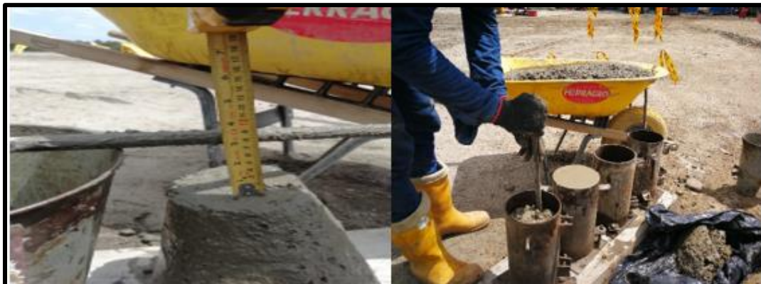
Figura 11 Asentamiento del concreto

La figura 11, permitió detallar el proceso de control de calidad de suministro de concreto. Donde se realizó el ensayo correspondiente a asentamiento del concreto según la NTC 396.