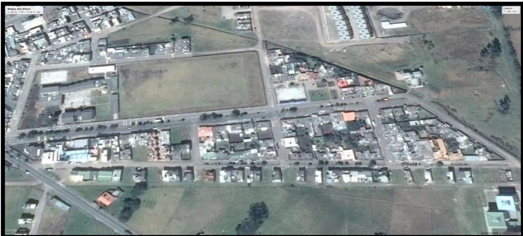
Figura 2 Ubicación del Proyecto.

La figura 2, muestra el perímetro en donde el pasante como auxiliar de ingeniería contribuyo e hizo parte del equipo, en la construcción de la red de alcantarillado de aguas residuales correspondiente al proyecto. Pavimentación barrio Mirador.