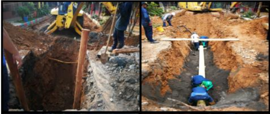
Figura 3 Proceso de Excavación Mecánica