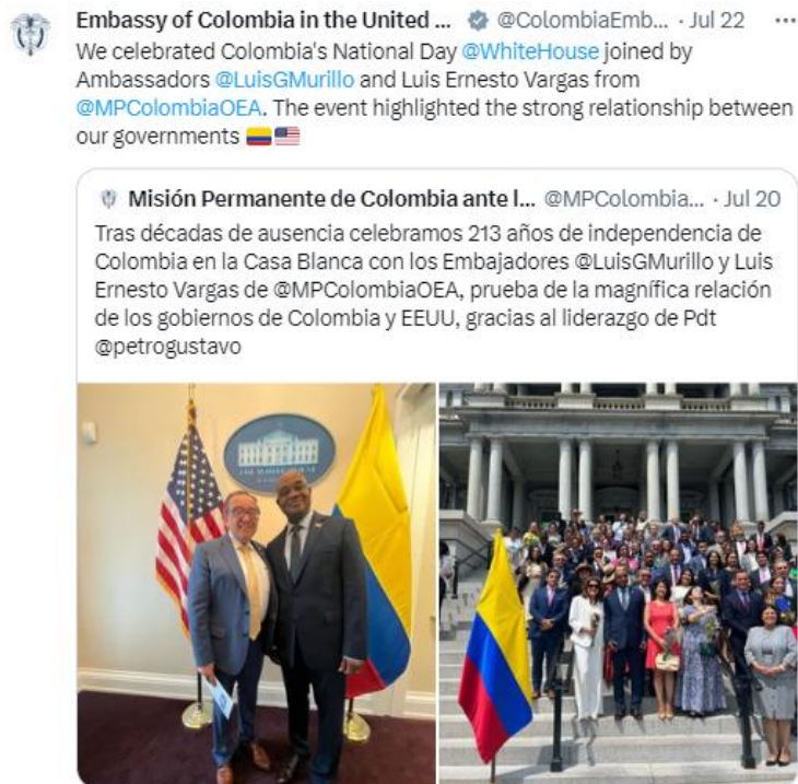
Figura 5. Trino de la Embajada de Colombia en Estados Unidos por la celebración de la independencia de Colombia en la casa blanca.

Redacción de trinos para la cuenta de Twitter de la Embajada de Colombia, los cuales comúnmente son redactados en inglés y son basados en una amplia serie de temáticas medio ambientales, de política, migración, educación, proceso de paz entre otros.