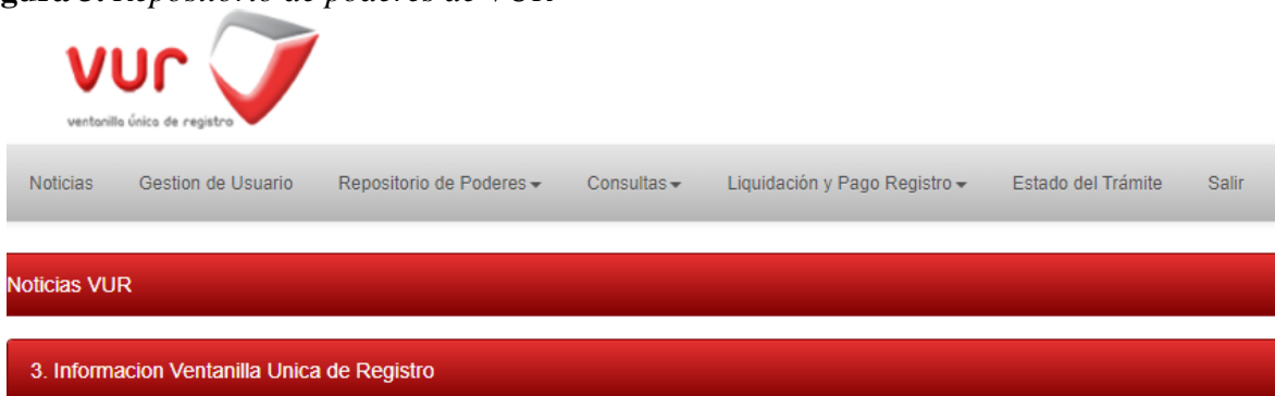
Figura 3. Repositorio de poderes de VUR