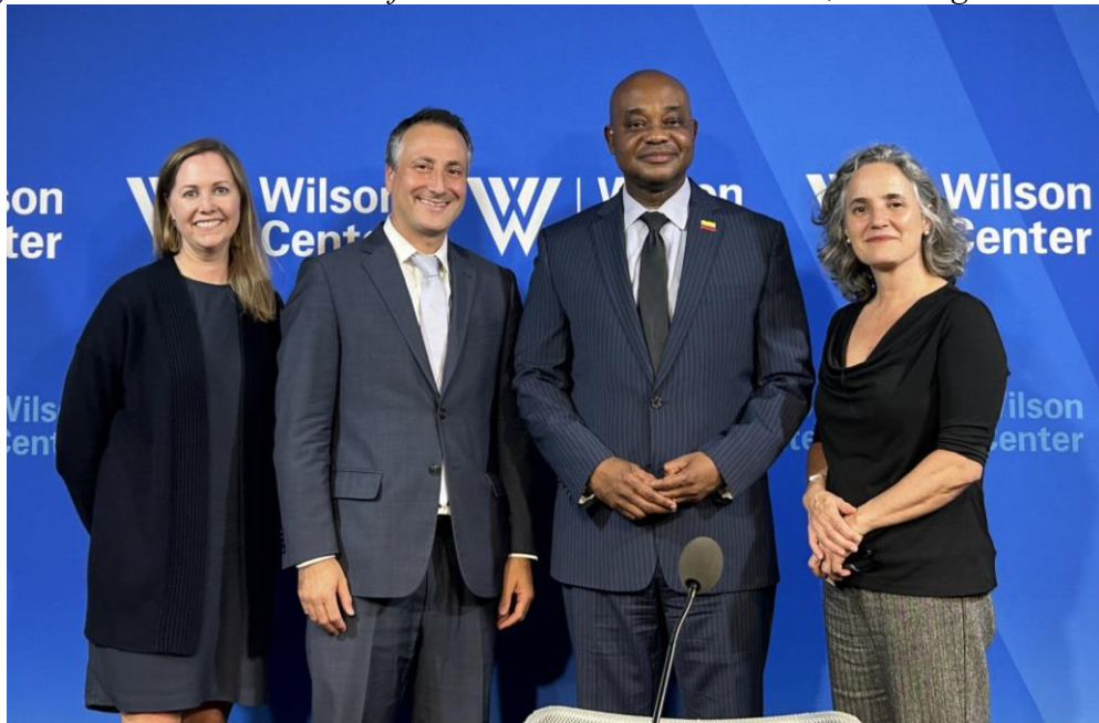
Figura 4. Charla del embajador Luis Gilberto Murillo “Colombia’s Frontline Environmental Defenders: Afrocolombians and the Pacific Coast” en el Wilson Center, Washington D.C.