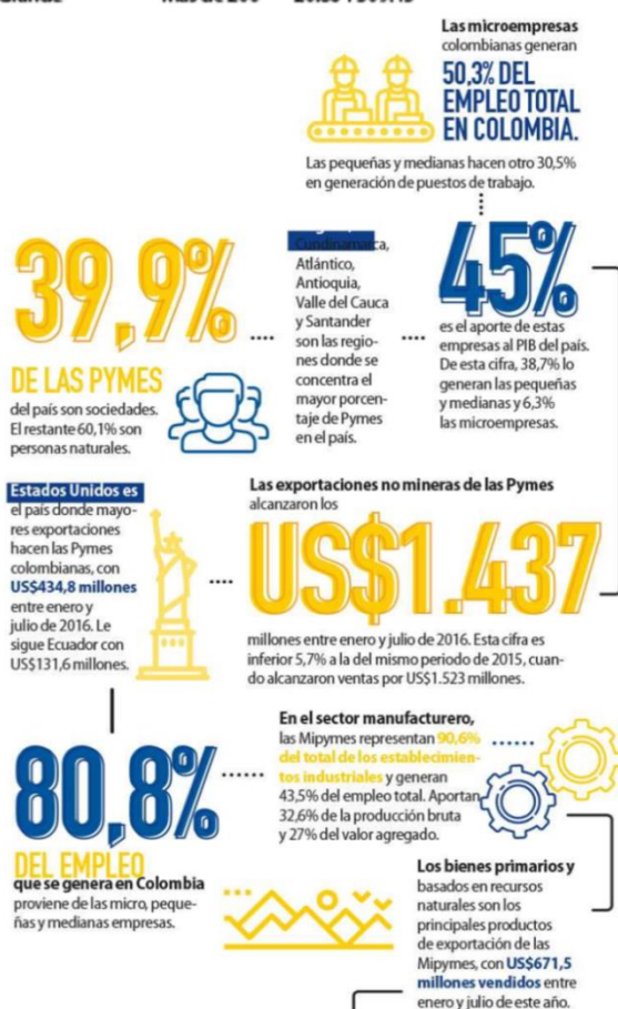
Figura 3. PYMEs contribuyen con más del 80% del empleo en Colombia. País PYME. (Dinero, 2016)