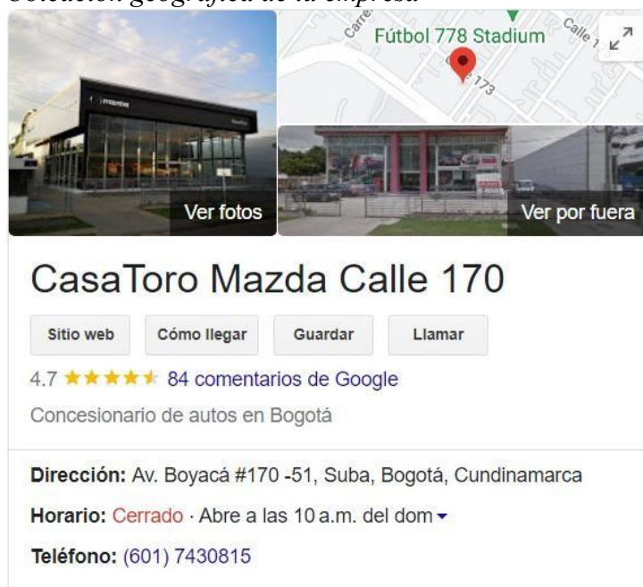
Ubicación geográfica de la empresa