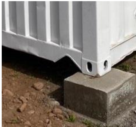
Figura 4. Fundaciones apoyo