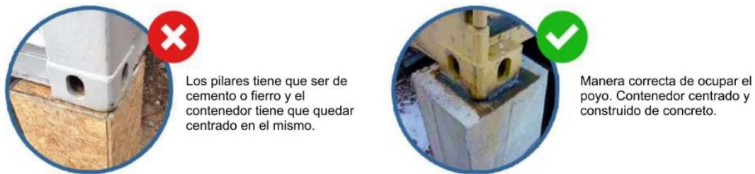
Figura 5. Guía para construir cimientos de apoyo para contenedores

Distanciamiento a ejes de los elementos de apoyo (cimentaciones) en función a las medidas de los módulos a considerar, generando un desplazamiento de los prototipos fuera de los centroides de cada apoyo estructural, comprometiendo el reparto del esfuerzo entre la cimentación cuando es definida de manera aislada. También los apoyos tienen que estar perfectamente alineados unos con otros a 90° para crear un rectángulo perfecto.