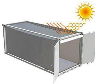
Figura 6. Protección térmica

Climatización, este condicionante relevante en los procesos ya del funcionamiento, condiciona ciudades de Colombia, donde las temperaturas de manera agresiva sacan de la línea de confort al usuario, dado a que ante la ausencia de aislantes térmicos podría acelerar el coeficiente de absorción térmica y generar en este problema con la función del espacio.