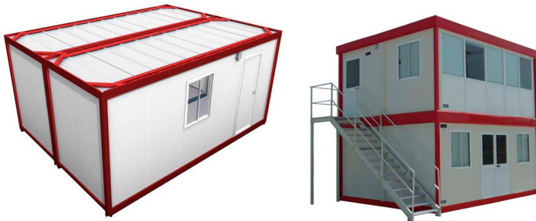
Figura 3 Integración de Unidades Modulares

Nota. En la figura de la izquierda se observa la integración lateral y la integración superior.