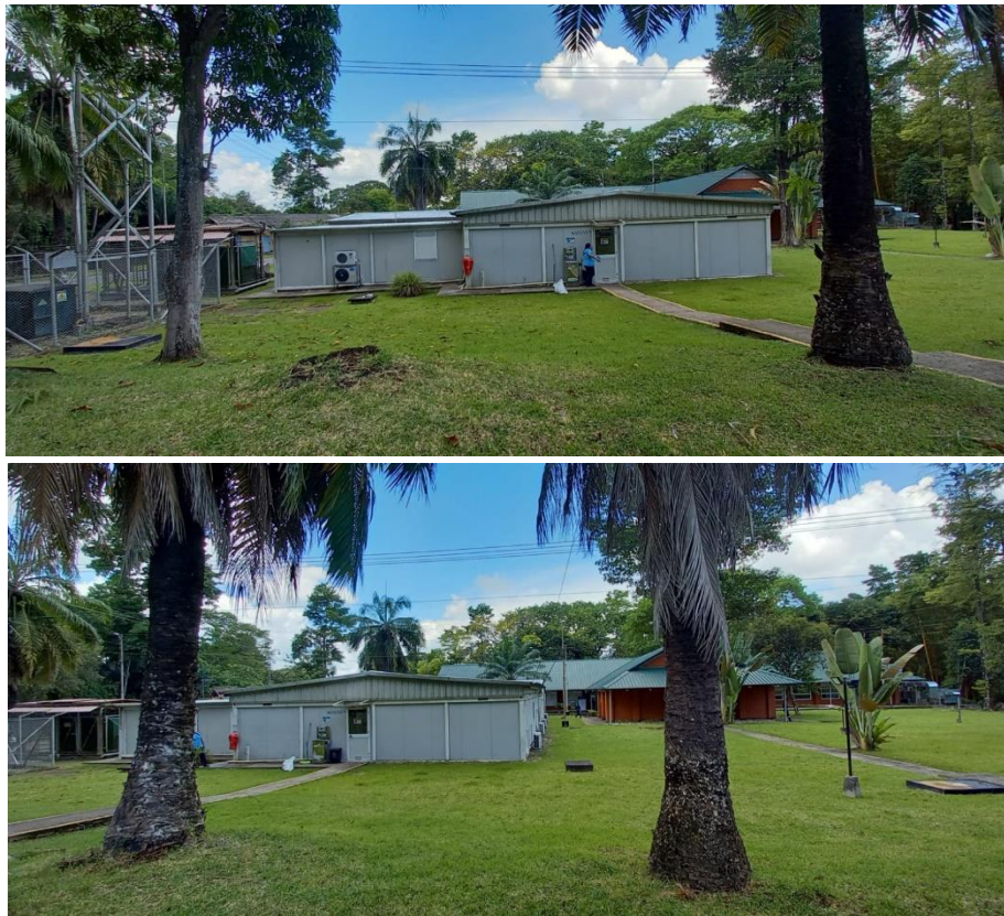
Figura 9. Campamento de Sistema Modular de la Empresa Serrano y Cabrales Constructores S.A.S

Después de la socialización, el grupo de trabajo aplico la lista de chequeo en uno de sus proyectos de construcción sostenible de campamentos de alojamientos, como resultado, el equipo de trabajo encuentra que, con la lista de chequeo elaborada en este proyecto, se le facilitara el control de los lineamientos básicos en este tipo de obra, asimismo, la lista de chequeo le permite supervisar las condiciones de diseño con la que debe contar este tipo de obra.