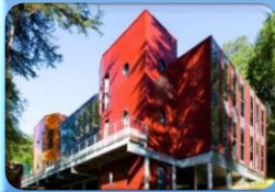
Figura 1. Clasificación de las Construcciones Modulares

Ligeros: brindan un menor desgaste de instalación y transporte, por ende la demanda de maquinaria y energía también lo es.