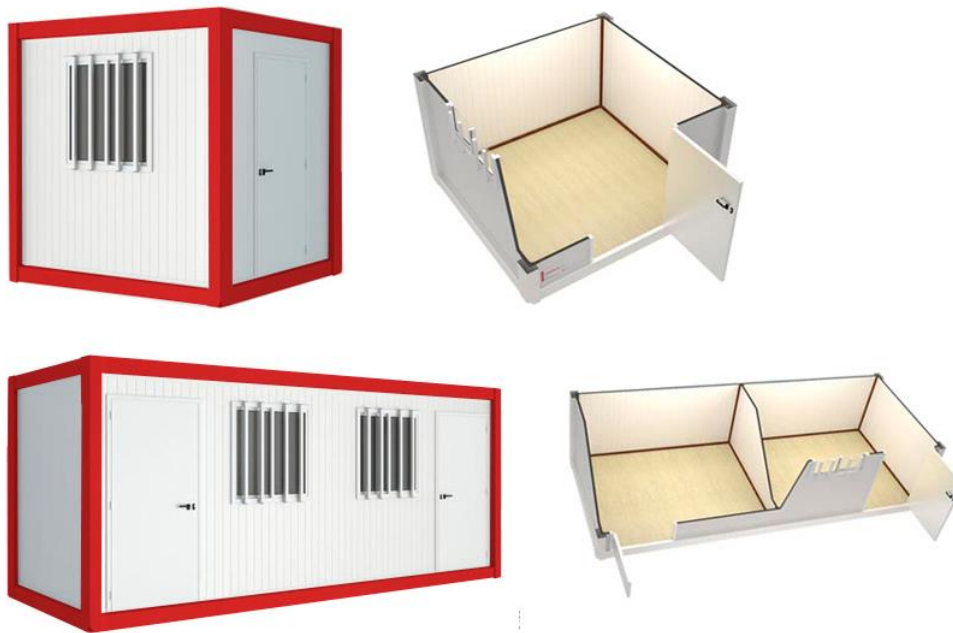
Figura 2 Unidades modulares

Nota. En la figura superior se observa la unidad modular cuadrada y la unidad modular rectangular.