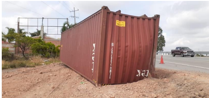
Figura 7. Contenedor