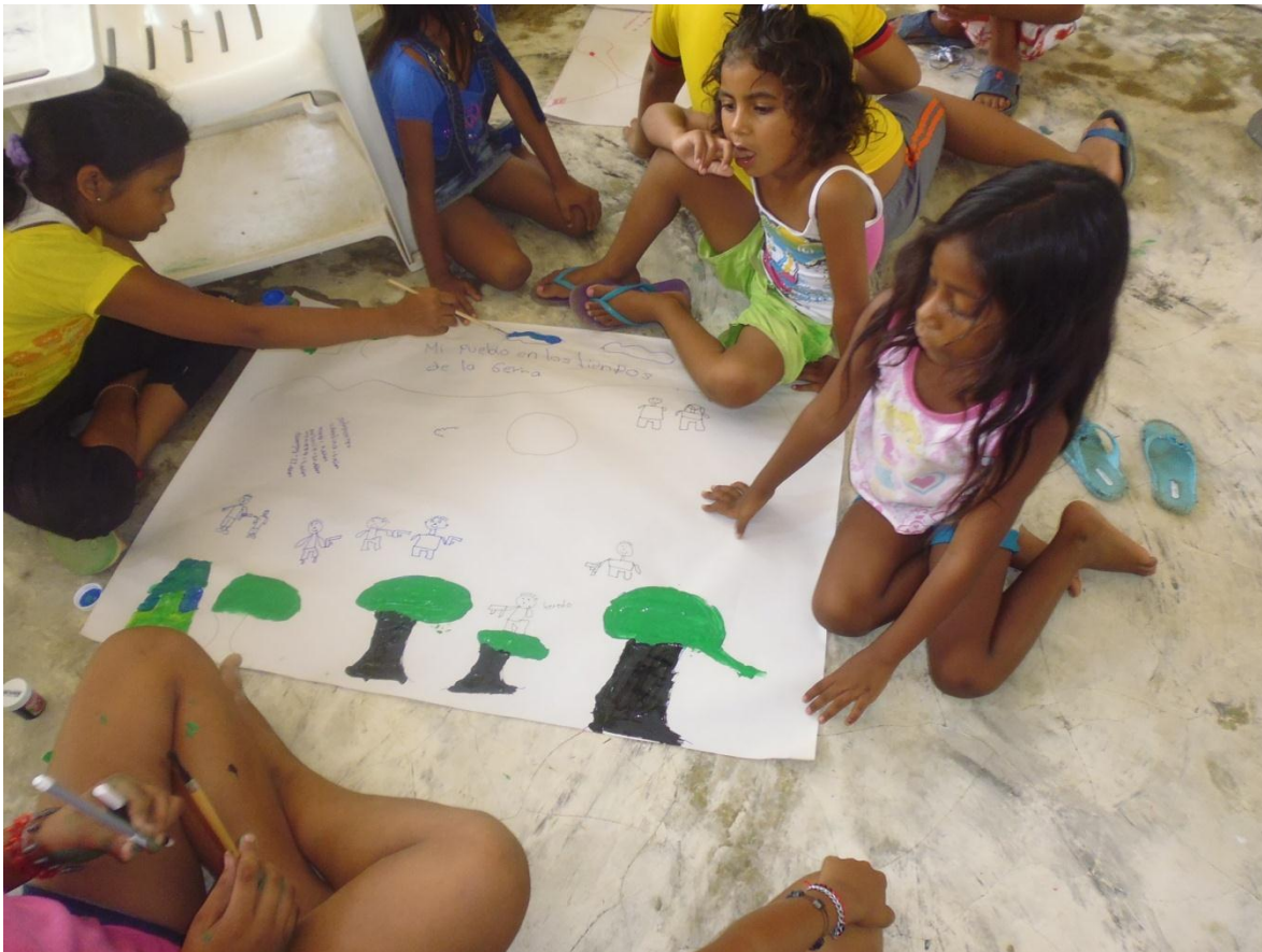
Fotografía de los niños y niñas dibujando el contexto de la guerra relatada por sus padres.