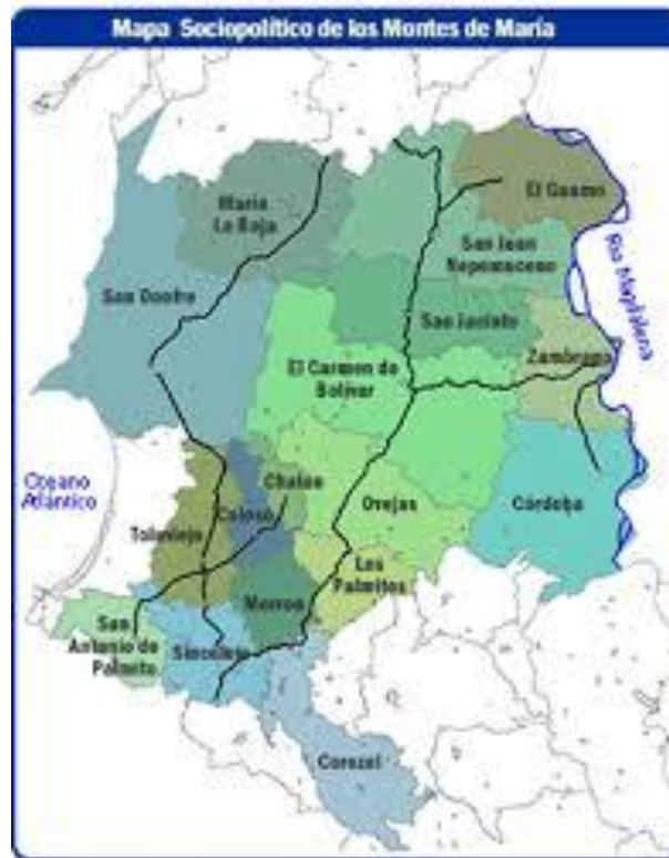
Fig. 4. Mapa sociopolítico de los Montes de María.

“La subregión de los montes de María en la Costa Atlántica colombiana, está conformada por los municipios de María La Baja, San Juan Nepomuceno, El Guamo, San Jacinto, el Carmen de Bolívar, Zambrano, Córdoba (pertenecientes al departamento de Bolívar) y San Onofre, Los Palmitos, Morroa, Chalán, Colosó,