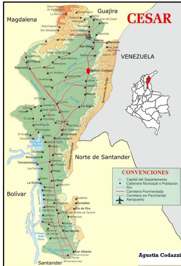
Fig. 1. Imagen Departamento del Cesar, tomada de http://tecsistemadepartamentodelcesar.blogspot.com/

Entre 1960 y 1975 la producción aldononera jugó un papel muy importante en la configuración de la región, pero en 1976 inicia la crisis de éste región productivo, que se profundiza con el proceso de apertura económica y con la escalada intensiva del conflicto armado. En la segunda mitad de los años 90 inicia con fuerza la actividad minera, especialmente relacionada con la extracción del Carbón”, en un marcado acento de reconfiguración territorial. (FUAA, FGEB y PNUD, 2011, pág. 12)