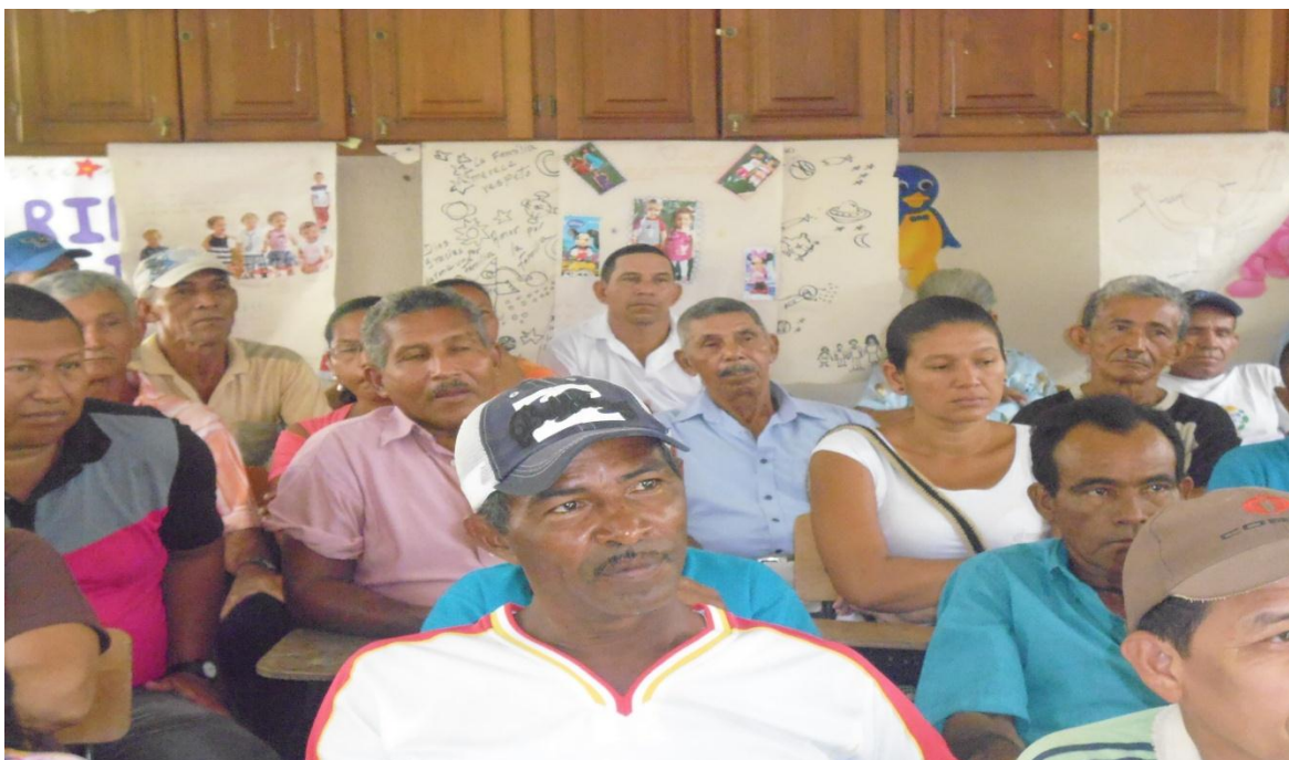
Campesinos desplazados, hoy mano de obra barata de compañías bananeras