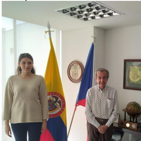
Figura 6. Visita al consulado de República Checa.

Con motivo de la coordinación de la primera reunión de la asociación de cónsules de Bucaramanga se realizó una visita al consulado de República Checa.