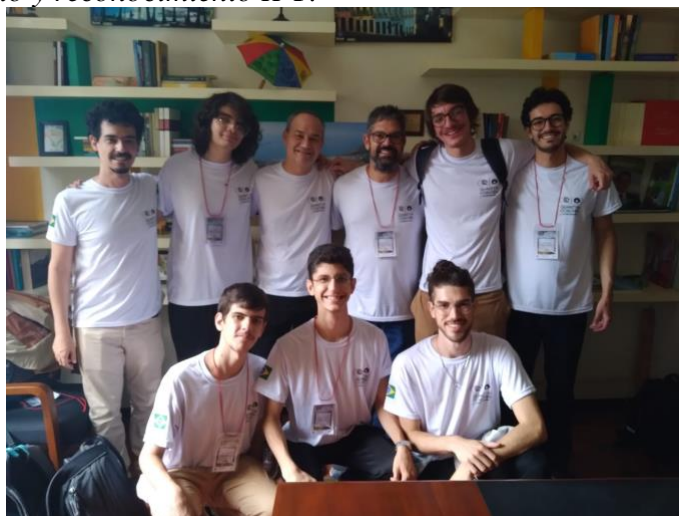
Figura 8. Recibimiento y reconocimiento IPT.

Recibimiento y pequeño reconocimiento al equipo IPT Brasil por su participación y segundo lugar en el 14 concurso internacional de física realizado en la Universidad Industrial de Santander.