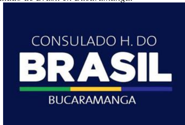
Figura 1. Logo del consulado de Brasil en Bucaramanga.