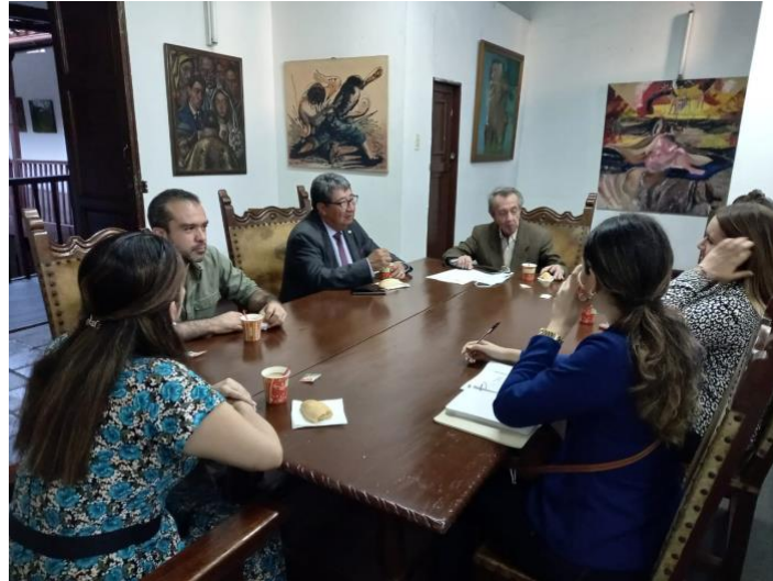
Figura 10. Reunión de cónsules.