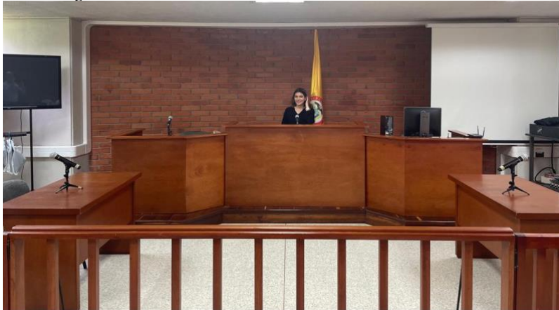
Figura 9. Ejercicio de negociación Rusia- Ucrania.

Asistencia como invitada y representante del consulado al ejercicio de negociación Ucrania- Rusia realizado por los estudiantes de cuarto semestre de administración de negocios internacionales de la universidad pontificia bolivariana.