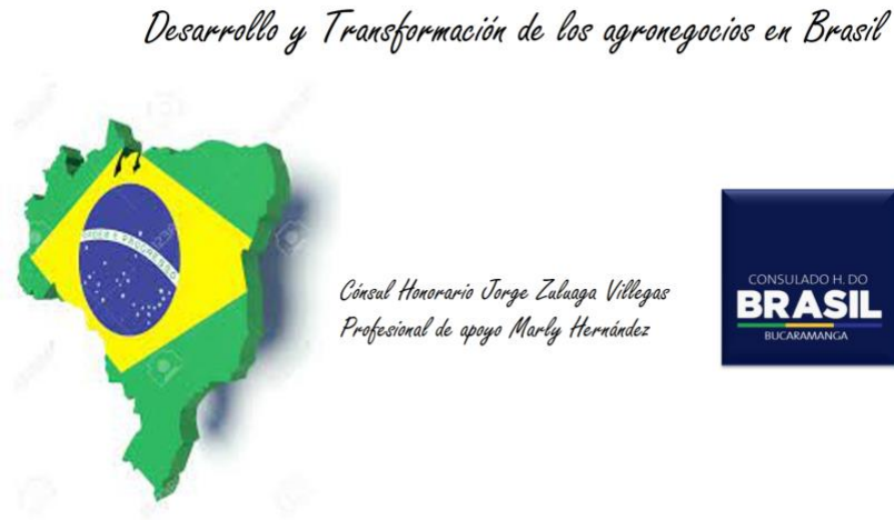
Figura 7. Desarrollo del agro negocio en Brasil.