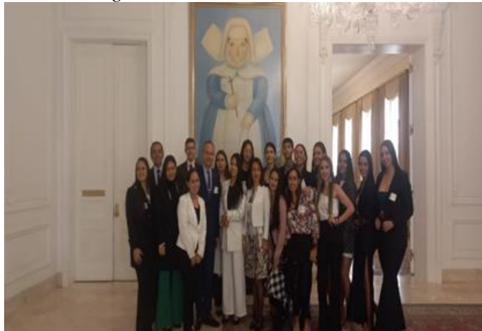
Figura 5. visita diplomática a Bogotá.

Charla presentación del programa e estrategia nacional pedagógica y prevención del castigo físico, los tratos crueles, humillantes o degradante.