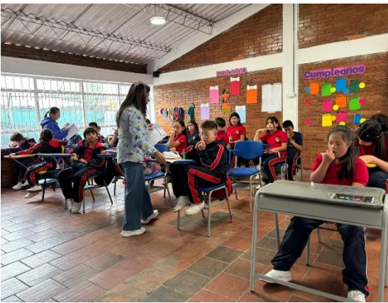
Foto 9: Entrega de la prueba