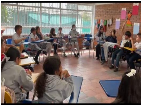
Foto 15: Participación de los niños