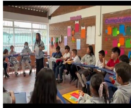
Foto 16: Participación de los niños