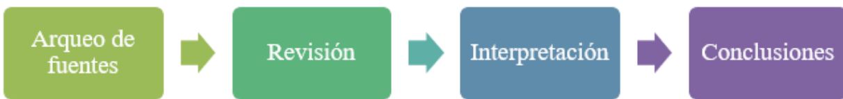
Figura 1. Esquema diseño metodológico Investigación documental

Nota: La figura representa el esquema del diseño metodológico de la investigación documental, resumiendo las cuatro fases que se deben tener en cuenta para emplear de manera completa el objetivo central de dicha investigación. Elaboración propia, (2024).