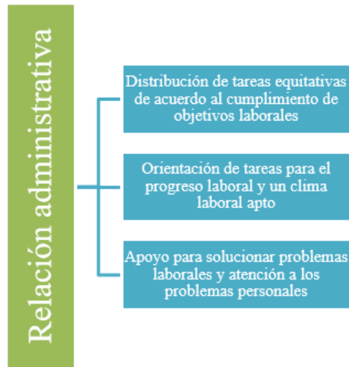
Figura 3. Relación administrativa empleador- empleado

Nota: La figura representa la relación administrativa entre la distribución de tareas, la orientación de tareas y el apoyo empresarial para resolver conflictos. Elaboración propia, (2024)