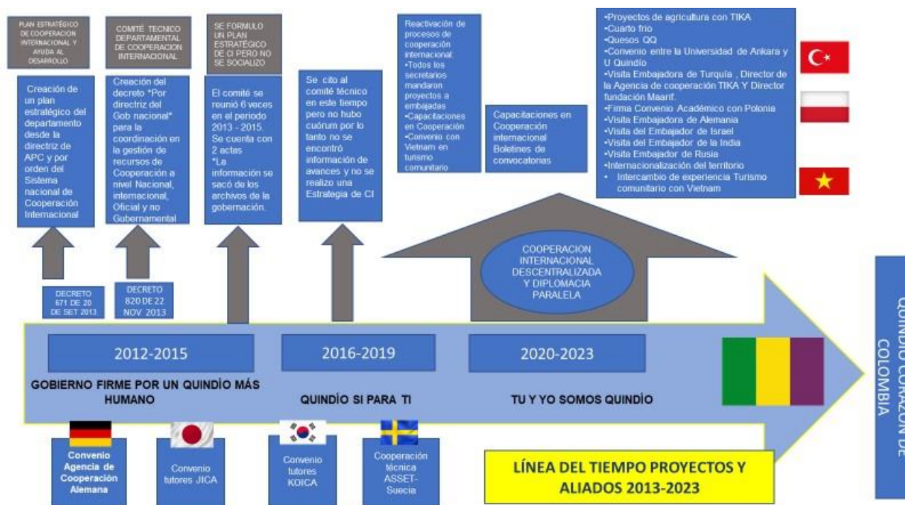
Ilustración 2. Línea del tiempo hitos del desarrollo institucional de la CI en el departamento del Quindío.

Elaboración propia. Con base en Secretaría de Agricultura y Desarrollo Rural (2023)