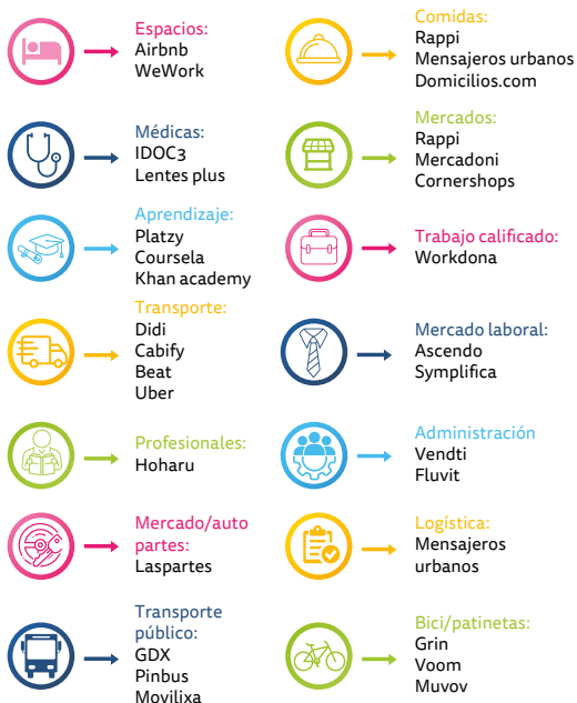
Figura 3. Plataformas existentes en Colombia