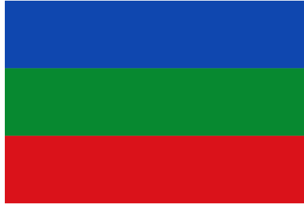
Ilustración 3. Bandera de Villavicencio. Adaptado de la Página web de la Alcaldía de Villavicencio.