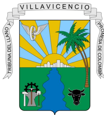
Ilustración 2. Escudo de Villavicencio. Adaptado de la Página web del Instituto de turismo del Villavicencio.

El escudo de la ciudad diseñado por Hernando Onofre, está inspirado en la belleza del llano. Está formado por el emblema que enmarca el cuerpo del escudo y contiene los siguientes elementos: el sol con sus rayos amarillos oro, naciendo sobre el horizonte con fondo azul cielo, las palmeras que recuerdan los morichales sobre la ciudad; el río Guatiquía que pasa por su costado; la pica, la pala, la hachuela, el yunque y la rueda dentada.