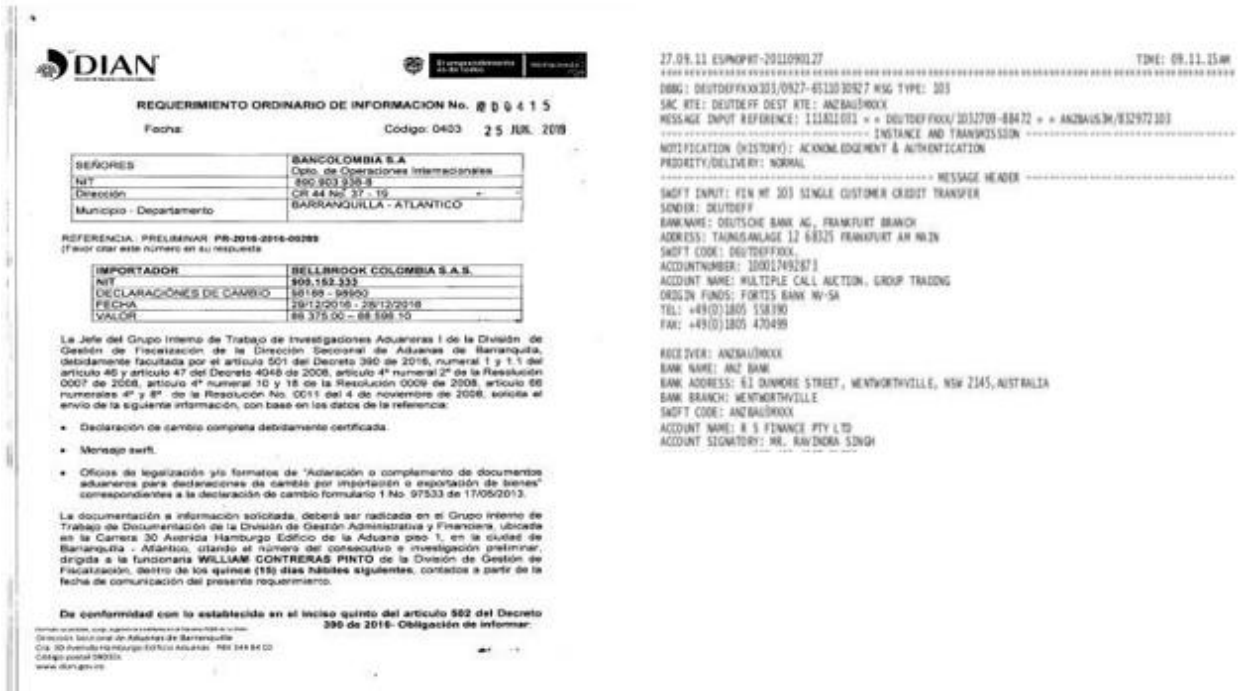
Figura 7. Ejemplo de mensaje Swift