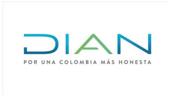
Figura 1. Logo de la DIAN