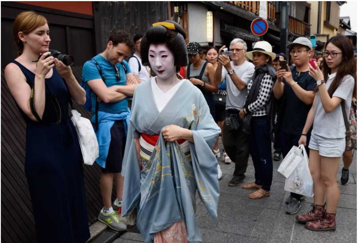
Geisha en una calle de Kioto rodeada de una gran cantidad de turistas.

conocedores de las características de otras culturas, las tradiciones o festividades van siendo afectadas y modificadas poco a poco, no de manera brusca ni con ninguna mala intención de fondo sino más bien de forma gradual, pero es un detalle curioso que se vea estos cambios en las festividades.