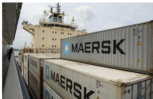
Figura 4. Vías de acceso y área de despacho y recibo de carga en contenedores. (Farmazona, s.f.)

Farmazona SA cuenta con una gran cantidad de vías de acceso y una extensa área de despacho y recibo de carga que permite brindar soluciones logísticas reales para el traslado de mercancía en tránsito de contenedor a contenedor, mismas que por el tipo de operación no requieren ser almacenadas, solo recibidas, verificadas y reexportadas inmediatamente a diferentes destinos. (Farmazona, s.f.)