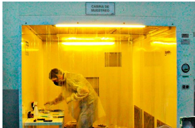
Figura 6. Bodegas acondicionadas para el almacenamiento de diferentes tipos de productos. (Farmazona, s.f.)

inventarios de los clientes utilizando las herramientas más innovadoras y de acuerdo a los principios internacionales estándares para manejo de inventarios. (Farmazona, s.f.)