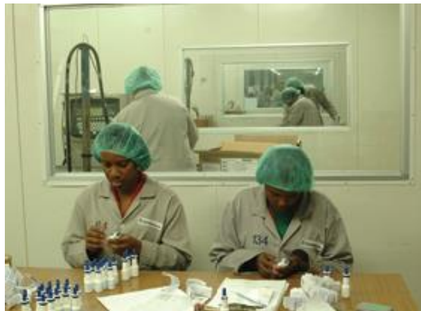
Figura 8. Proceso de etiquetado (Farmazona, s.f.)

Farmazona S.A. cuenta con una amplia gama de servicios de valor agregado, los cuales son fundamentales para que esta compañía sea preferida por sus clientes, ya que los servicios prestados son: Re-empaque, Ensamblaje, Reducir o Ampliar presentación, Etiquetado, Impresión, Armado de empaque promocional y otros servicios que el cliente pueda solicitar, por lo que en este caso tienen un mayor sentido social, se contratan a madres cabeza de hogar de la zona de Colón, ya que son personas vulnerables y ayudan a la mejora de su calidad de vida. (Farmazona, s.f.)