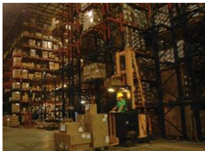
Figura 2. Productos almacenados en bodega.

Se les brinda a los clientes soluciones reales que les traen resultados reales y dependiendo del tipo de operación que ellos requieran ofrecen servicios logísticos y de transporte con un alto índice tecnológico en las bodegas dedicadas exclusivamente para el cliente que así lo requiera.