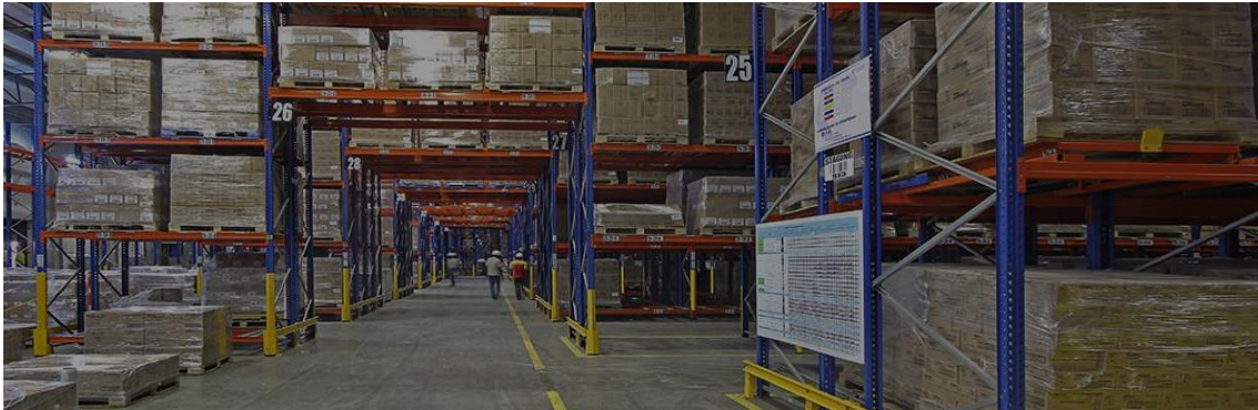
Figura 3. Sistema vertical de almacenamiento de los productos. (Farmazona, s.f.)

Todos los almacenes son administrados utilizando sistemas tecnológicos y programas que permiten saber la ubicación en todo momento de cada producto dentro de la bodega, al igual que el manejo y rotación que requiere cada producto de acuerdo a la comercialización de cada uno, se manejan lo que es un sistema vertical de almacenamiento de la mercancía, buscando el mayor aprovechamiento del espacio y la mejor forma de ubicación de la mercancía para la buena rotación del inventario. (Farmazona, s.f.)