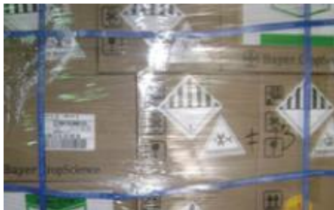
Figura 5. Caja etiquetada posterior a su minuciosa verificación. (Farmazona, s.f.)

Luego de la revisión, cada caja es etiquetada mediante códigos de barra y se le asigna una ubicación en almacén, si tiene algún inconveniente en lo que pueda ser mal empacado, mala calidad, mala impresión del lote o inconvenientes con el mismo, se le asigna un color por medio de una etiqueta la cual representa el estado en el que se encontró la caja y se le da el aviso al cliente; el sistema de manejo de almacén permite tener control en todo momento de las posiciones disponibles mediante el código de barra de la ubicación de cada producto. (Farmazona, s.f.)