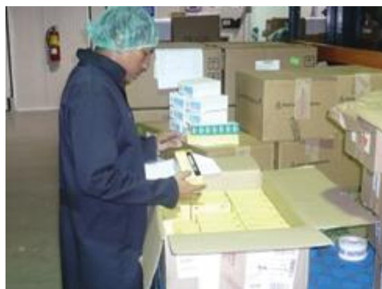
Figura 7. Representantes de servicio al cliente recibiendo órdenes (Farmazona, s.f.)

Ellos cuentan con una plataforma logística y sistemas tecnológicos que permiten tomar y despachar órdenes de unidades, cajas, pallets completos o consolidar pedidos, manteniendo los estándares de rotación de inventarios específicos de cada industria. (Farmazona, s.f.)