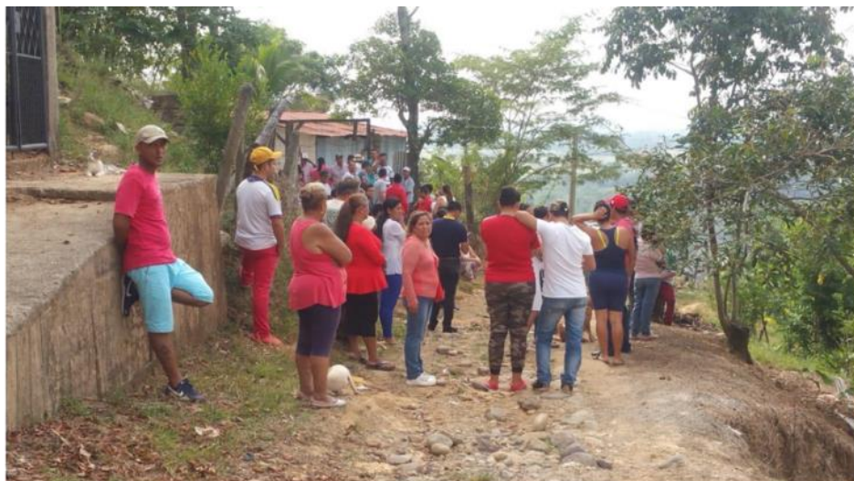
Capacitaciones de concientización y sensibilización sobre el manejo adecuado de residuos orgánicos