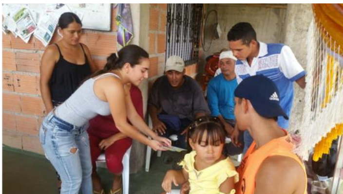
Personas interesadas en el proyecto