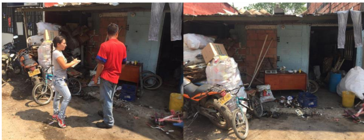
Chatarrería en La Nohora