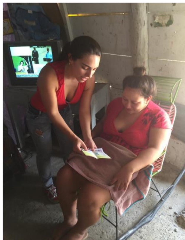
Capacitaciones de concientización folleto