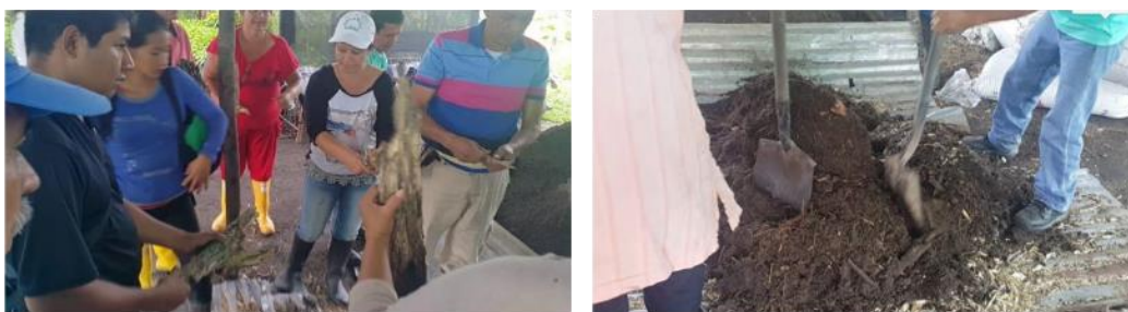
Capacitación con Agroindustria Sasha Meta