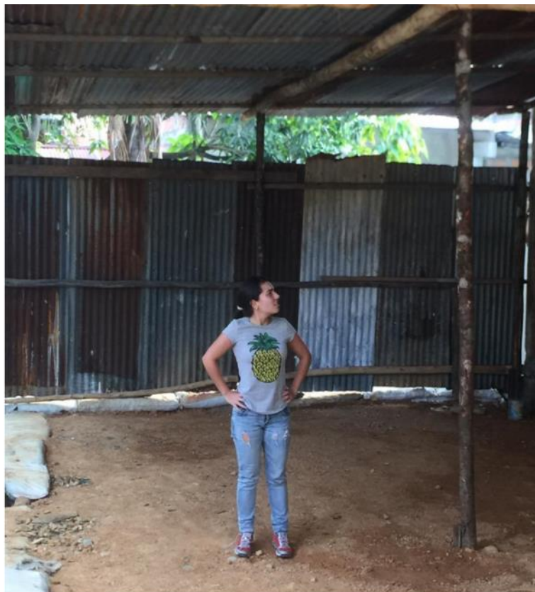
Punto de acopio