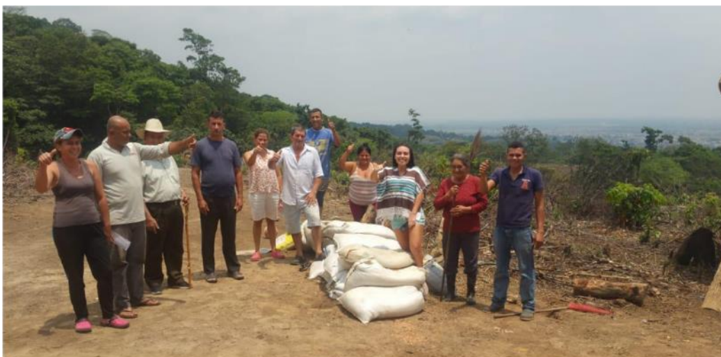
Compost realizado por los habitantes de La Nohora y Agroindustrias Sasha Meta