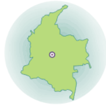
Diócesis de Fontibón