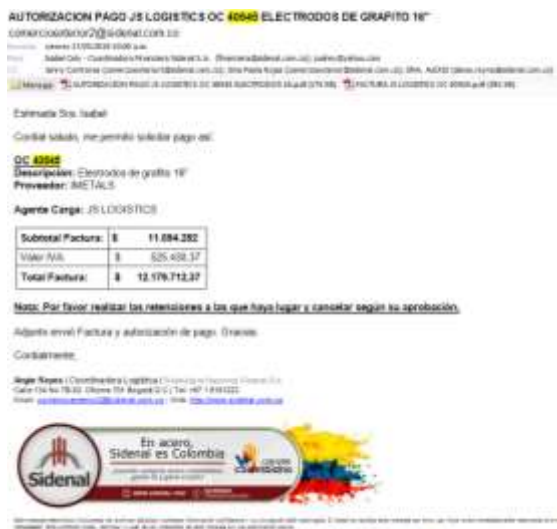
Figura 8. Ejemplo autorización de pago factura flete internacional. Adaptado de “Archivo del departamento de comercio exterior”, 2019.

3.2.6. Revisar Facturación Flete Internacional: El agente envía la factura vía correo electrónico y luego en físico, cuando se recibe en físico, se revisa que lo factura corresponda con lo cotizado, se realiza la autorización de pago y finalmente se solicita el pago al departamento de contabilidad de la empresa.