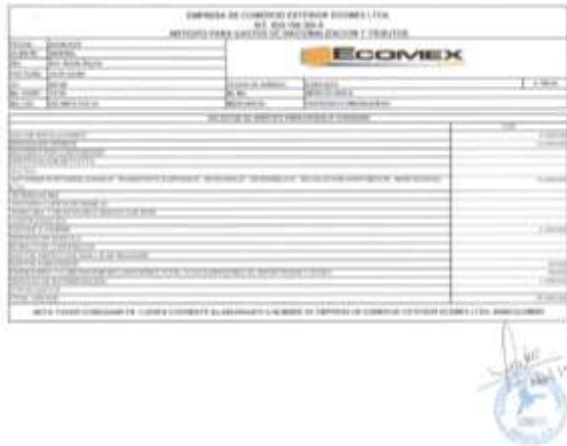
Figura 7. Ejemplo de anticipo de terceros autorizado. Adaptado de “Archivo del departamento de comercio exterior”, 2019.

3.2.6. Revisar Facturación Flete Internacional: El agente envía la factura vía correo electrónico y luego en físico, cuando se recibe en físico, se revisa que lo factura corresponda con lo cotizado, se realiza la autorización de pago y finalmente se solicita el pago al departamento de contabilidad de la empresa.