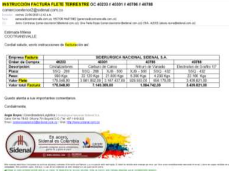
Figura 9. Ejemplo de instrucción de facturación flete terrestre.

valor coincide con el de la instrucción y que los datos de la empresa estén correctos, finalmente se envía en físico al departamento de contabilidad de la empresa para realice el pago.