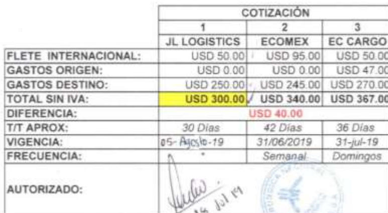
Figura 2. Ejemplo de comparativo para flete internacional autorizado. Adaptado de “Archivo del departamento de comercio exterior”, 2019.