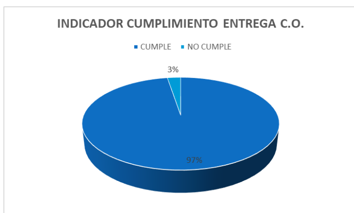
Grafico 3: Realizado por Luis Felipe Mojica

Podemos notar en el último indicador de eficiencia para Certificados de Origen presentado por la empresa, en el cual se ve una eficiencia del 97%, muy por encima de lo que antes se tenía, esto gracias a la factibilidad del proyecto ya utilizado en todos los procesos de Certificados.