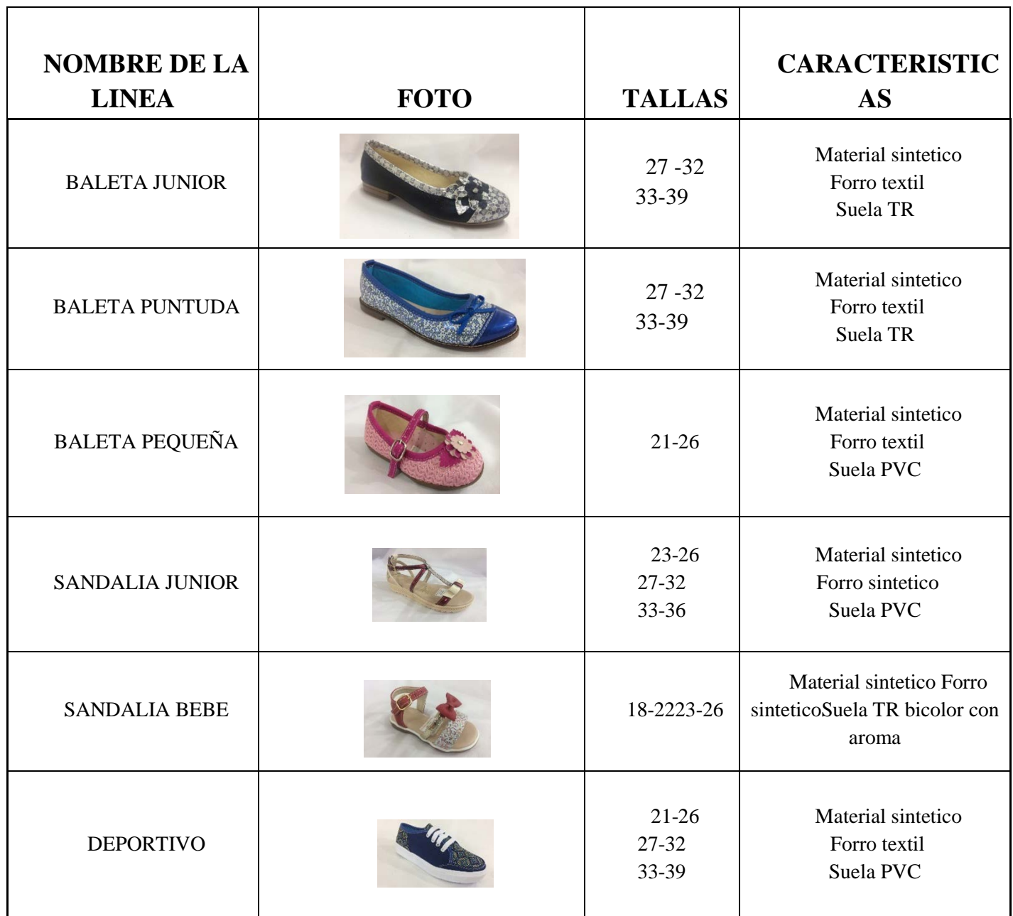
Tabla 1 Línea de productos