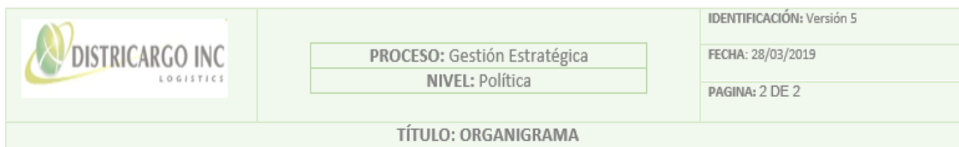
Figura 1. Personal involucrado en la elaboración del organigrama